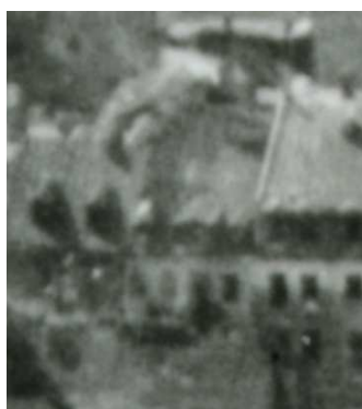
Fragment panoramy Lublina, lata 30., Szeroka 8/A fragment of panorama of Lublin in the 1930s, Szeroka 8,