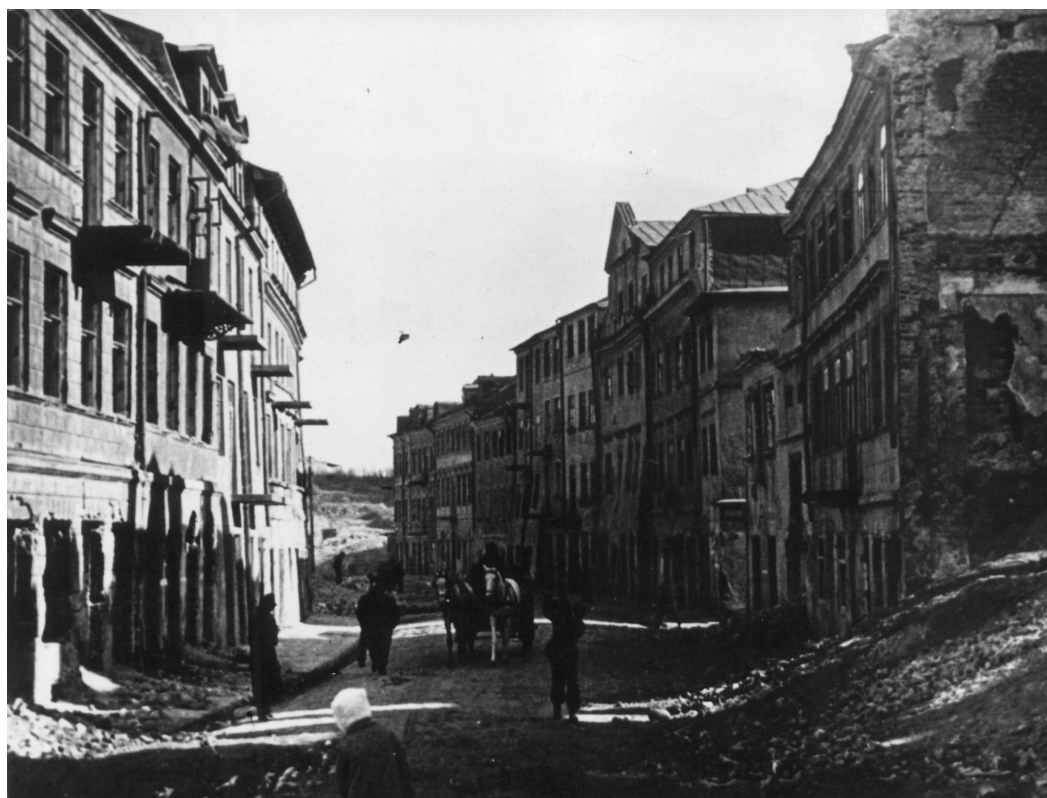
Szeroka 8, druga od lewej, autor nieznany, 1943, kolekcja Symchy Wajsa.