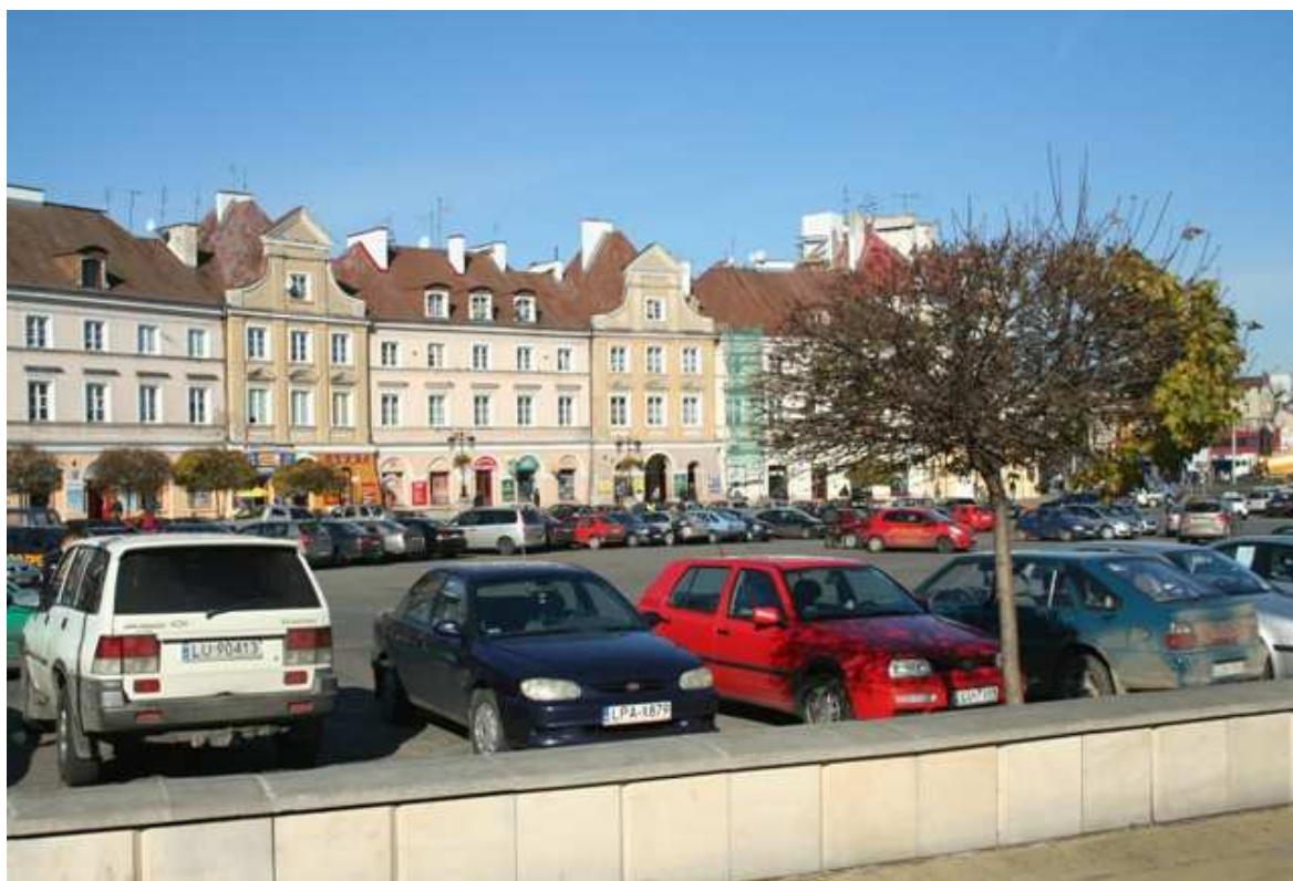
Szeroka 8, fot. Marcin Fedorowicz, 2010.