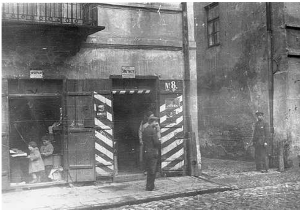
Szeroka 8, fragment kamienicy, autor Stefan Kielsznia, ok. 1938, własność Jerzego Kielszni.