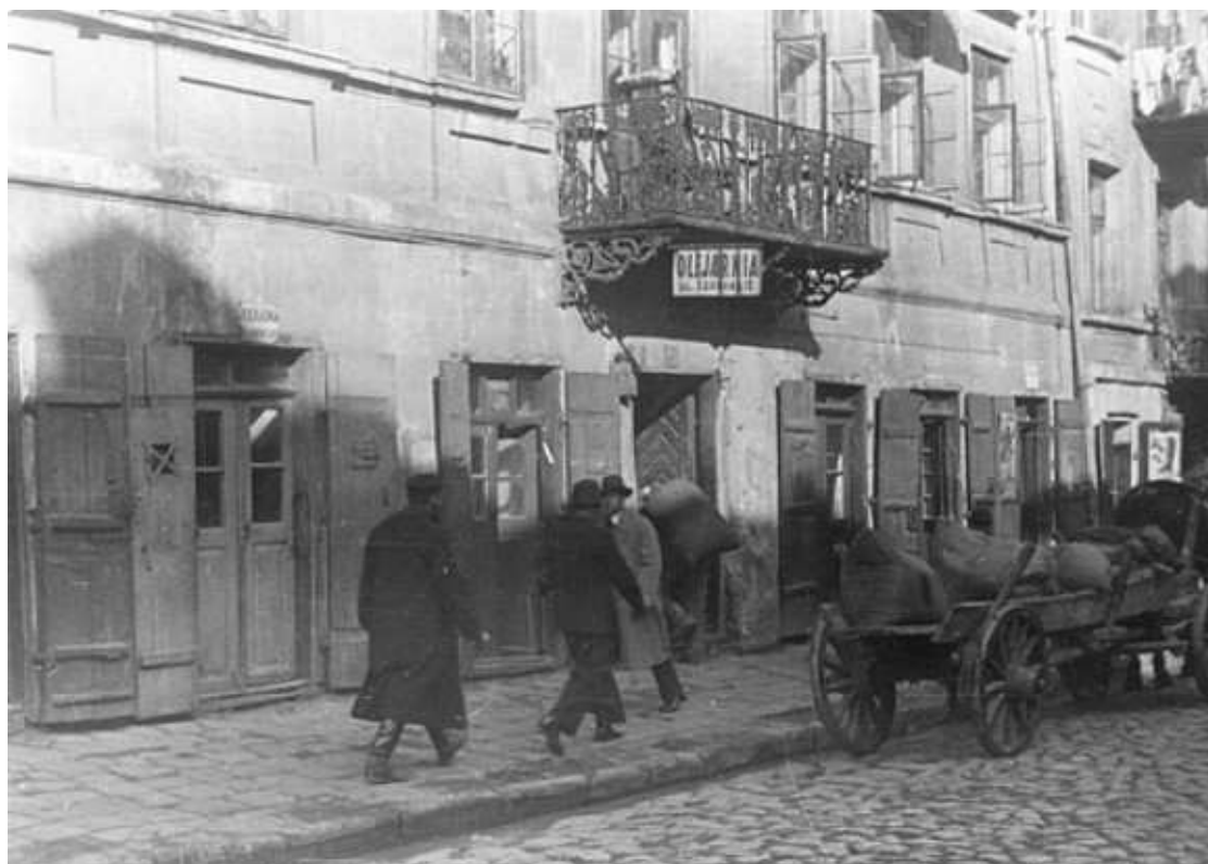
Szeroka 12, fragment kamienicy, autor Stefan Kielsznia, ok. 1938, własność Jerzego Kielszni.