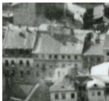
Fragment panoramy Lublina, lata 30., Szeroka 12/A fragment of panorama of Lublin in the 1930s, Szeroka 12,