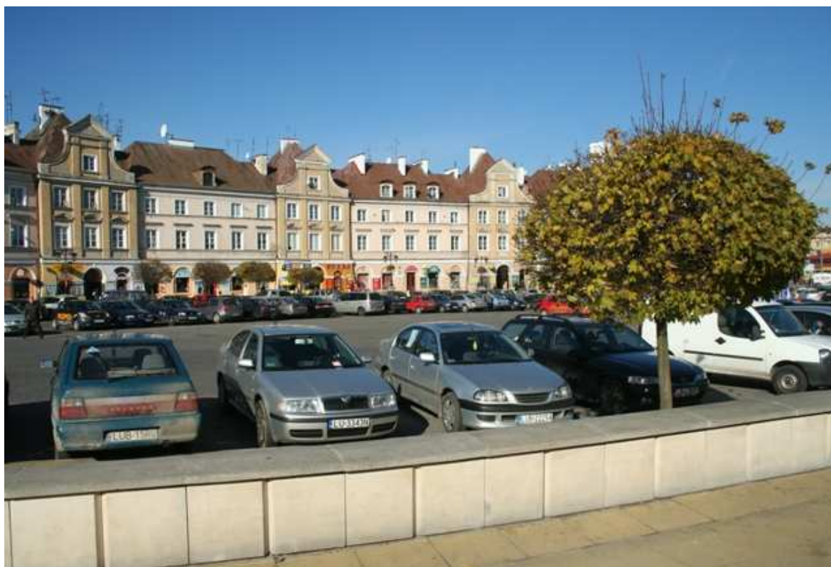
Szeroka 12, fot. Marcin Fedorowicz, 2010.