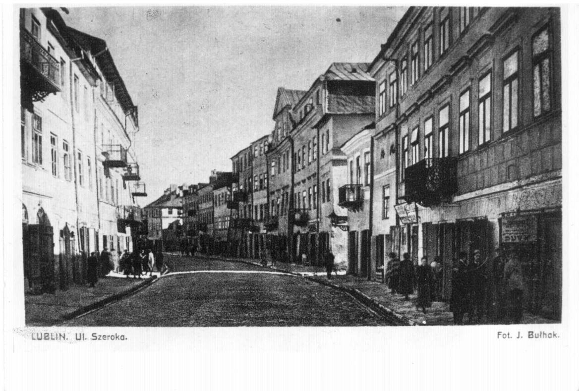
Szeroka 1, nieruchomość szósta od prawej, autor Jan Bułhak, 1921, kolekcja pocztówkowa, wł. Archiwum TNN.