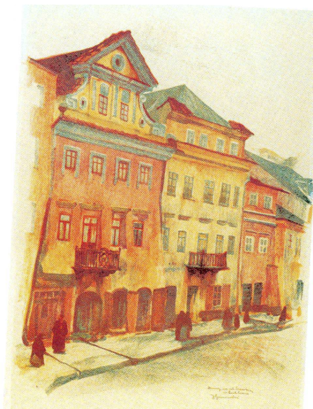
Szeroka 13, kamienica pierwsza od lewej, autor Jan Kandy Gumowski, litografia opublikowana w 1918, własność Muzeum Lubelskie.