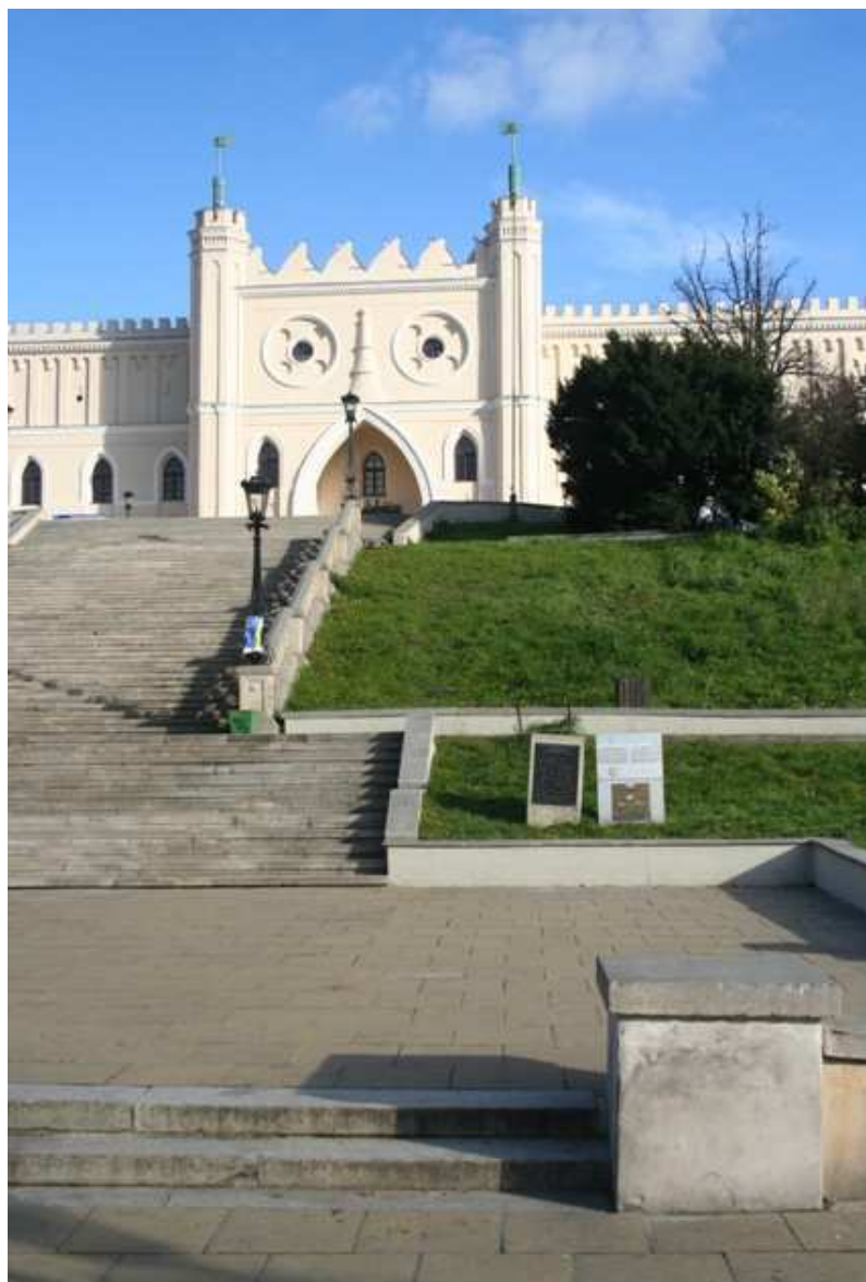
Szeroka 13, fot. Marcin Fedorowicz, 2010.