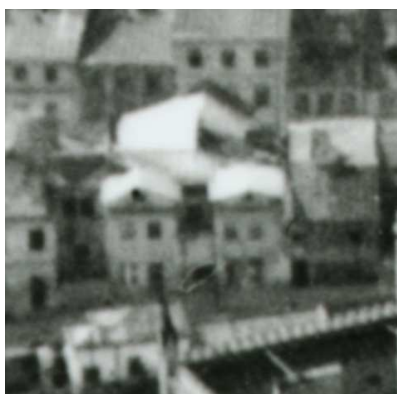
Fragment panoramy Lublina, lata 30., Szeroka 13/A fragment of panorama of Lublin in the 1930s, Szeroka 13,