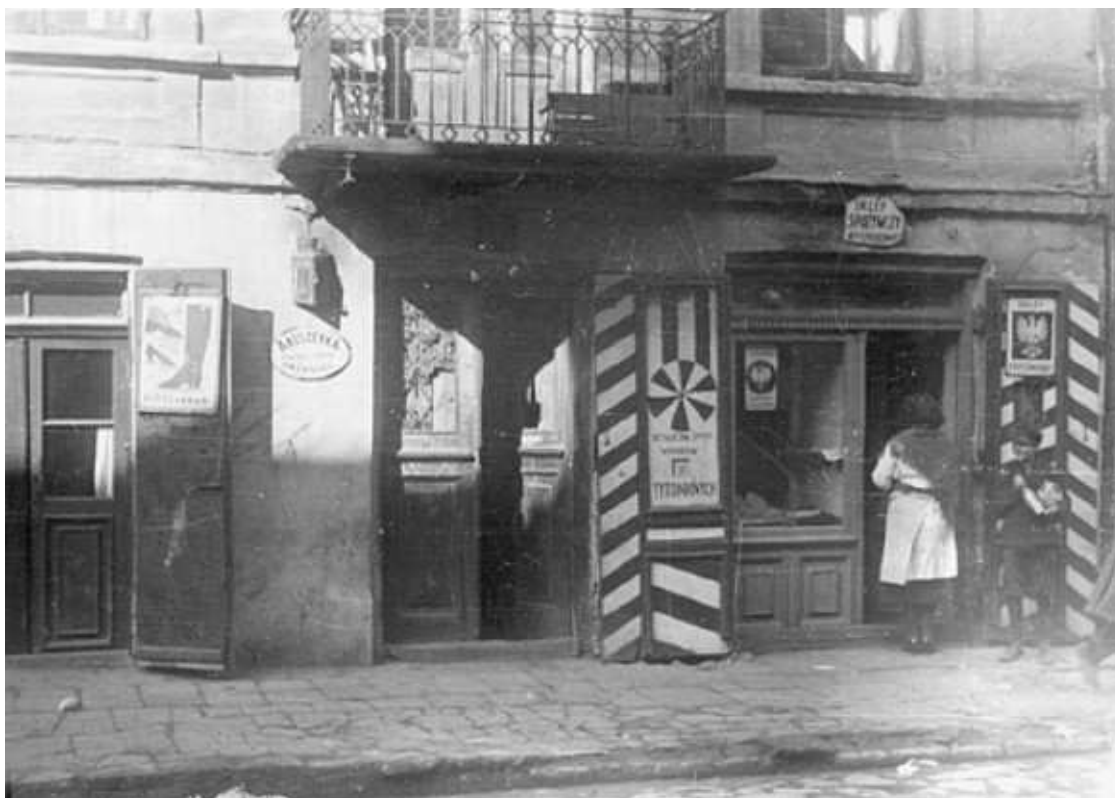
Szeroka 14, fragment kamienicy, autor Stefan Kielsznia, ok. 1938, własność Jerzego Kielszni.