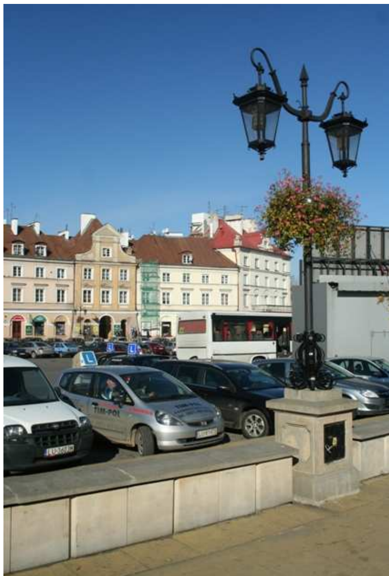
Szeroka 14, fot. Marcin Fedorowicz, 2010.