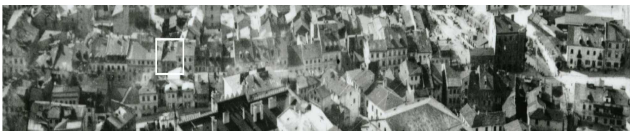
Fragment panoramy Lublina, lata 30., ul. Szeroka/A fragment of panorama of Lublin in the 1930s, Szeroka street,