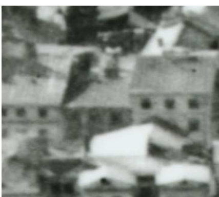
Fragment panoramy Lublina, lata 30., Szeroka 14/A fragment of panorama of Lublin in the 1930s, Szeroka 14,