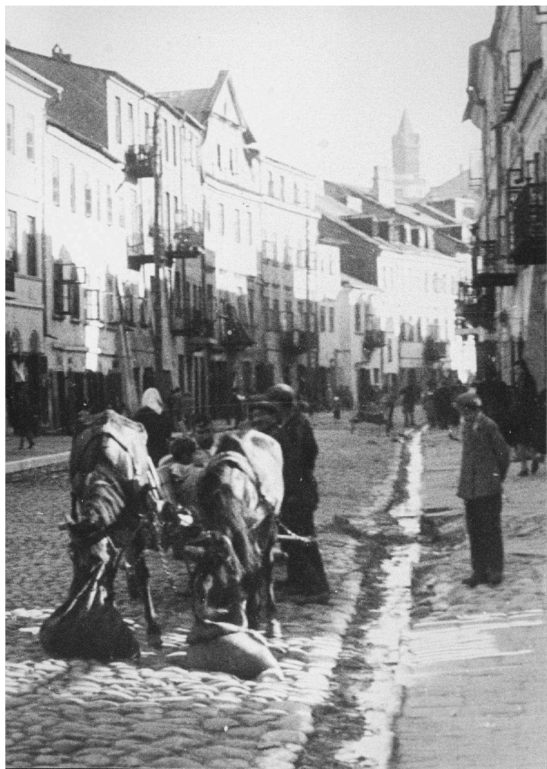
Nieistniejąca od wojny ulica Szeroka w Żydowskim Mieście w Lublinie. Lata trzydzieste. Ze zbiorów Biblioteki Lopac

Szeroka 19, kamienica druga od lewej, autor nieznany, lata 30, własność Archiwum WUOZ w Lublinie.