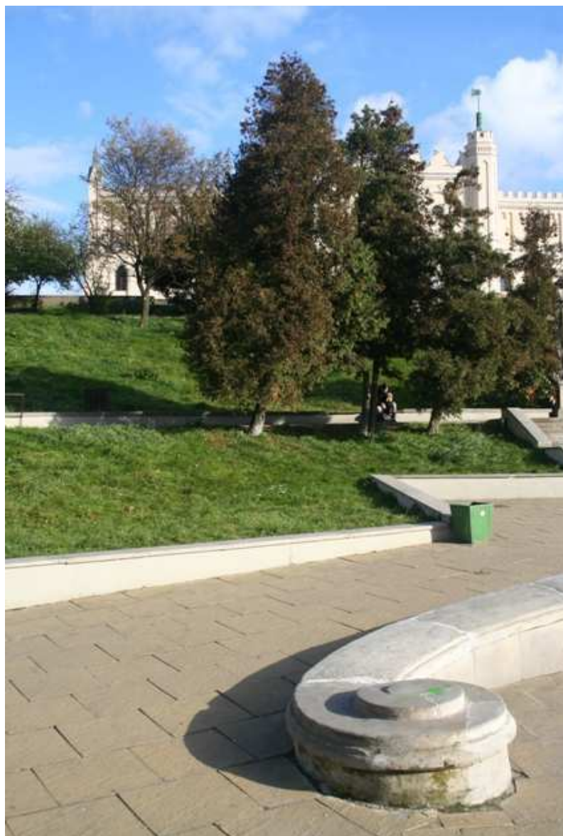
Szeroka 19, fot. Marcin Fedorowicz, 2010.