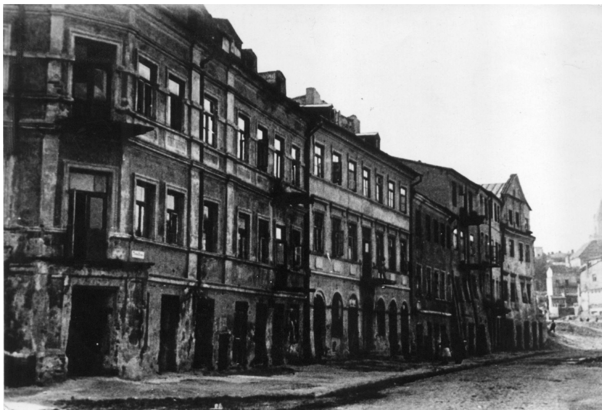
Szeroka 19, kamienica czwarta od lewej, autor nieznany, ok. 1943, kolekcja Symchy Wajsa.