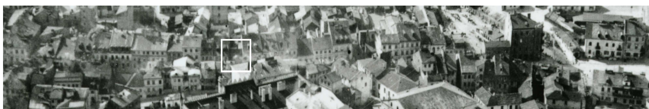
Fragment panoramy Lublina, lata 30., ul. Szeroka/A fragment of panorama of Lublin in the 1930s, Szeroka street,