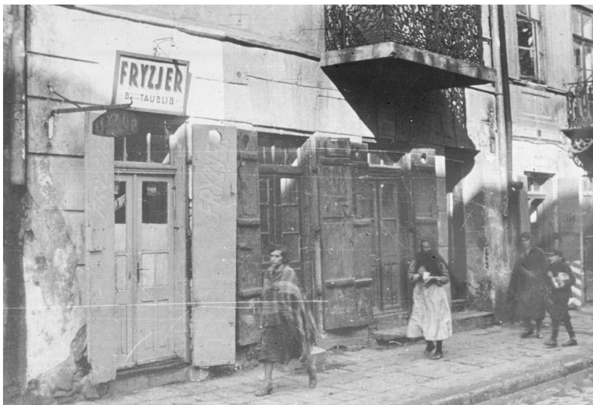
Szeroka 22. fragment kamienicy, autor Stefan Kielsznia, ok. 1938, własność Jerzego Kielszni.