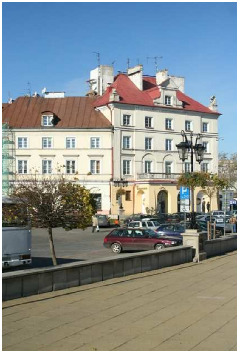
Szeroka 22, fot. Marcin Fedorowicz, 2010.