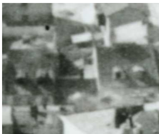
Fragment panoramy Lublina, lata 30., Szeroka 22/A fragment of panorama of Lublin in the 1930s, Szeroka 22,