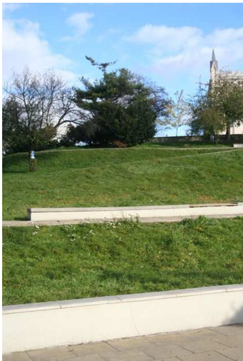
Szeroka 23, fot. Marcin Fedorowicz, 2010.