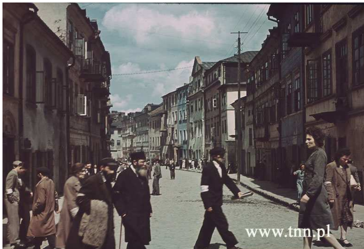
Szeroka 23, nieruchomość jedenasta od prawej, autor Max Kirnberger, 1941, własność Deutches Historisches Museum w Berlinie.