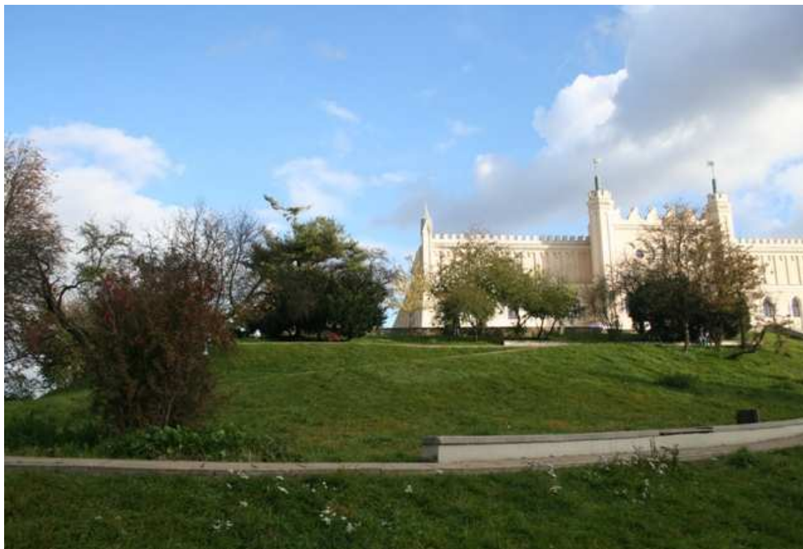
Szeroka 23, fot. Marcin Fedorowicz, 2010.