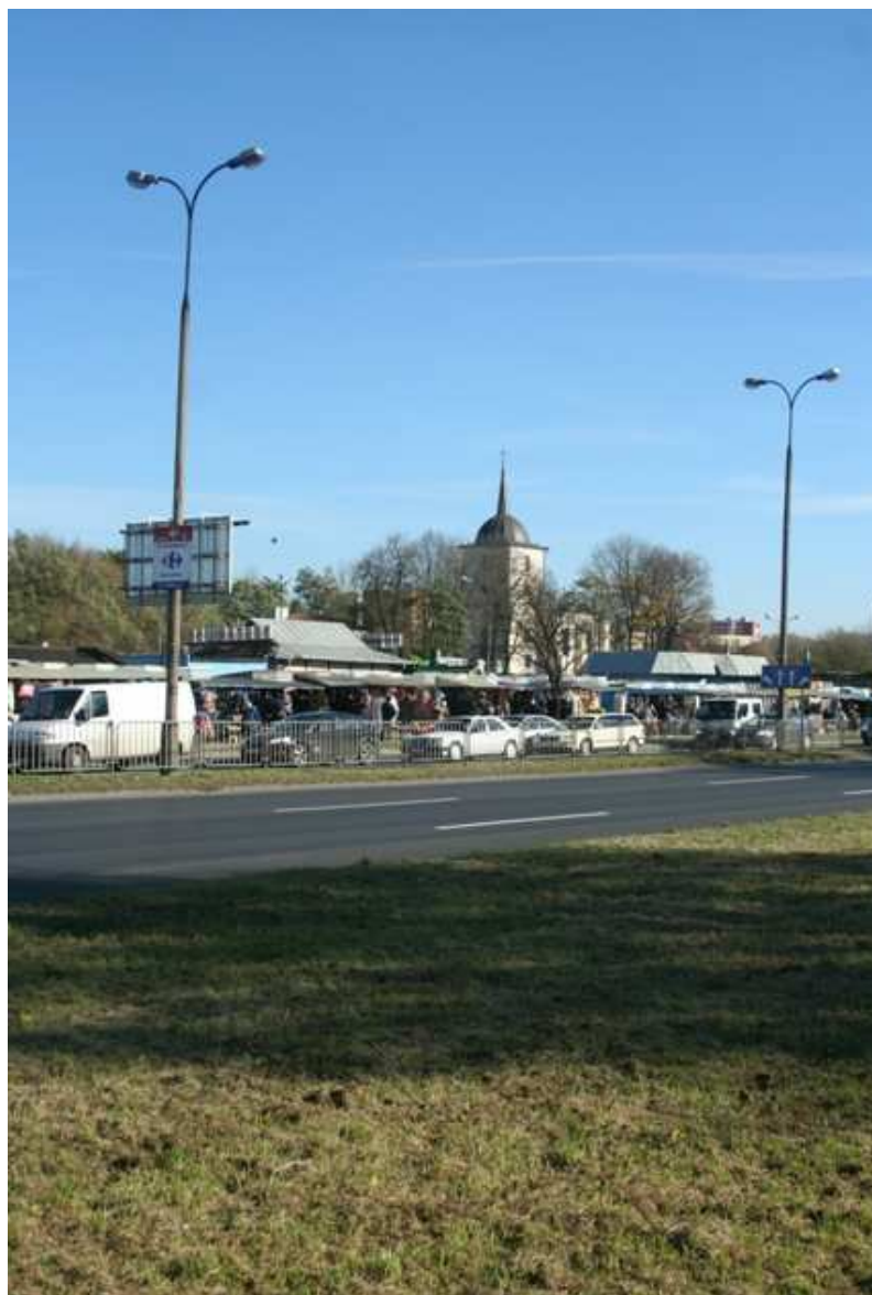
Szeroka 29, fot. Marcin Fedorowicz, 2010.