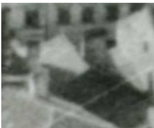
Fragment panoramy Lublina, lata 30., Szeroka 29/A fragment of panorama of Lublin in the 1930s, Szeroka 29,