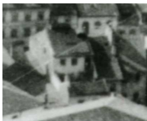
Fragment panoramy Lublina, lata 30., Szeroka 31/A fragment of panorama of Lublin in the 1930s, Szeroka 31,