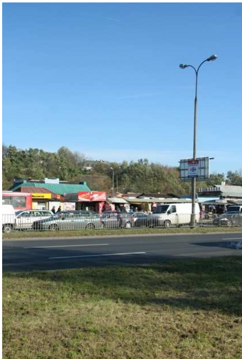
Szeroka 31, 2010.