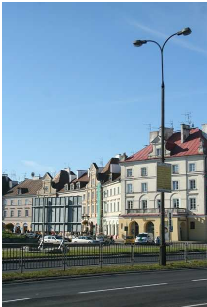
Szeroka 32, fot. Marcin Fedorowicz, 2010.