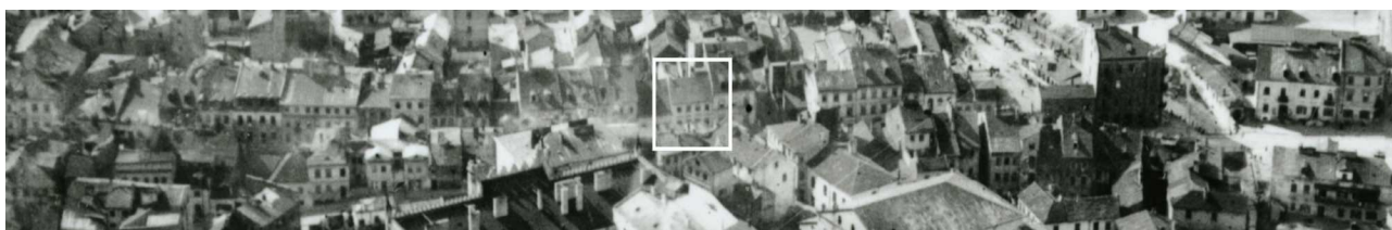
Fragment panoramy Lublina, lata 30., ul. Szeroka/A fragment of panorama of Lublin in the 1930s, Szeroka street,