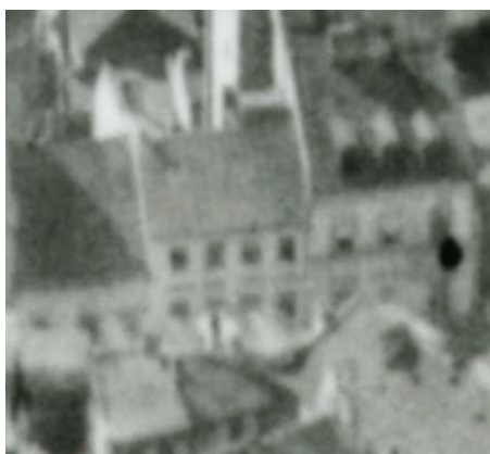
Fragment panoramy Lublina, lata 30., Szeroka 32/A fragment of panorama of Lublin in the 1930s, Szeroka 1,