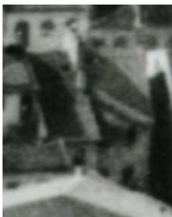
Fragment panoramy Lublina, lata 30., Szeroka 33/A fragment of panorama of Lublin in the 1930s, Szeroka 33,