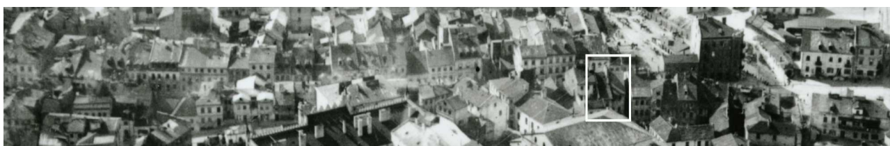
Fragment panoramy Lublina, lata 30., ul. Szeroka/A fragment of panorama of Lublin in the 1930s, Szeroka street,