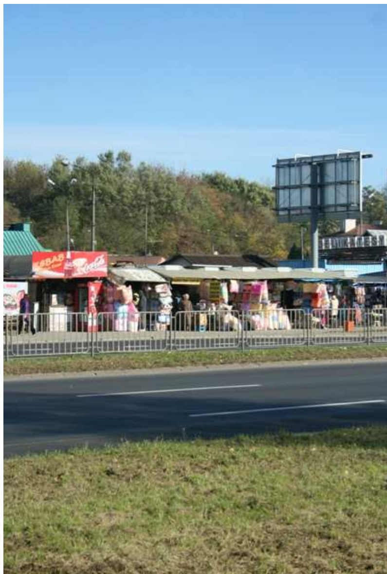
Szeroka 33, fot. Marcin Fedorowicz, 2010.