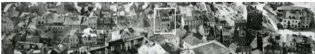
Fragment panoramy Lublina, lata 30., ul. Szeroka/A fragment of panorama of Lublin in the 1930s, Szeroka street,