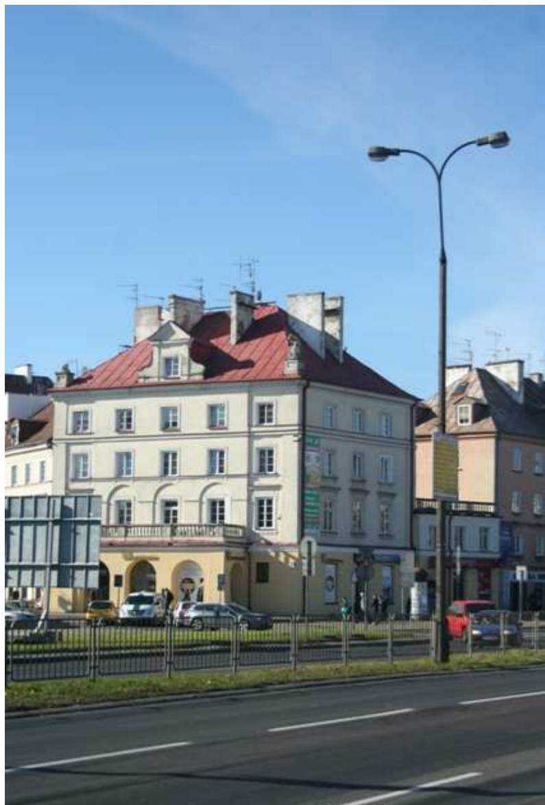
Szeroka 34, fot. Marcin Fedorowicz, 2010.