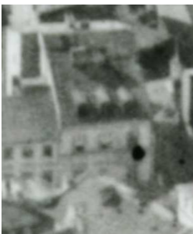
Fragment panoramy Lublina, lata 30., Szeroka 34/A fragment of panorama of Lublin in the 1930s, Szeroka 34,