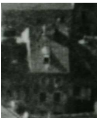
Fragment panoramy Lublina, lata 30., Szeroka 37/A fragment of panorama of Lublin in the 1930s, Szeroka 1,