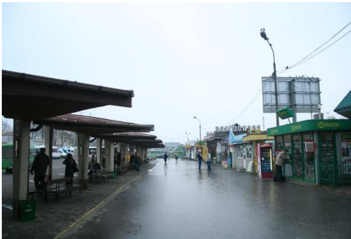
Szeroka 37, fot. Marcin Fedorowicz, 2010.