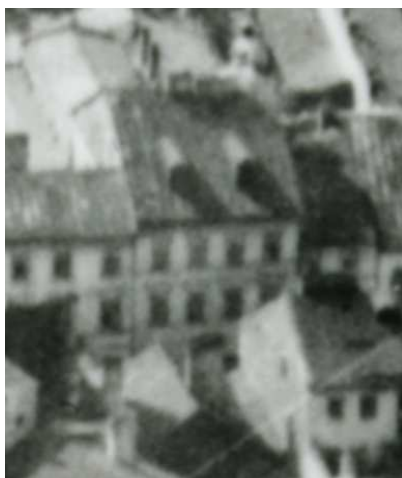
Fragment panoramy Lublina, lata 30., Szeroka 40/A fragment of panorama of Lublin in the 1930s, Szeroka 40,