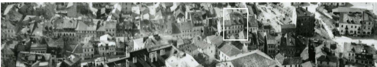
Fragment panoramy Lublina, lata 30., ul. Szeroka/A fragment of panorama of Lublin in the 1930s, Szeroka street,