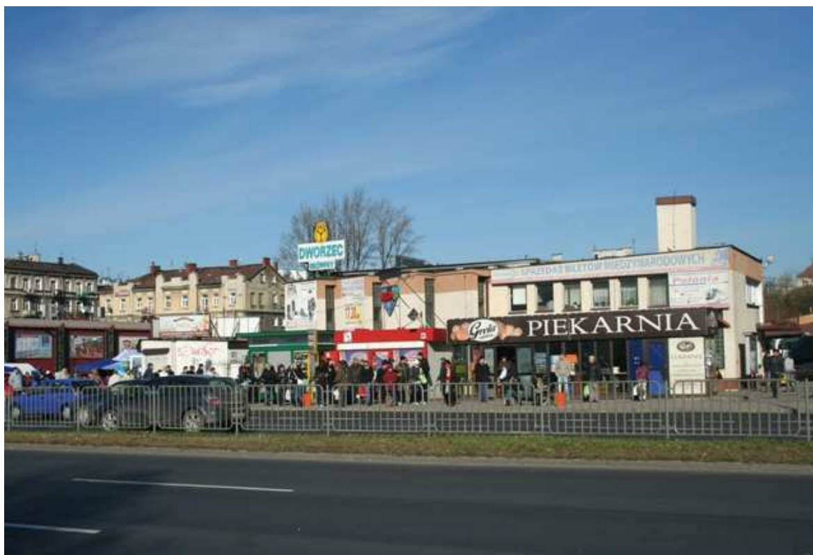
Szeroka 40, fot. Marcin Fedorowicz, 2010.