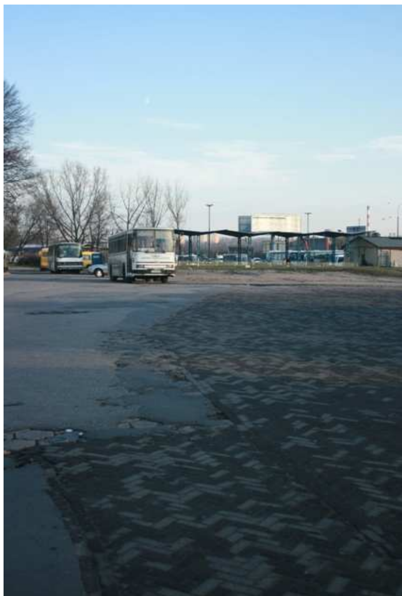
Szeroka 43, fot. Marcin Fedorowicz, 2010.