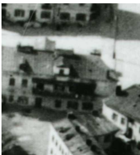
Fragment panoramy Lublina, lata 30., Szeroka 43/Ruska 21/A fragment of panorama of Lublin in the 1930s, Szeroka 43/Ruska 21,