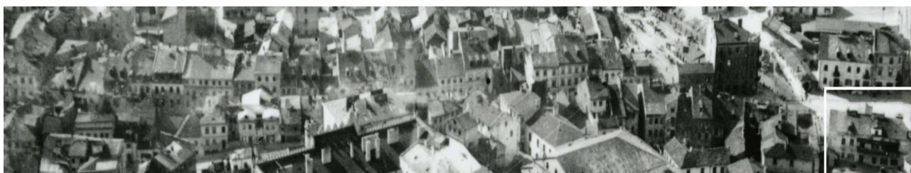
Fragment panoramy Lublina, lata 30., ul. Szeroka/A fragment of panorama of Lublin in the 1930s, Szeroka street,