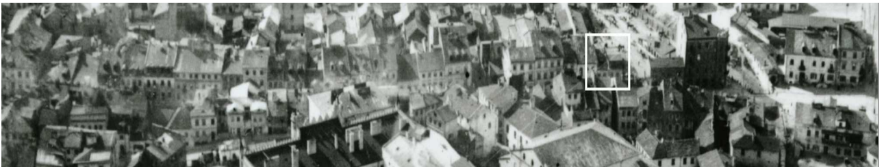
Fragment panoramy Lublina, lata 30., ul. Szeroka/A fragment of panorama of Lublin in the 1930s, Szeroka street,