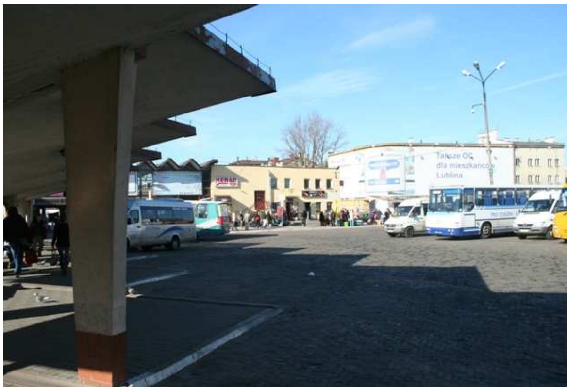
Szeroka 46, fot. Marcin Fedorowicz, 2010.