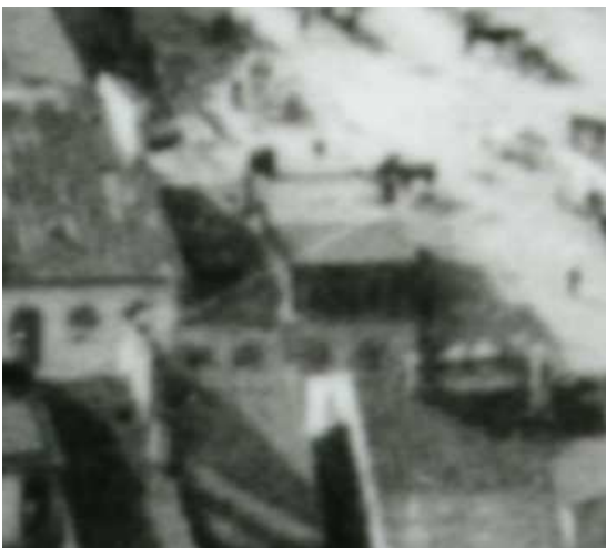
Fragment panoramy Lublina, lata 30., Szeroka 46/A fragment of panorama of Lublin in the 1930s, Szeroka 46,