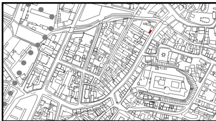
LOKALIZACJA NIERUCHOMOŚCI - Szeroka 46 LOCATION OF THE PROPERTY - Szeroka 46