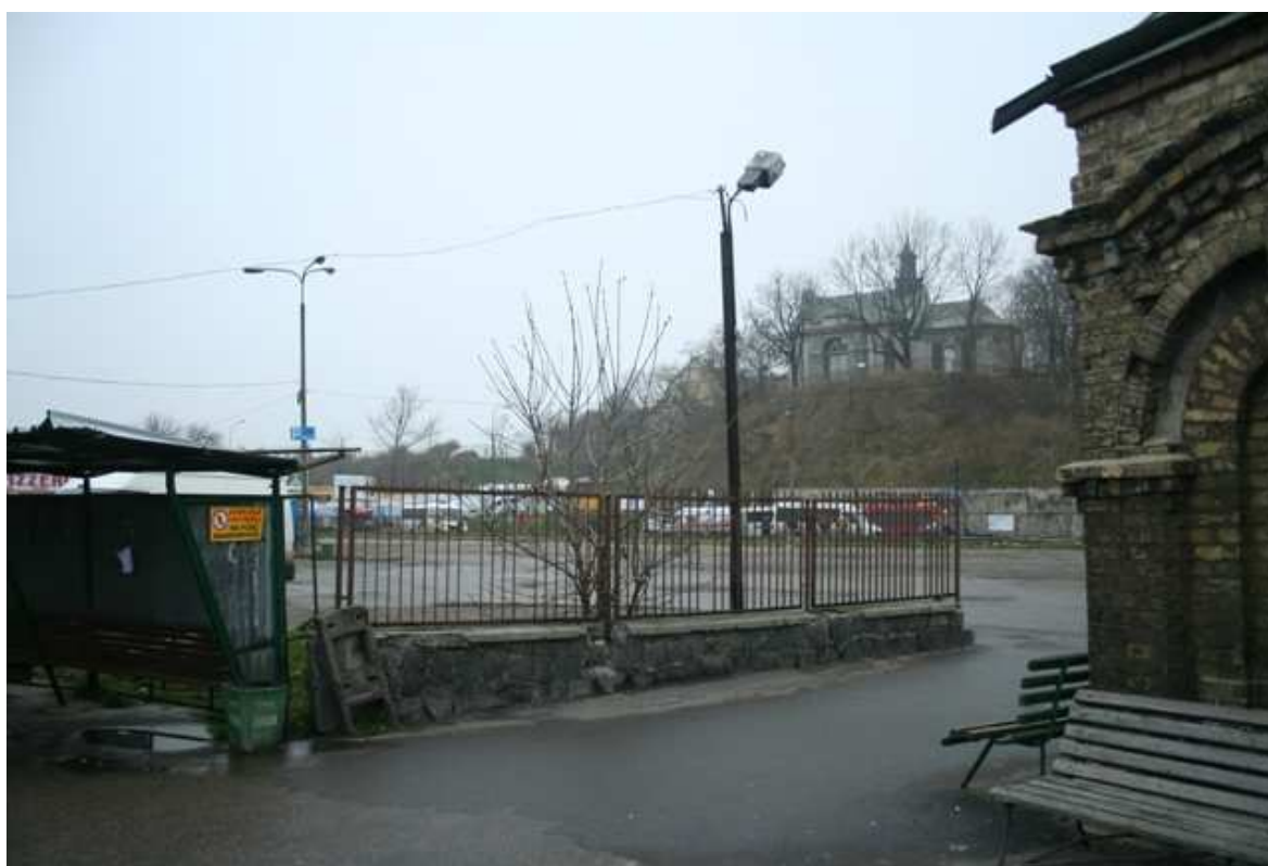
Szeroka 52, fot. Marcin Fedorowicz, 2010.