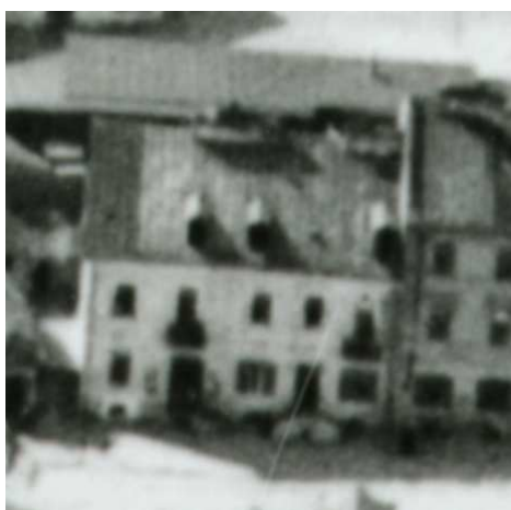
Fragment panoramy Lublina, lata 30., Szeroka 52/A fragment of panorama of Lublin in the 1930s, Szeroka 52,