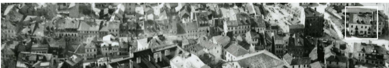
Fragment panoramy Lublina, lata 30., ul. Szeroka/A fragment of panorama of Lublin in the 1930s, Szeroka street,