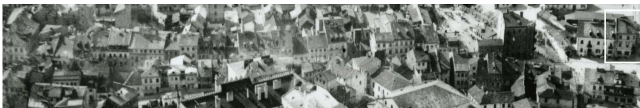
Fragment panoramy Lublina, lata 30., ul. Szeroka/A fragment of panorama of Lublin in the 1930s, Szeroka street,