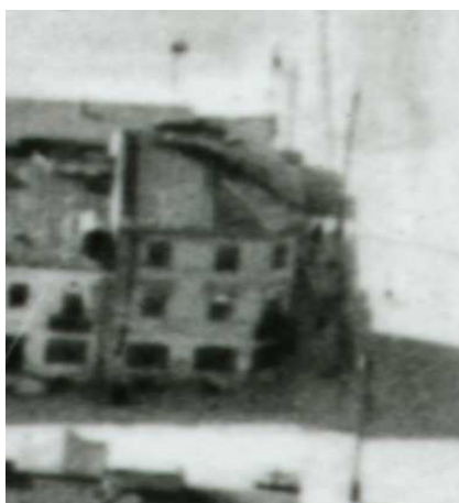
Fragment panoramy Lublina, lata 30., Szeroka 54/Ruska 19/A fragment of panorama of Lublin in the 1930s, Szeroka 54/Ruska19,