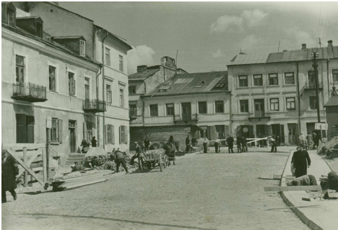
Szeroka 54, kamienica druga od lewej, ulica Szeroka przed ostatecznym wykończeniem, autor nieznany, 1939, z albumu Roboty Publiczne finansowane przez Fundusz Pracy w Lublinie, przechowywane Miejski Konserwator Zabytków.