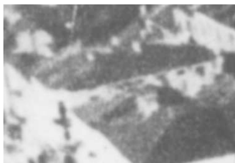
Fragment panoramy Lublina, lata 30., Noworybna 2/ A fragment of panorama of Lublin in the 1930s, Noworybna 2,