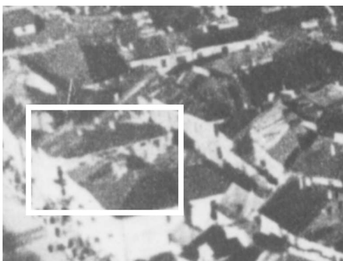
Fragment panoramy Lublina, lata 30., ul. Noworybna/ A fragment of panorama of Lublin in the 1930s, Noworybna street,