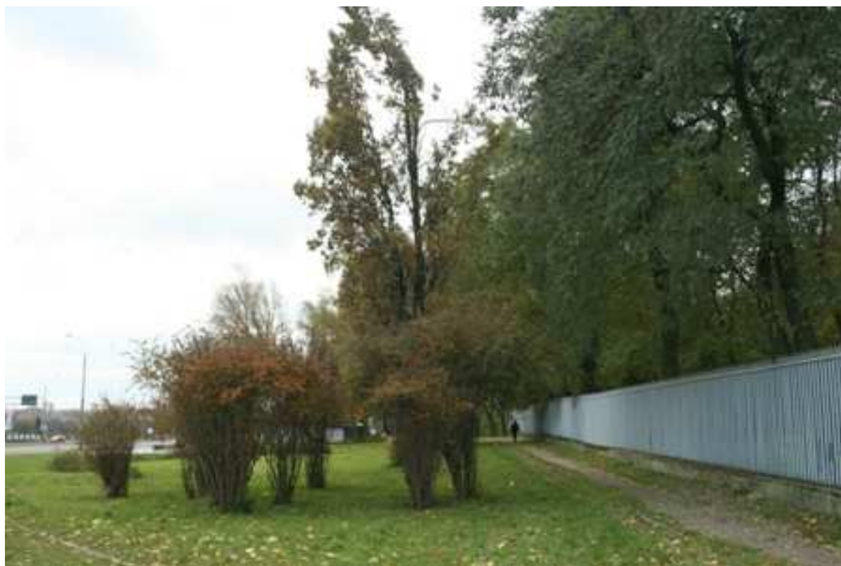
Plac Krawiecki 1, fot. Marcin Fedorowicz, 2010.