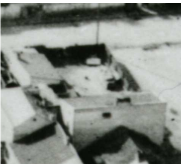
Fragment panoramy Lublina, lata 30., Plac Krawiecki 1/A fragment of panorama of Lublin in the 1930s, Plac Krawiecki 1,