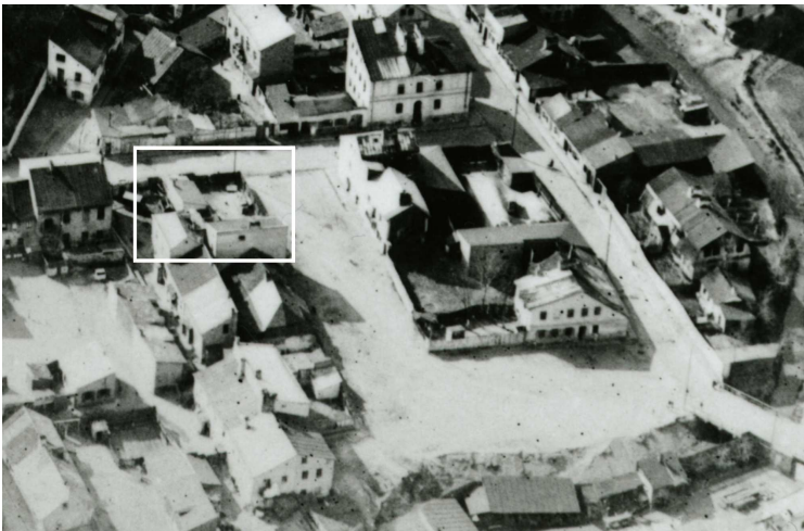
Fragment panoramy Lublina, lata 30., Plac Krawiecki/A fragment of panorama of Lublin in the 1930s, Plac Krawiecki street,