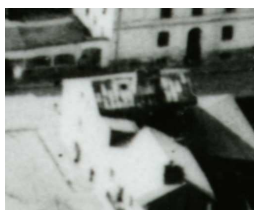
Fragment panoramy Lublina, lata 30., Plac Krawiecki 2/Krawiecka 55/A fragment of panorama of Lublin in the 1930s, Plac Krawiecki 2/Krawiecka 55,