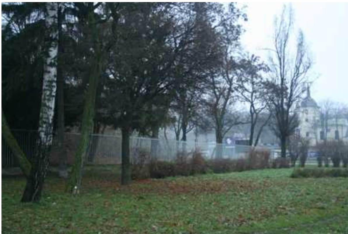
Plac Krawiecki 2, 2010.