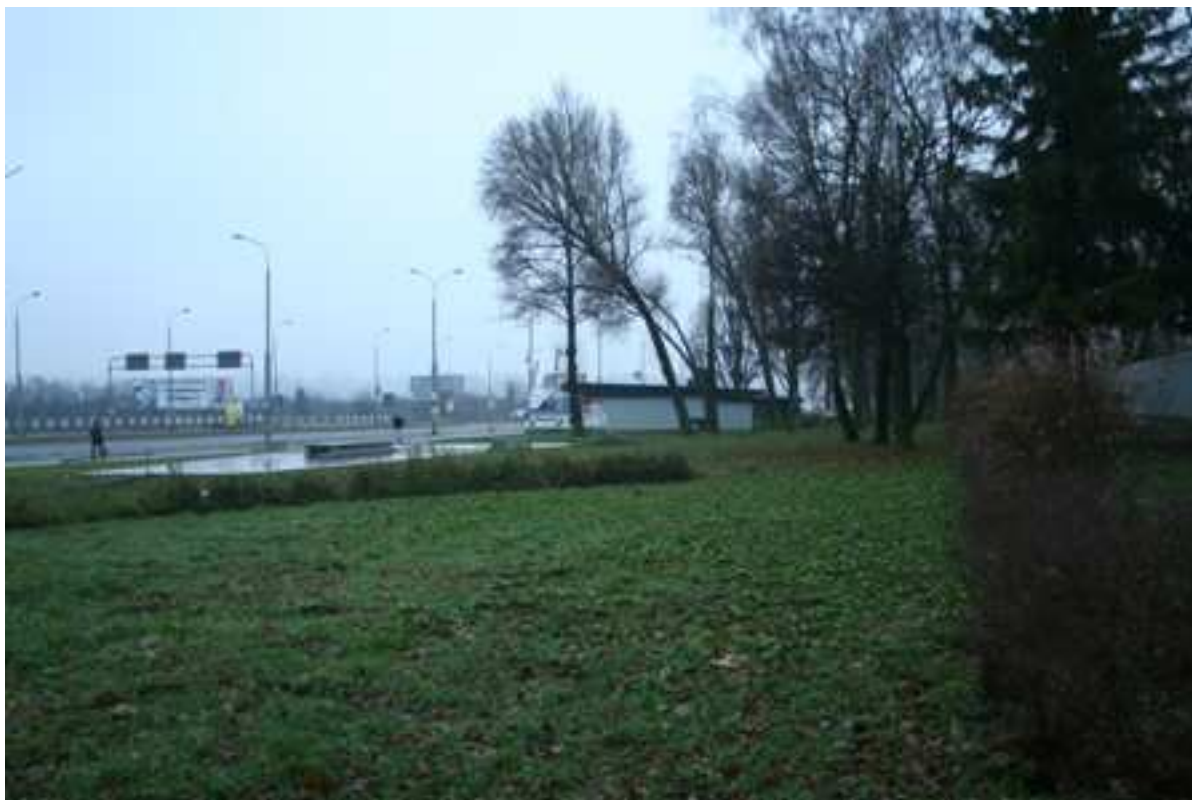
Plac Krawiecki 3, fot. Marcin Fedorowicz, 2010.