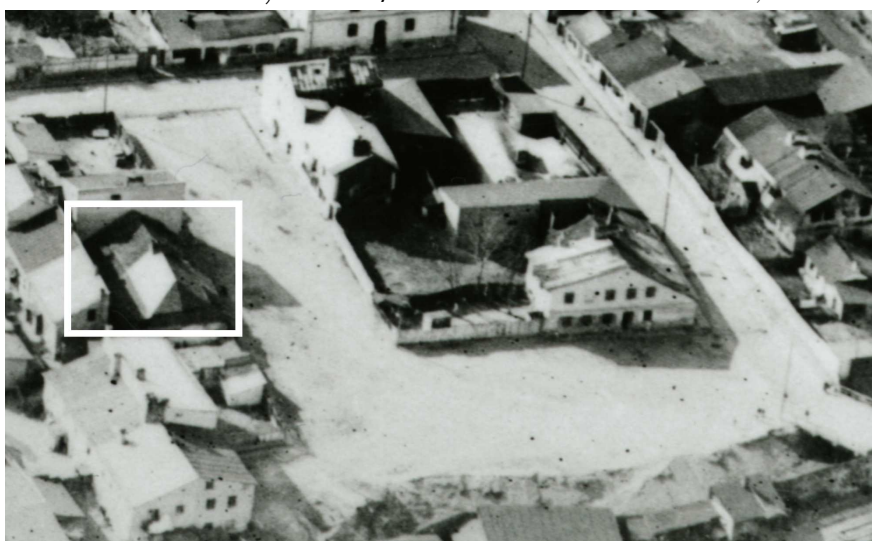
Fragment panoramy Lublina, lata 30., Plac Krawiecki/A fragment of panorama of Lublin in the 1930s, Plac Krawiecki street,