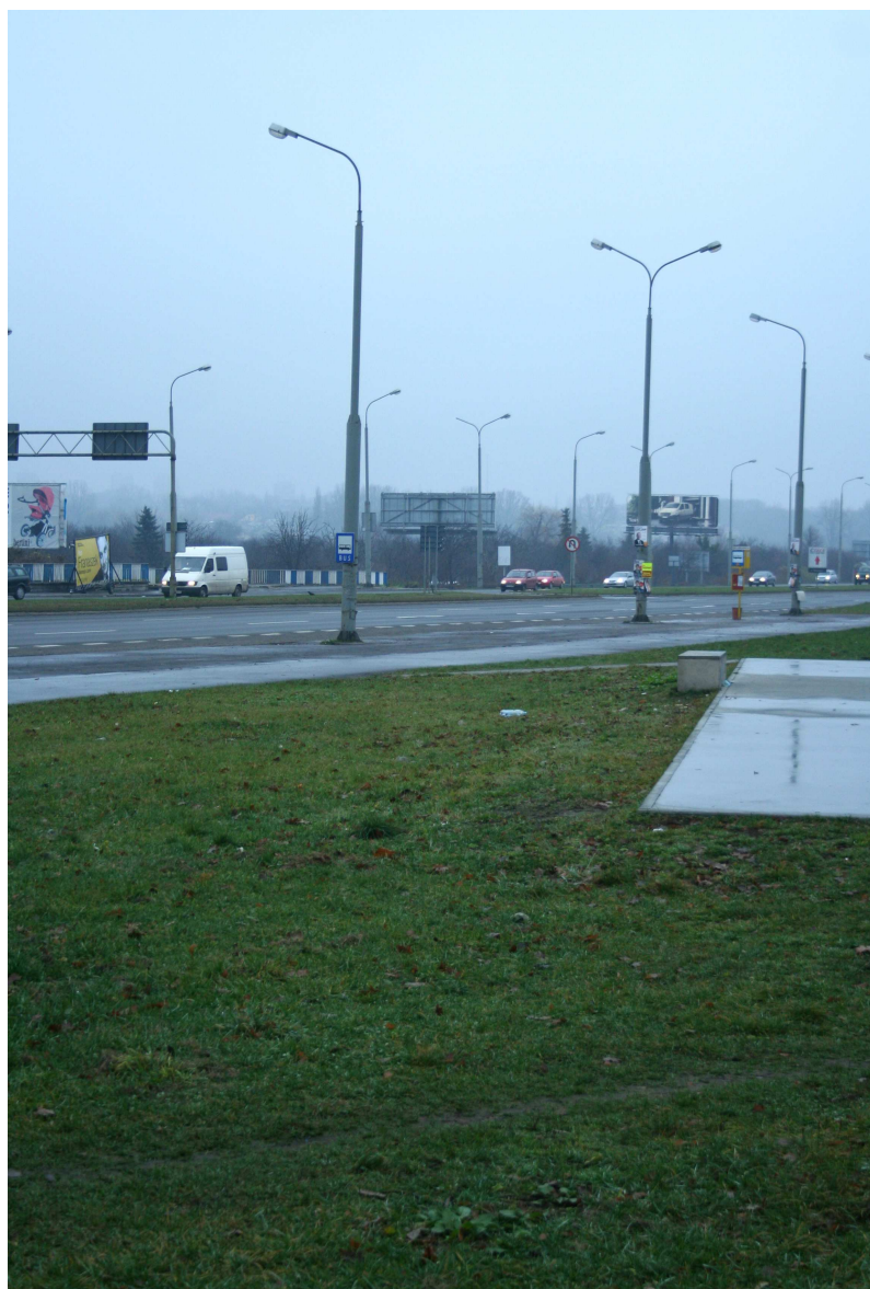
Plac Krawiecki 5, fot. Marcin Fedorowicz, 2010.