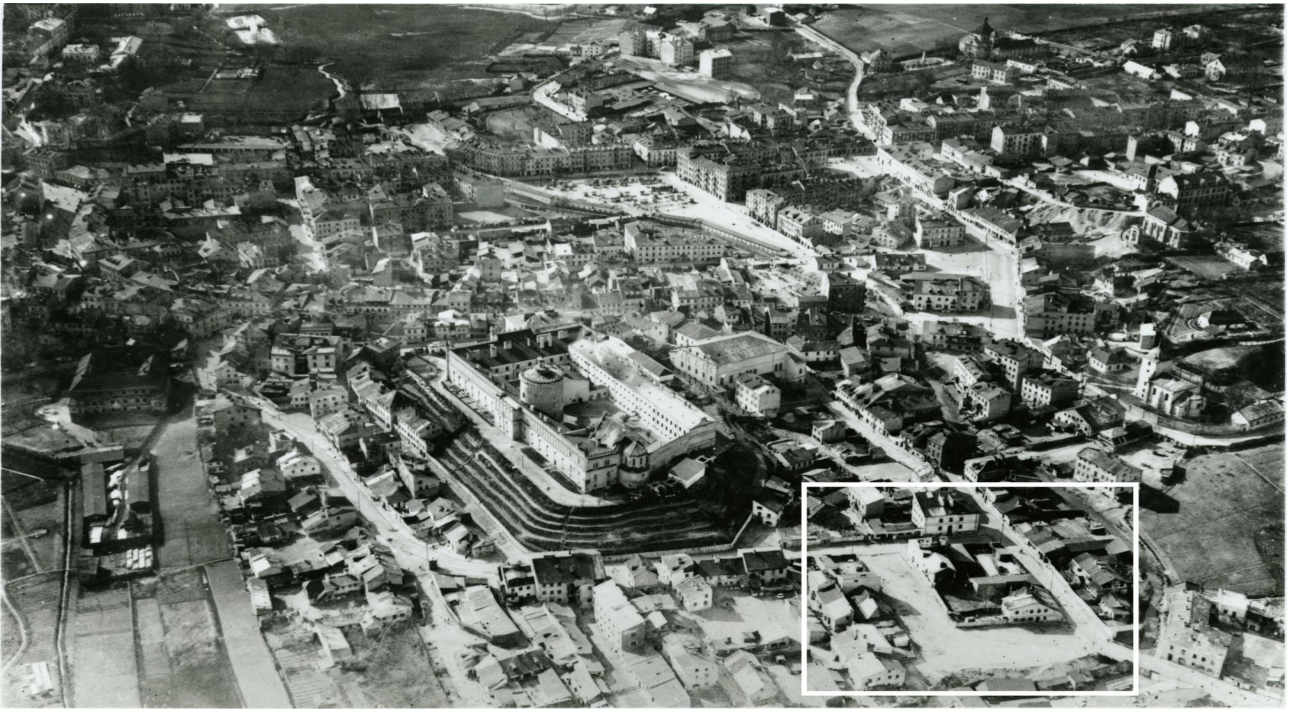
Panorama Lublina, lata 30./Panorama of Lublin in the 1930s,