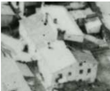
Fragment panoramy Lublina, lata 30., Plac Krawiecki 5/Wąska 6/A fragment of panorama of Lublin in the 1930s, Plac Krawiecki 5/Wąska 6,