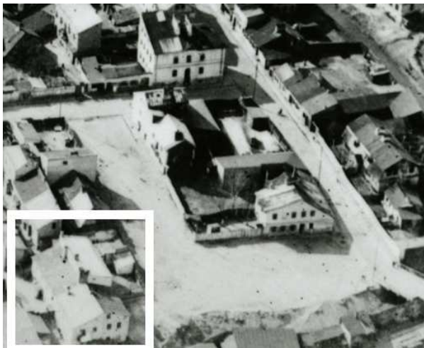
Fragment panoramy Lublina, lata 30., Plac Krawiecki/A fragment of panorama of Lublin in the 1930s, Plac Krawiecki street,