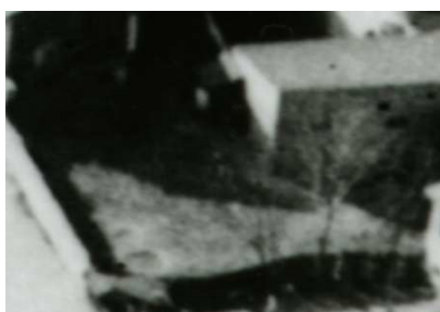
Fragment panoramy Lublina, lata 30., Plac Krawiecki 6/A fragment of panorama of Lublin in the 1930s, Plac Krawiecki 6,