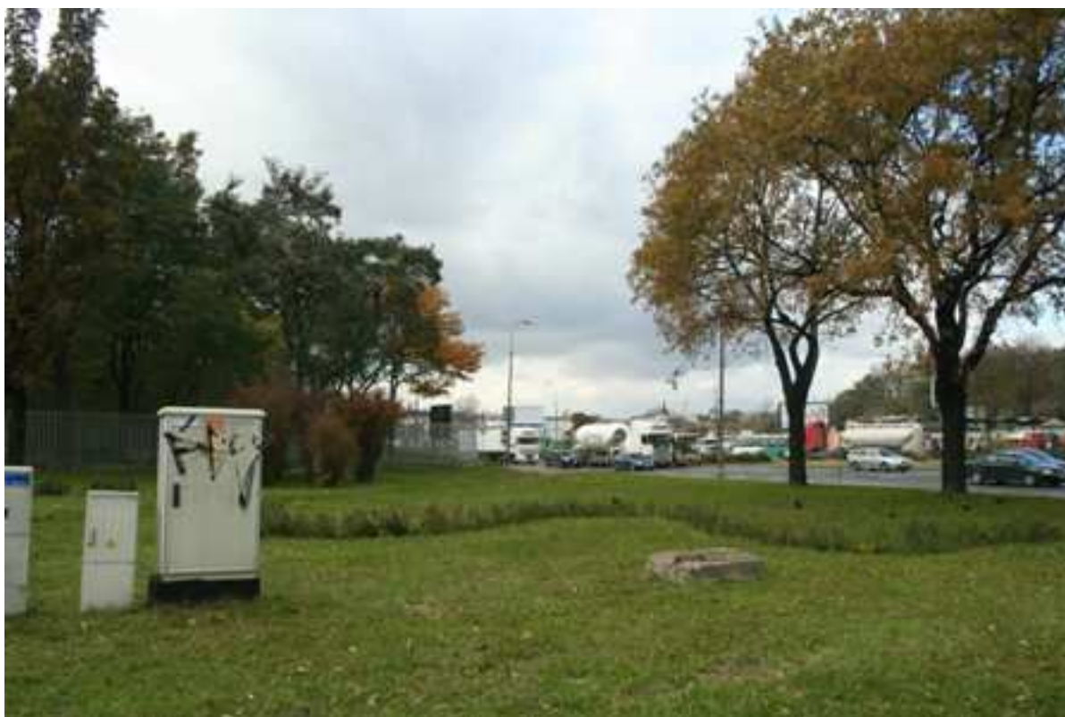
Plac Krawiecki 6, fot. Marcin Fedorowicz, 2010.