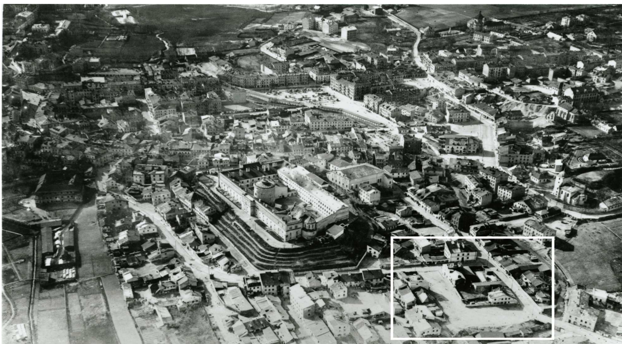
Panorama Lublina, lata 30./Panorama of Lublin in the 1930s,