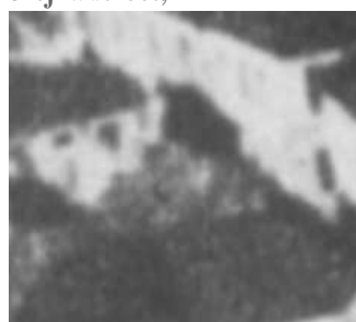
Fragment panoramy Lublina, lata 30., Olejna 12/ A fragment of panorama of Lublin in the 1930s, Olejna 12,