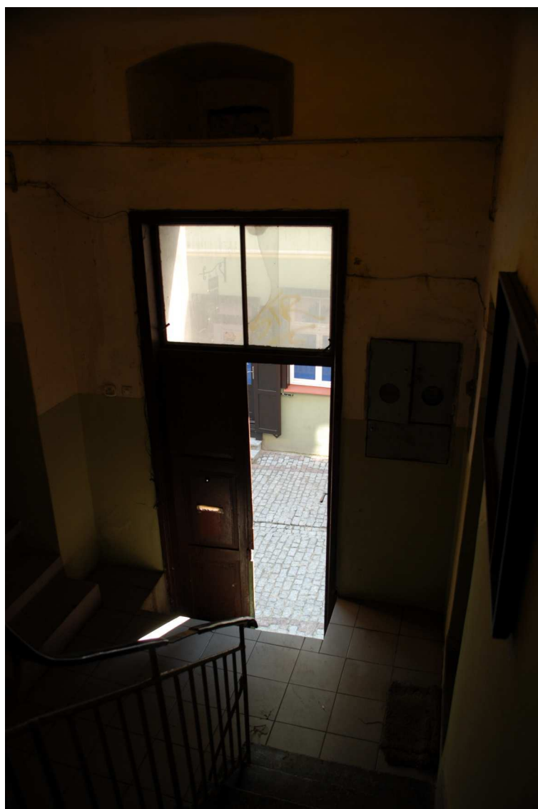
Klatka schodowa, Olejna 12, 2010.