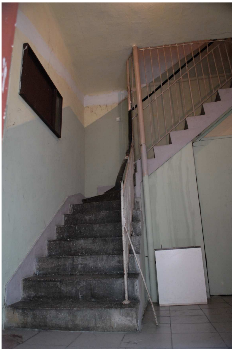
Klatka schodowa, Olejna 12, fot. Piotr Sztajdel, 2010.