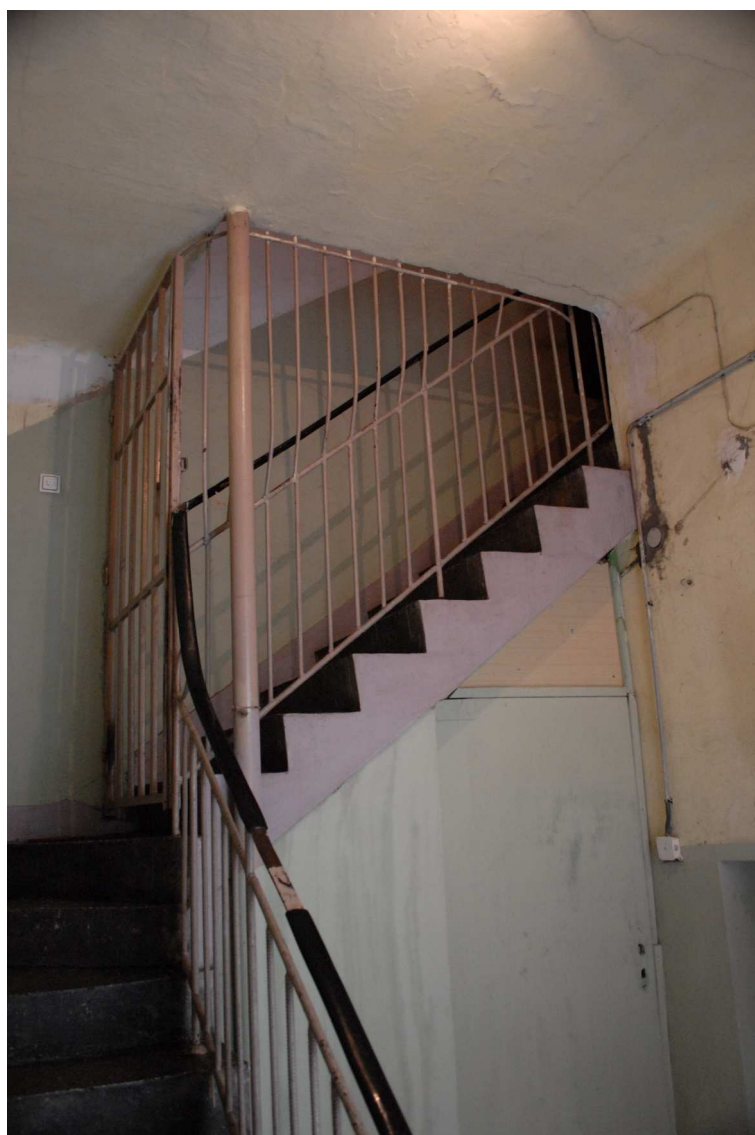
Klatka schodowa, Olejna 12, fot. Piotr Sztajdel, 2010.