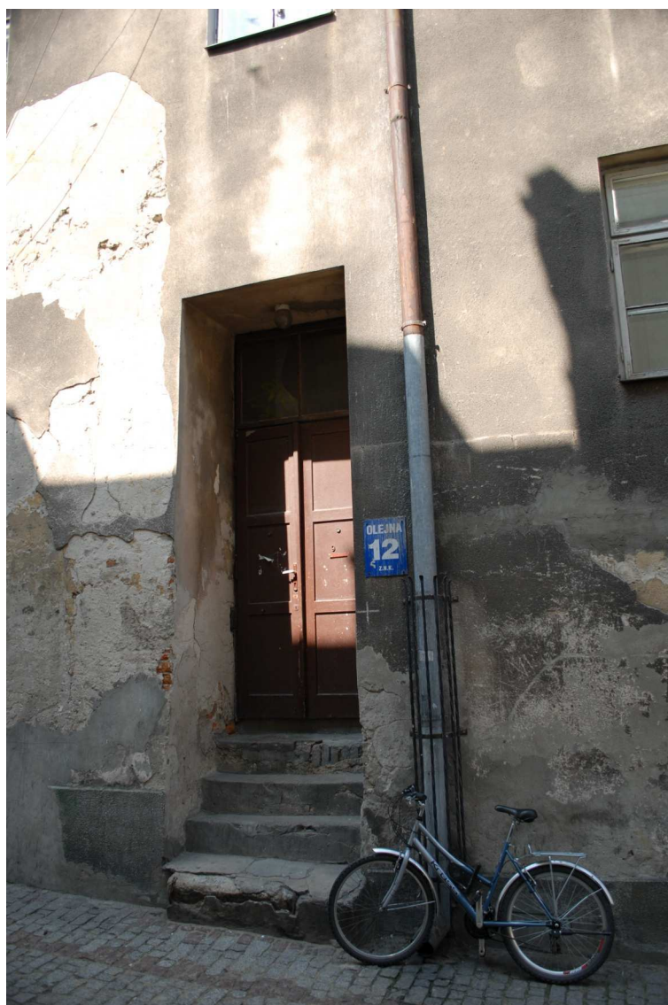
Fasada, Olejna 12, fot. Piotr Sztajdel, 2010.