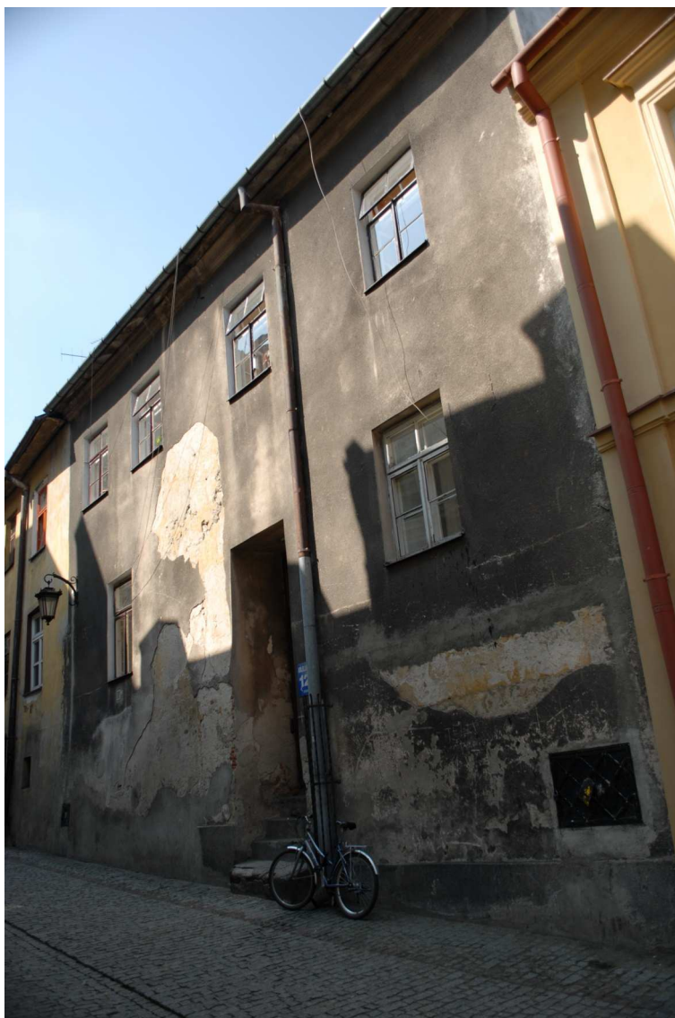
Fasada, Olejna 12, fot. Piotr Sztajdel, 2010.