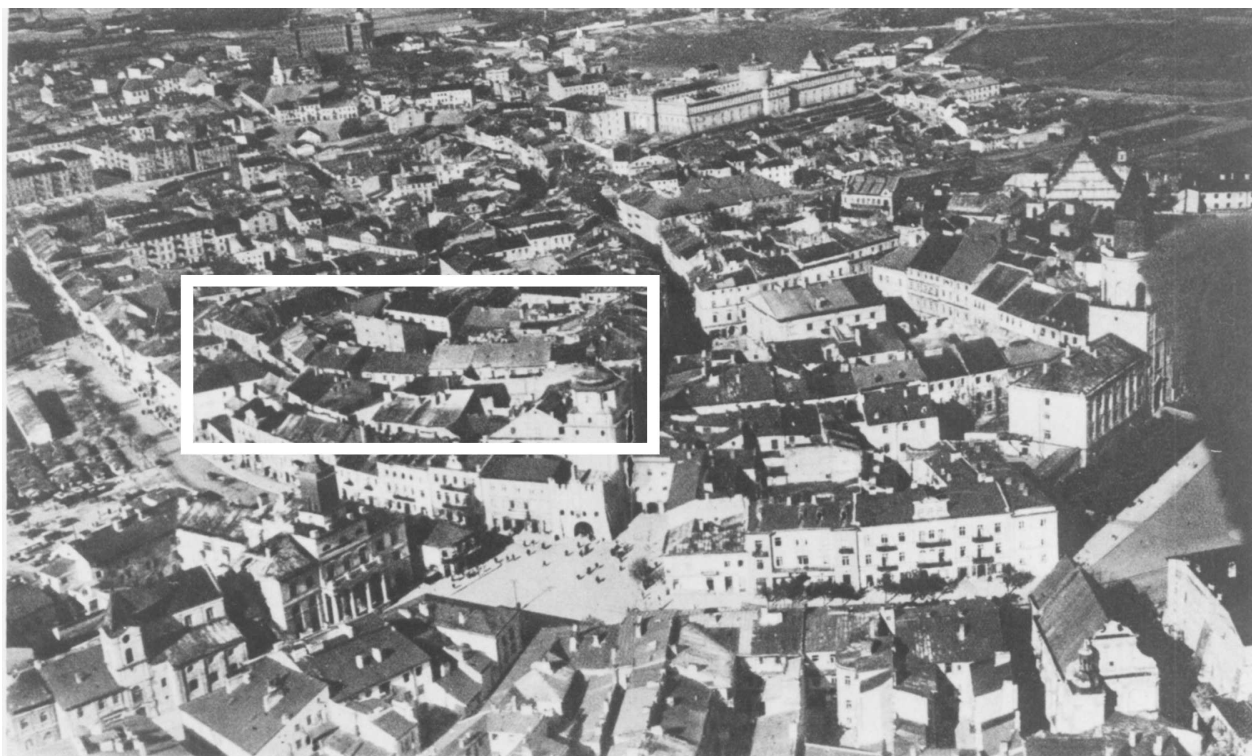
Panorama Lublina, lata 30./ Panorama of Lublin in the 1930s,