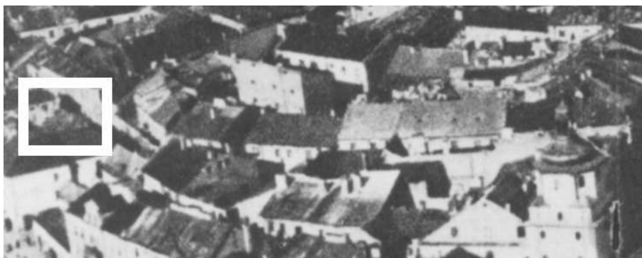
Fragment panoramy Lublina, lata 30., ul. Olejna/ A fragment of panorama of Lublin in the 1930s, Olejna street,