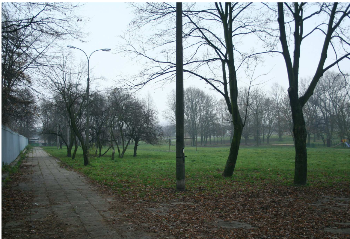
Podzamecze 7, fot. Marcin Fedorowicz, 2010.