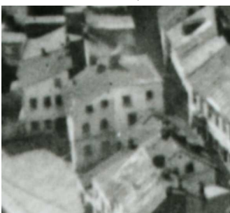
Fragment panoramy Lublina, lata 30., Podzamecze 7/Krawiecka 12/A fragment of panorama of Lublin in the 1930s, Podzamecze 7/Krawiecka 12