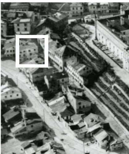
Fragment panoramy Lublina, lata 30., ul. Podzamecze/A fragment of panorama of Lublin in the 1930s, Podzamecze street,