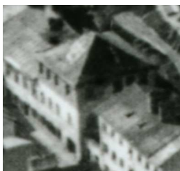
Fragment panoramy Lublina, lata 30., Podzamcze 12/ A fragment of panorama of Lublin in the 1930s, Podzamcze 12,