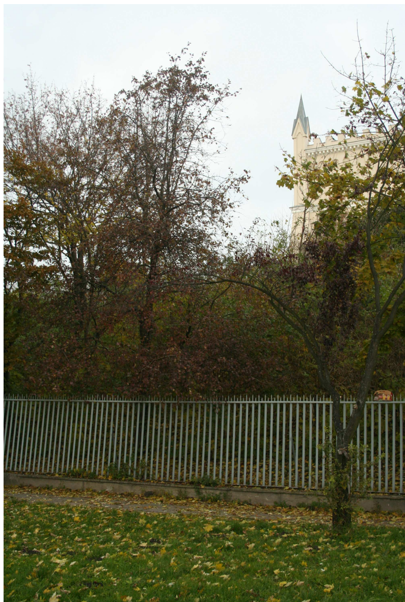
Podzamecze 12, fot. Marcin Fedorowicz, 2010.