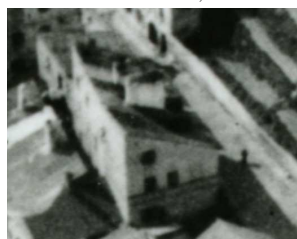
Fragment panoramy Lublina, lata 30., Podzamecze 17/ A fragment of panorama of Lublin in the 1930s, Podzamecze 17,