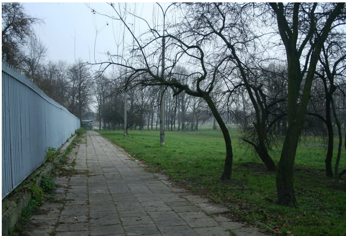
Podzamcze 17, fot. Marcin Fedorowicz, 2010.