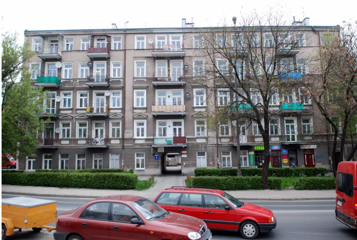
Elewacja oficyny, Biernackiego 1, fot. Marcin Moszyński, 2010.