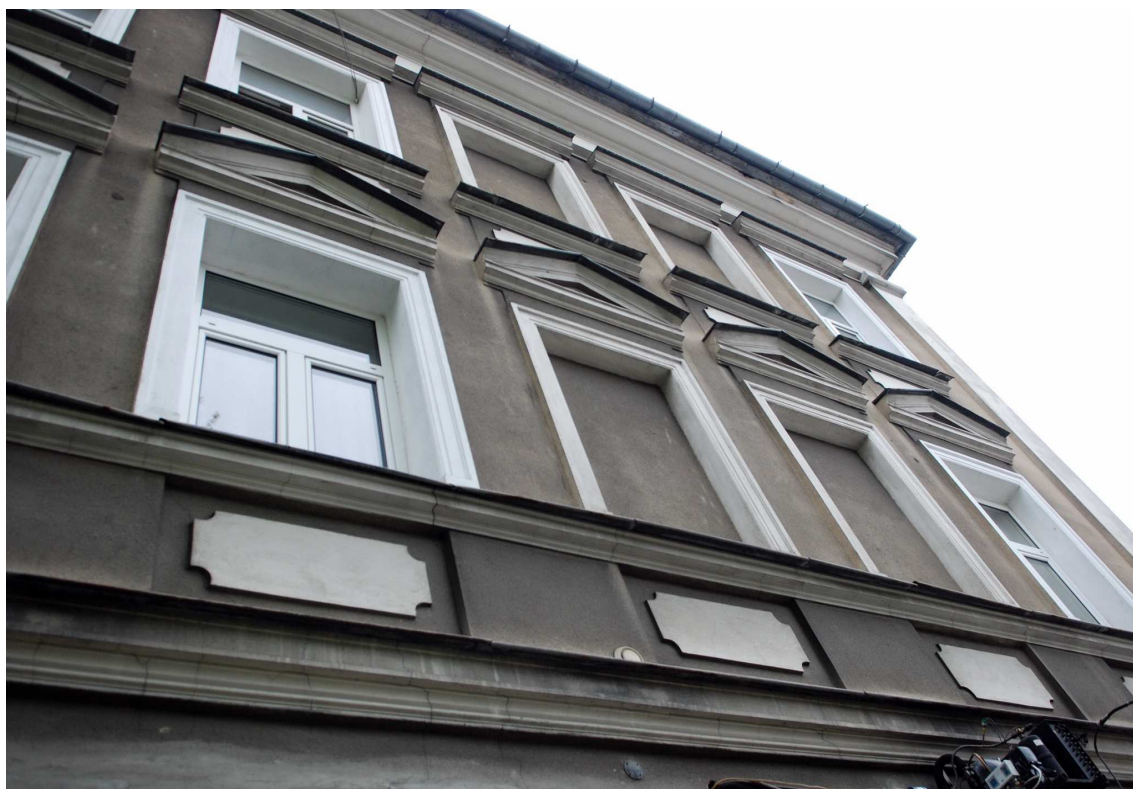
Fragment elewacji, Biernackiego 1, 2010.