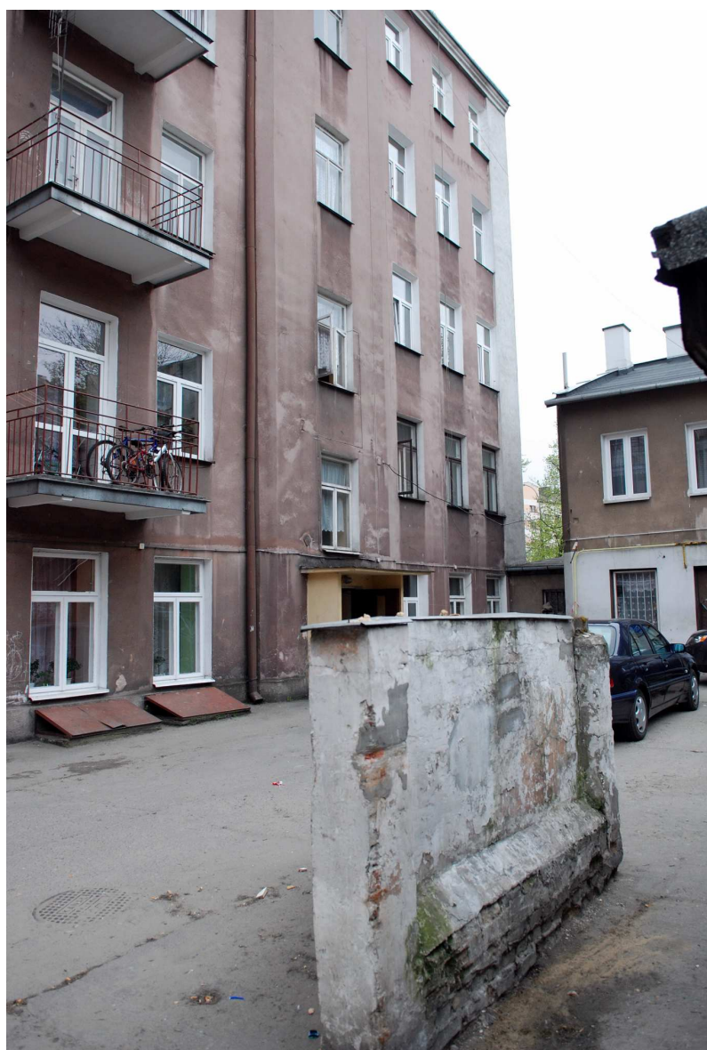
Oficyna, widok od podwórka, Biernackiego 1, fot. Marcin Moszyński, 2010.