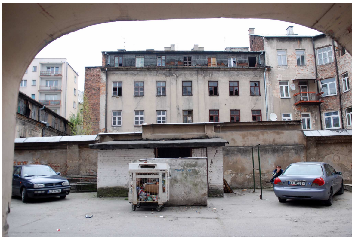
Podwórk, Biernackiego 1, fot. Marcin Moszyński, 2010.