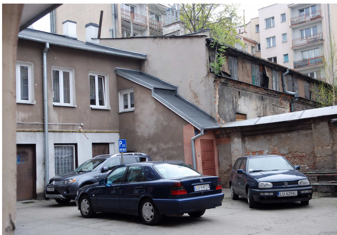
Podwórko, Biernackiego 1, fot. Marcin Moszyński, 2010.