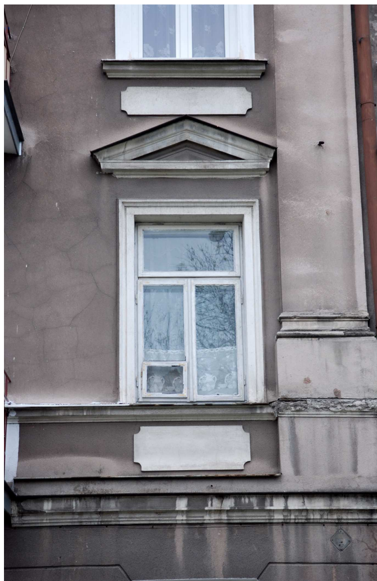
Fragment fasady z oknem, Biernackiego 1, fot. Marcin Moszyński, 2010.