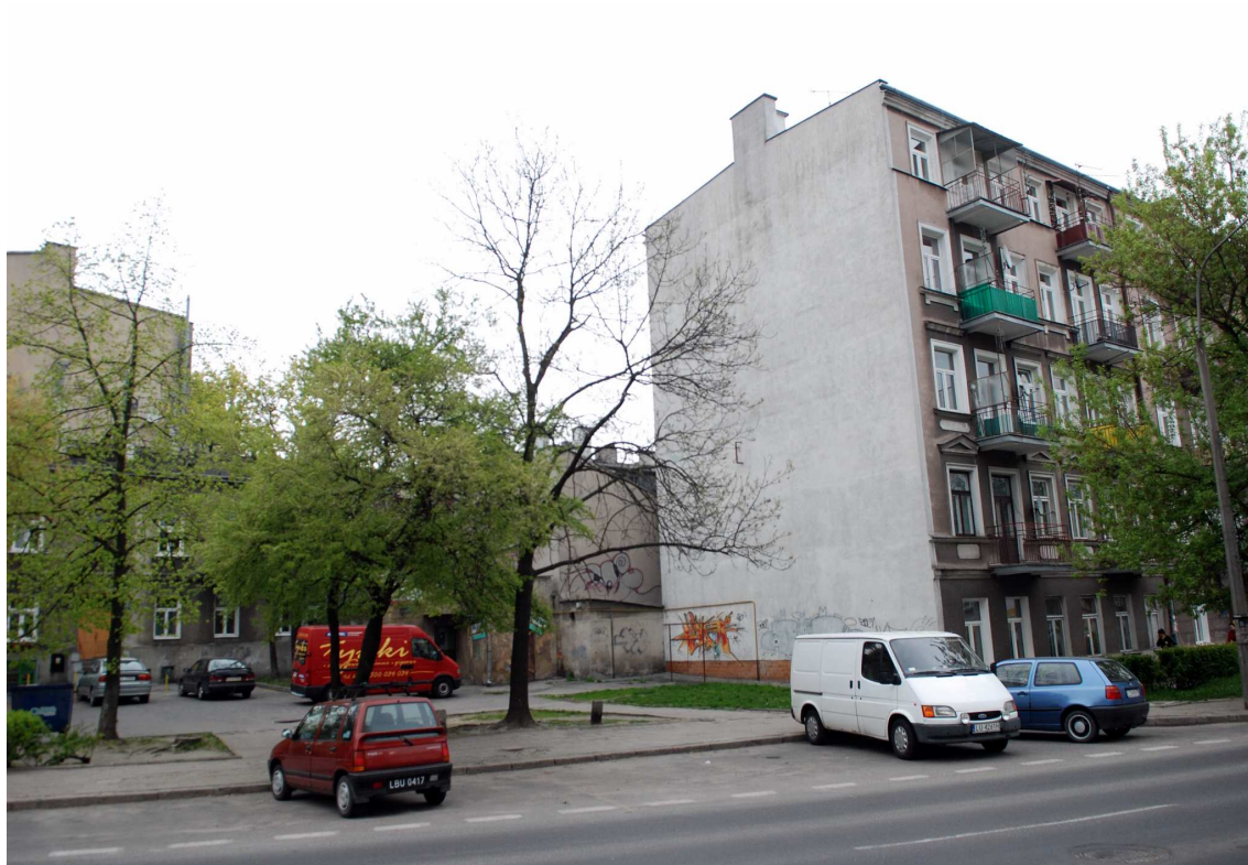
Elewacje oficyny, Biernackiego 1, 2010.