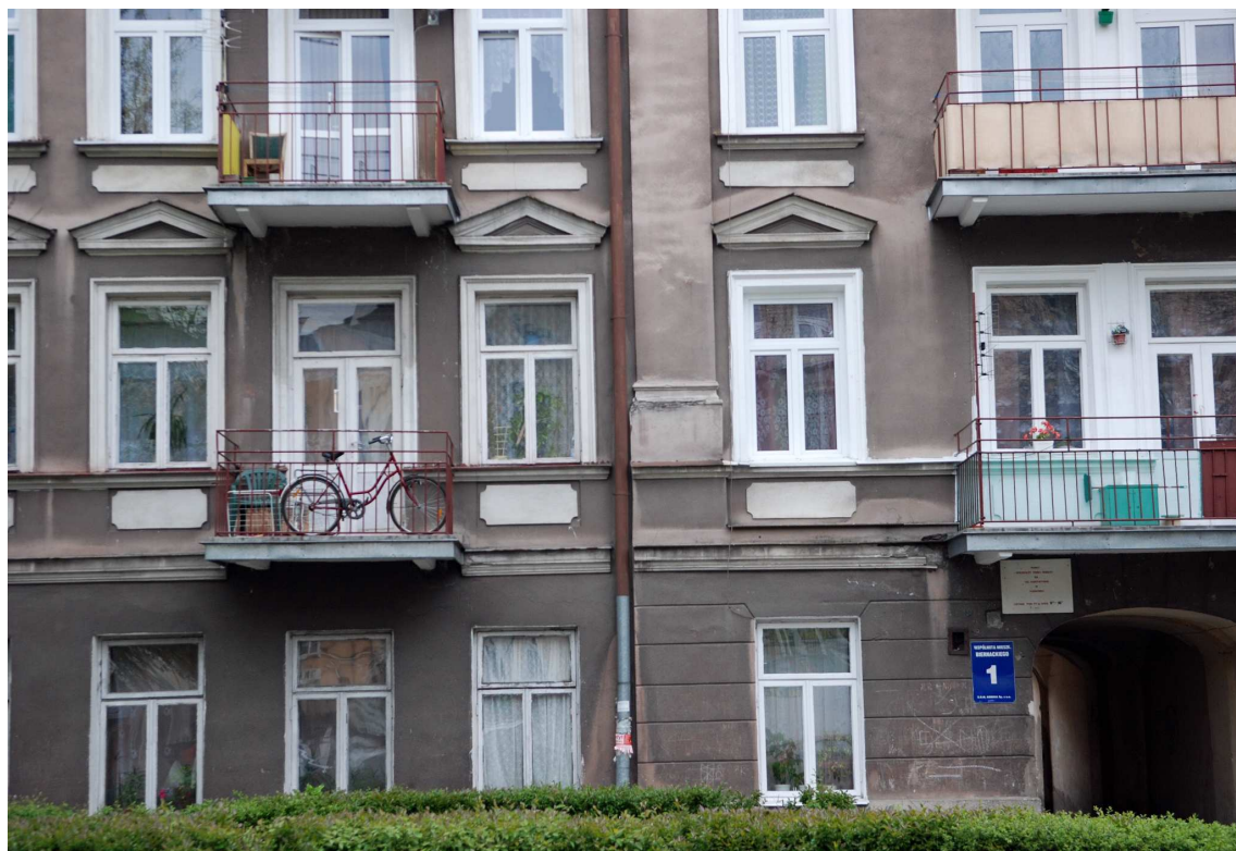
Elewacja oficyny, Biernackiego 1, fot. Marcin Moszyński, 2010.