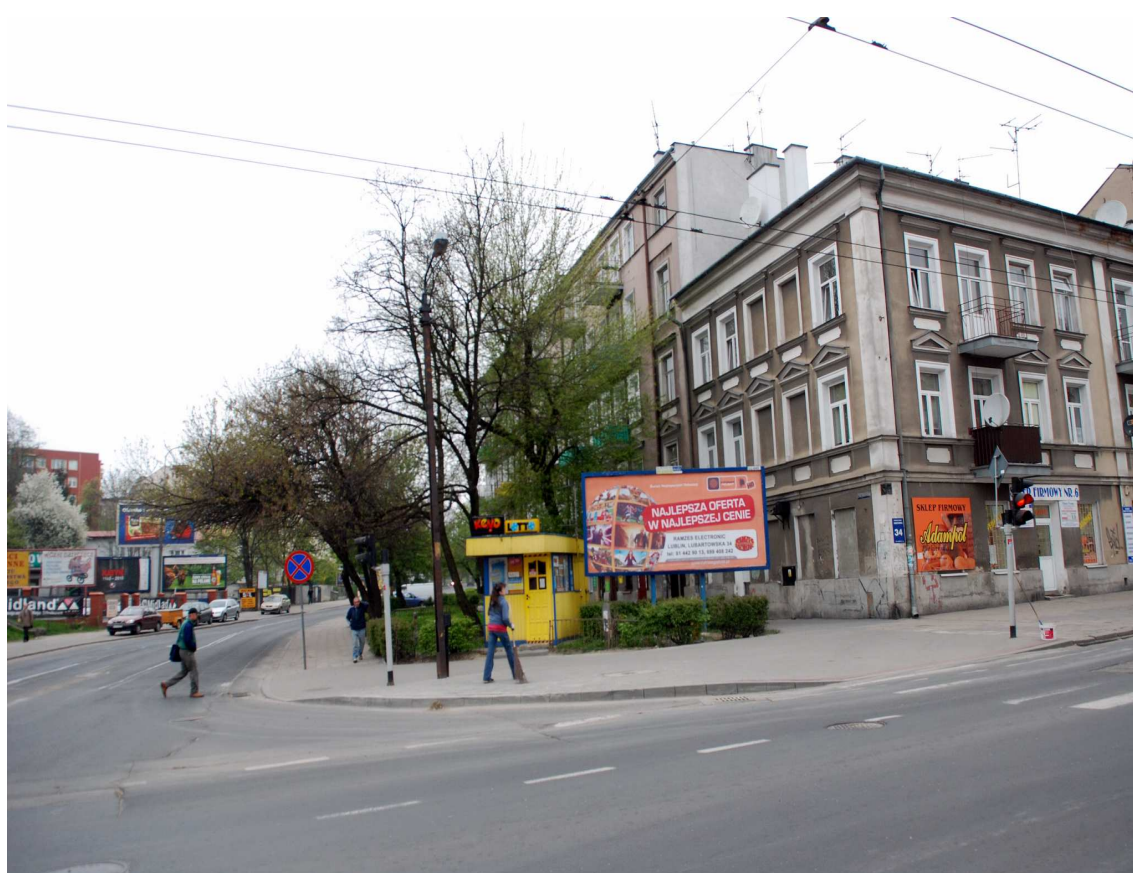
Elewacja frontowa kamienicy i oficyna, Biernackiego 1, fot. Marcin Moszyński, 2010.