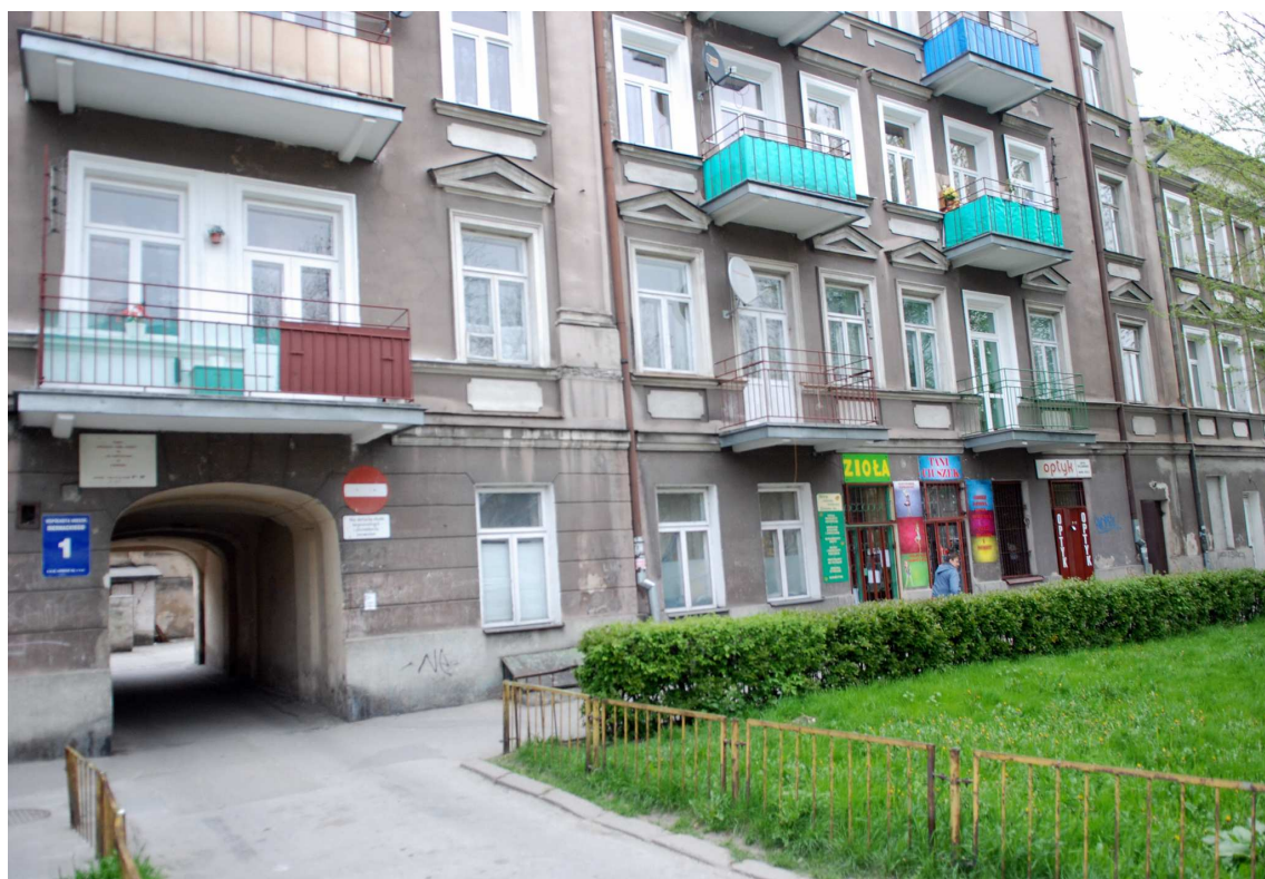
Elewacja oficyny, Biernackiego 1, 2010.