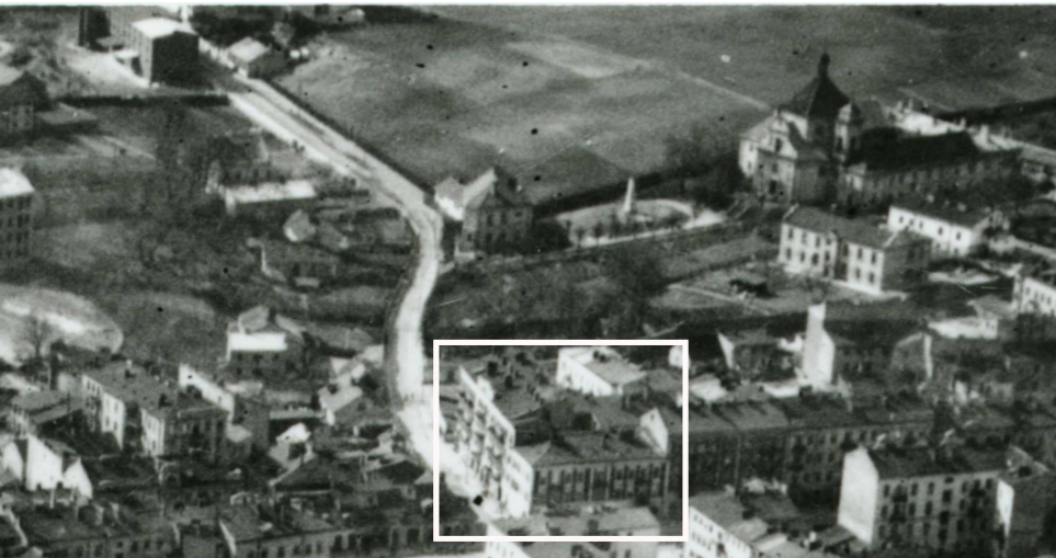
Fragment panoramy Lublina, lata 30., ul. Bonifraterska/A fragment of panorama of Lublin in the 1930s, Bonifraterska street,