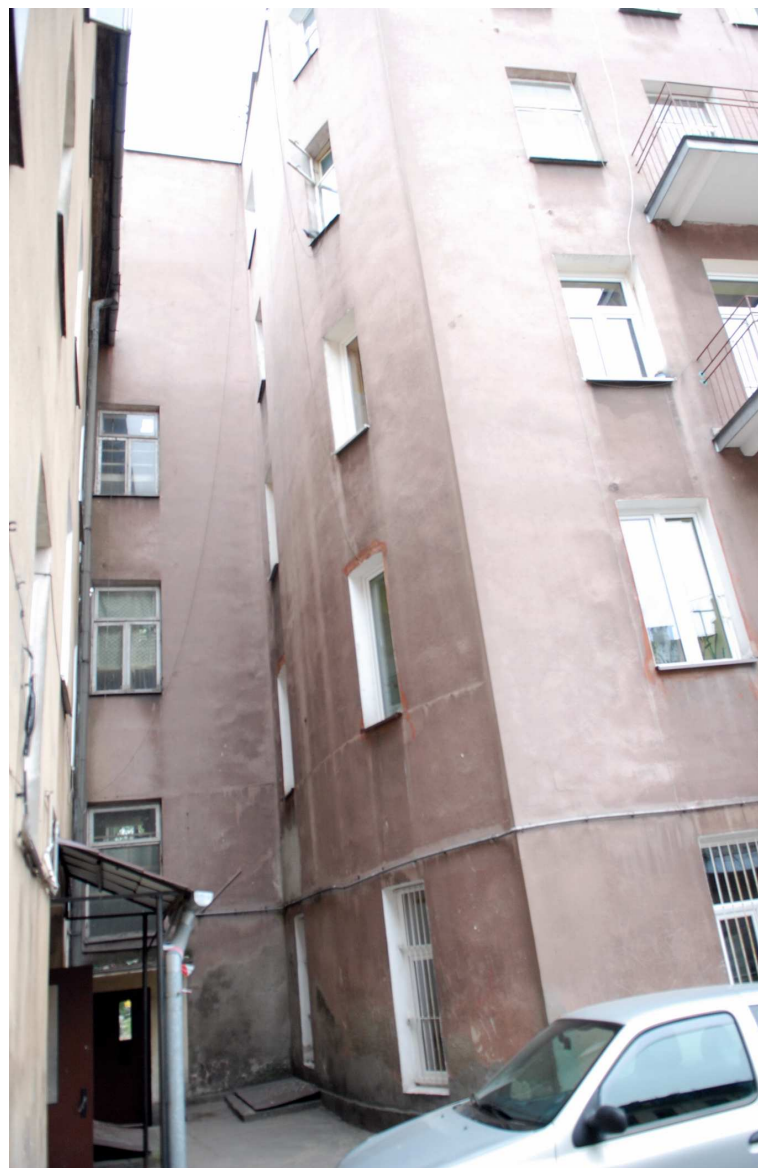
Podwórko, Biernackiego 1, fot. Marcin Moszyński, 2010.