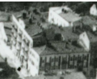
Fragment panoramy Lublina, lata 30., Bonifraterska 1/A fragment of panorama of Lublin in the 1930s, Bonifraterska 1,