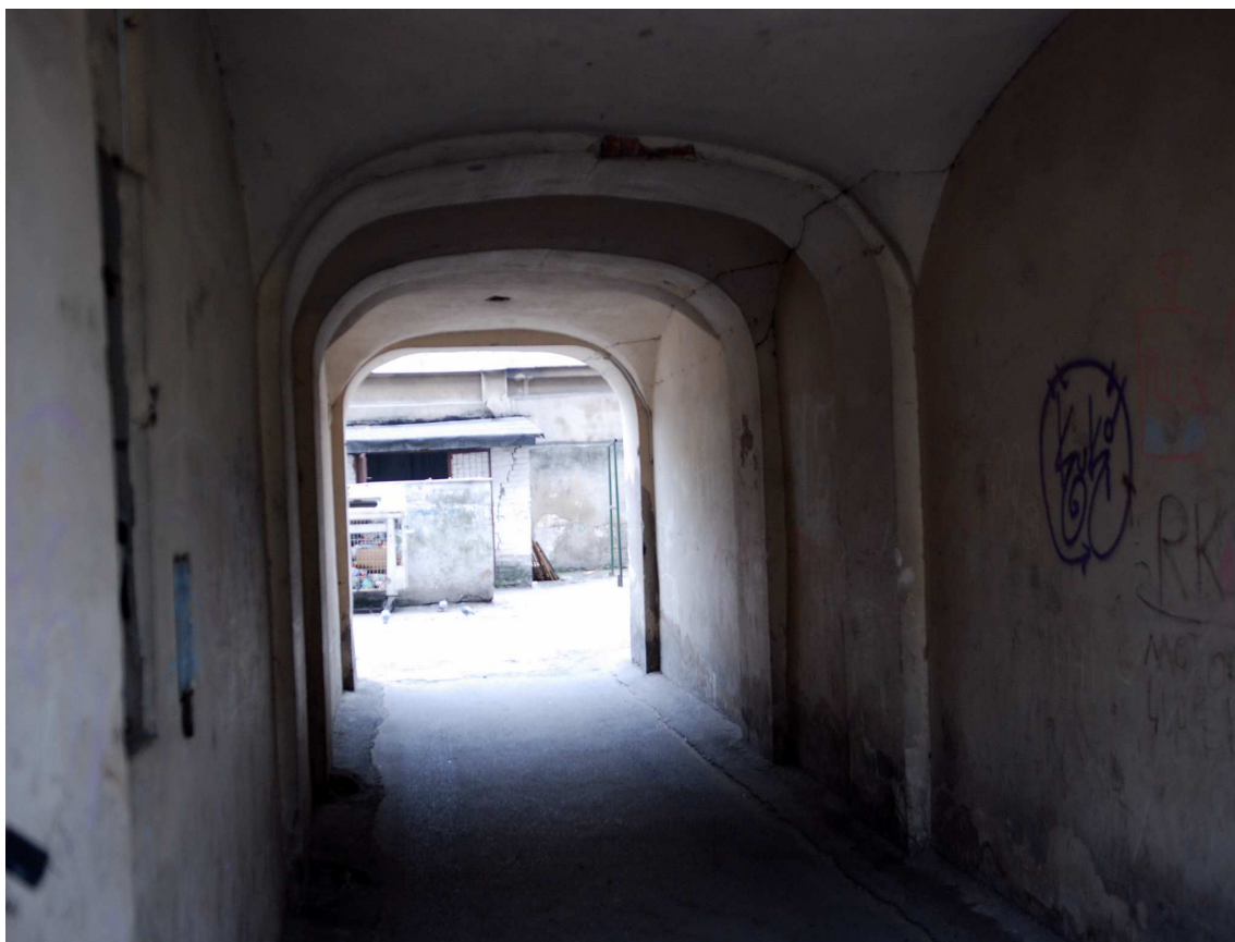
Brama, Biernackiego 1, 2010.