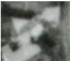
Fragment panoramy Lublina, lata 30., Bonifraterska 12/A fragment of panorama of Lublin in the 1930s, Bonifraterska 12,