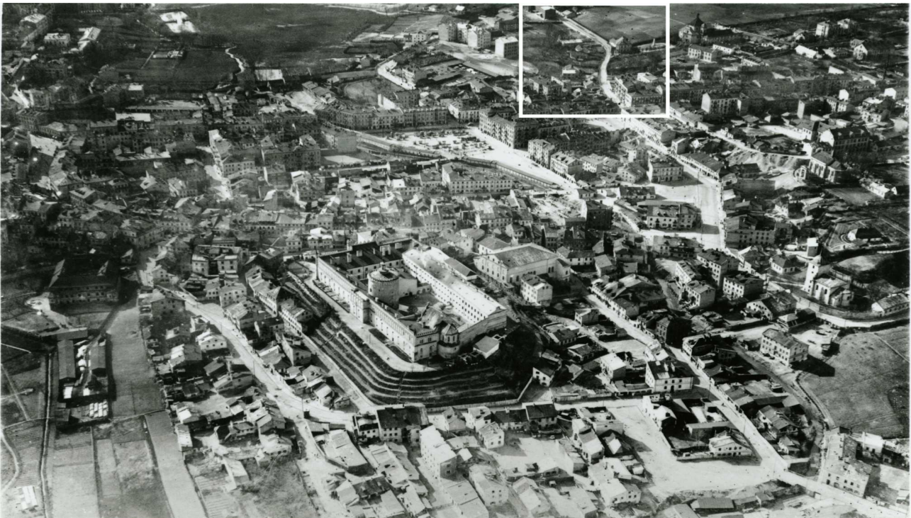
Panorama Lublina, lata 30./Panorama of Lublin in the 1930s,