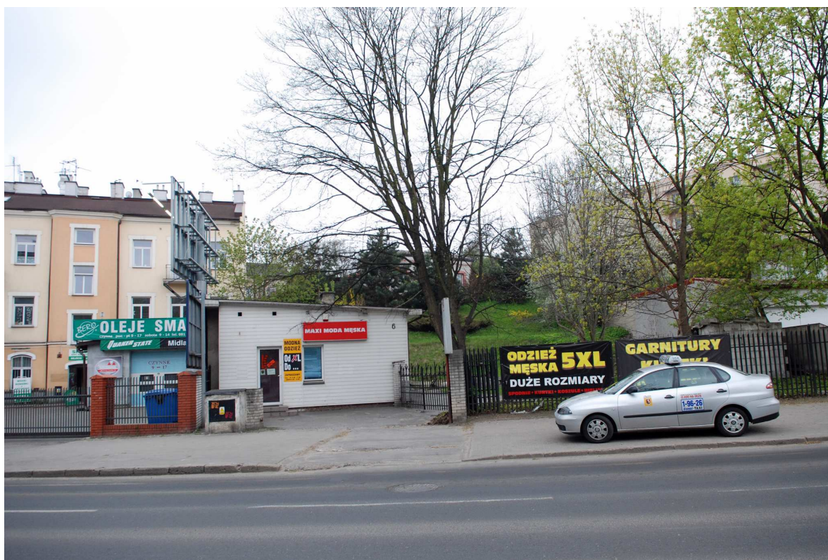
Elewacja główna, Biernackiego 12, fot. Marcin Moszyński, 2010.