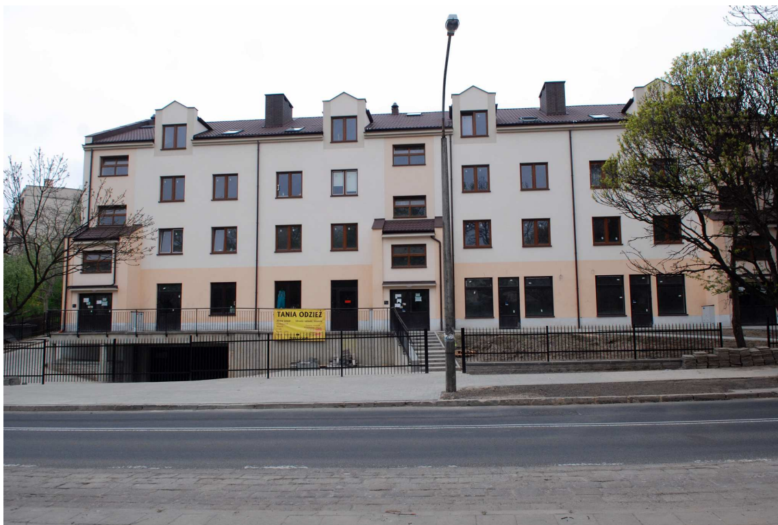
Elewacja główna, Biernackiego 12 dawna parcela Bonifraterska 16, fot. Marcin Moszyński, 2010.