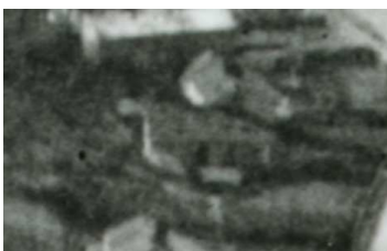
Fragment panoramy lublina, lata 30., Bonifraterska 16/A fragment of panorama of Lublin in the 1930s, Bonifraterska 16,