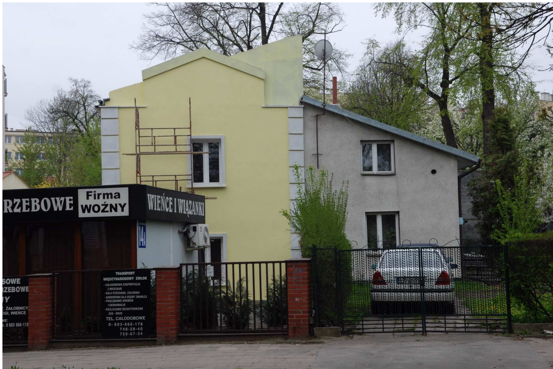
Budynek po prawej stronie - Biernackiego 16 dawna Bonifraterska 18a