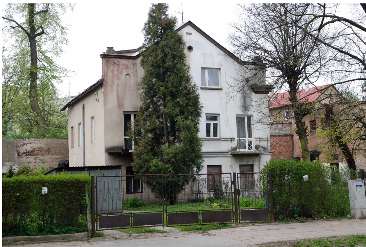
Elewacja frontowa nieruchomości Biernackiego 18 dawna Bonifraterska 20, fot. Marcin Moszyński, 2010.