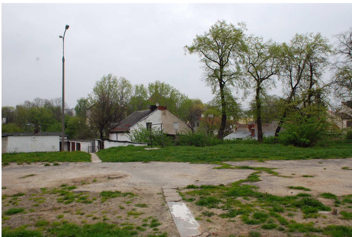
Biernackiego 18 dawna Bonifraterska 20, widok na elewację tylną, 2010.