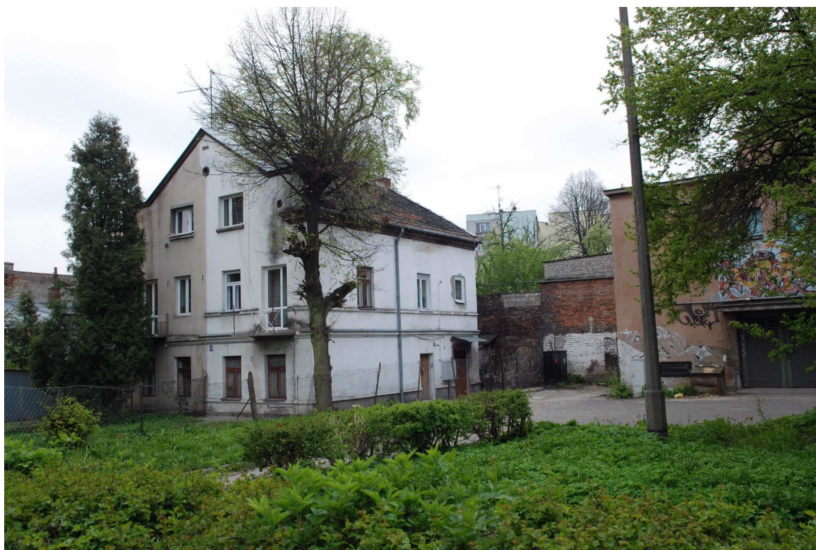
Widok od podwórka na nieruchomość Biernackiego 18 dawna Bonifraterska 20, fot. Marcin Moszyński, 2010.