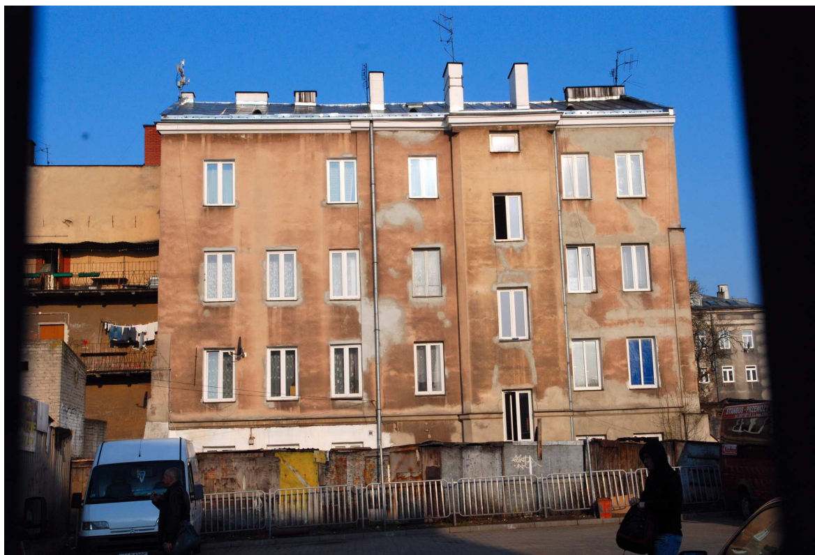
Elewacja tylna, Targowa 3, fot. Marcin Moszyński, 2010.