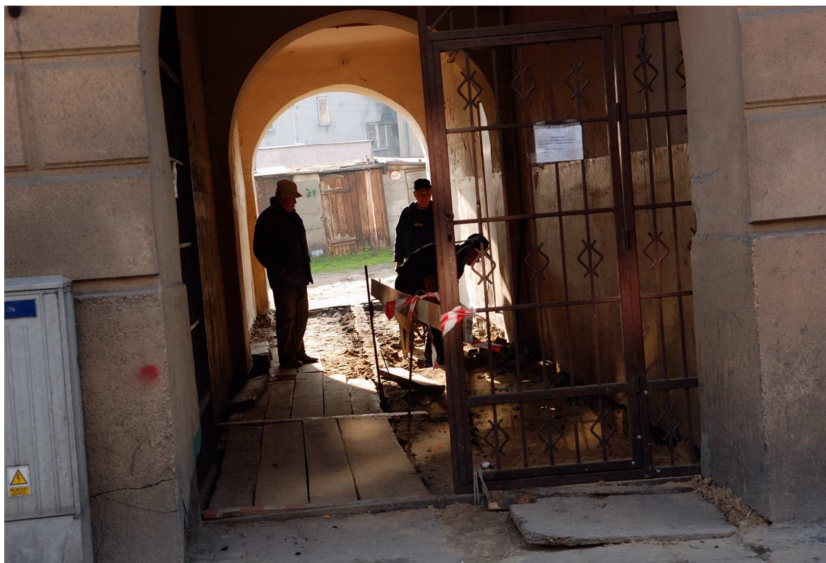
Brama, Targowa 3, fot. Marcin Moszyński, 2010.