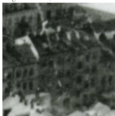
Fragment panoramy Lublina, lata 30., Targowa 3/A fragment of panorama of Lublin in the 1930s, Targowa 3,