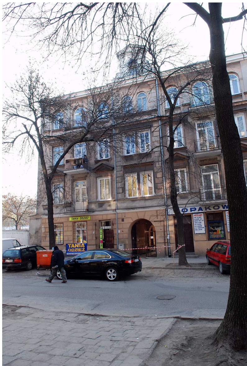
Fasada, Targowa 3, 2010.