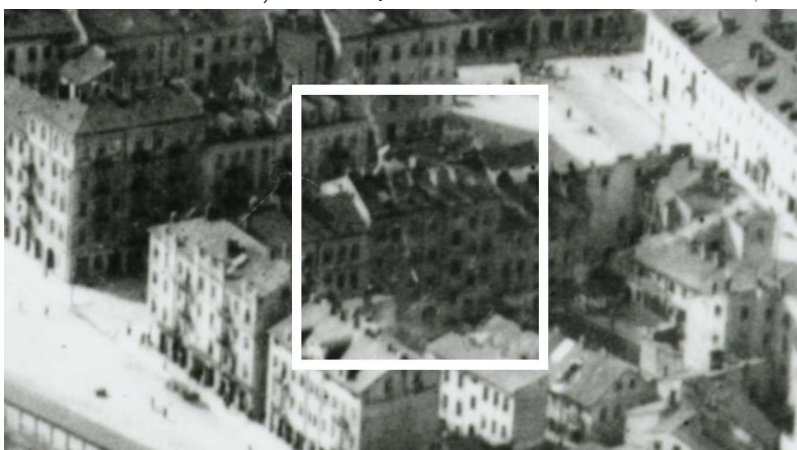
Fragment panoramy Lublina, lata 30., ul. Targowa/A fragment of panorama of Lublin in the 1930s,