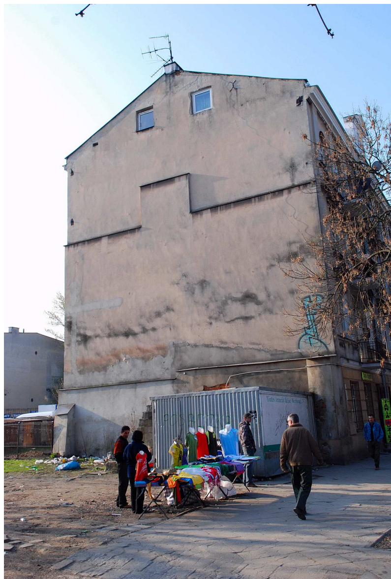
Elewacja boczna, Targowa 3, fot. Marcin Moszyński, 2010.