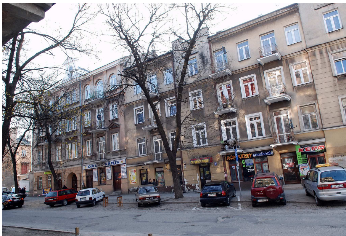
Fasada, Targowa 3, 2010.