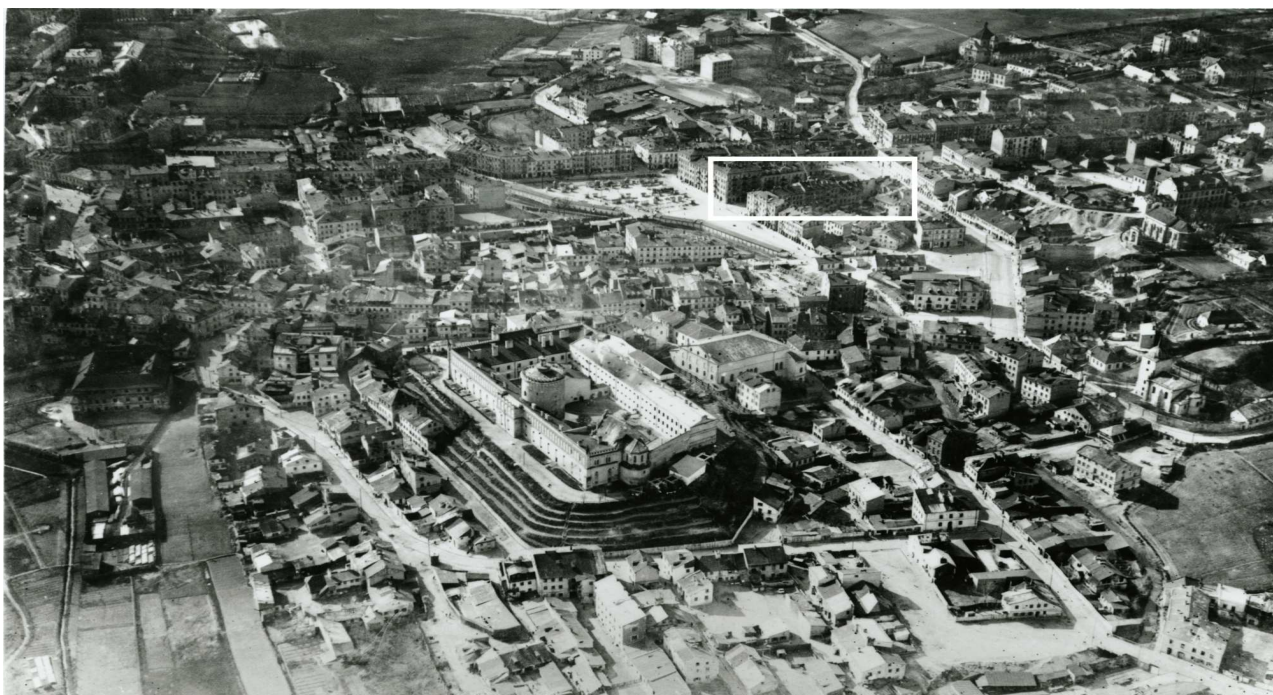
Panorama Lublina, lata 30./Panorama of Lublin in the 1930s,