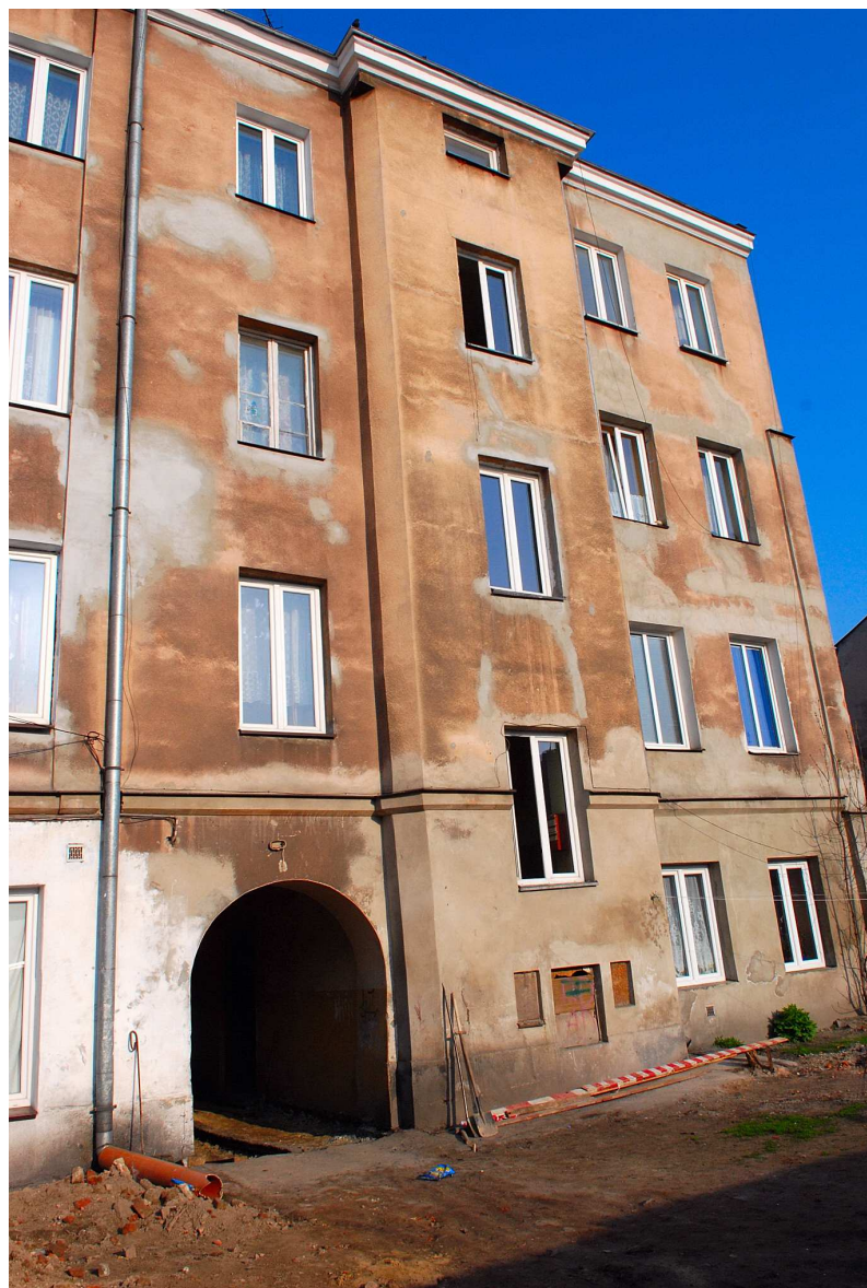
Elewacja tylna, Targowa 3, fot. Marcin Moszyński, 2010.