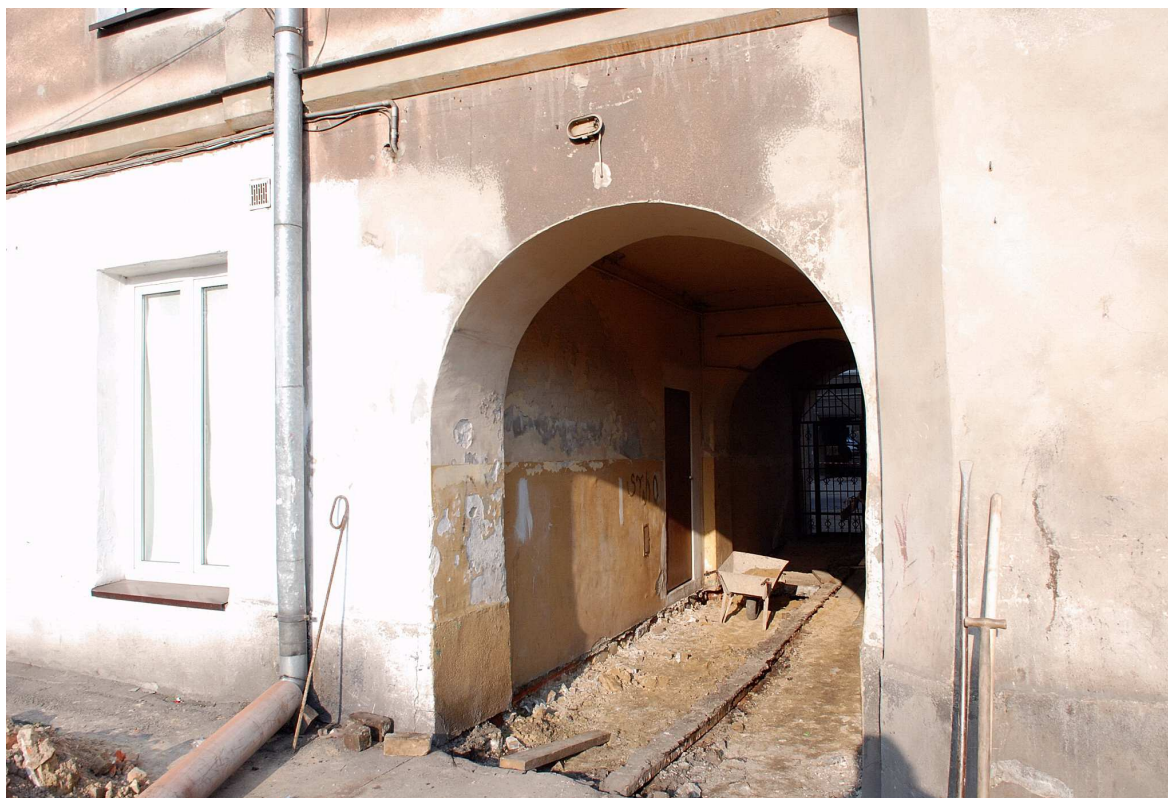
Brama, Targowa 3, fot. Marcin Moszyński, 2010.