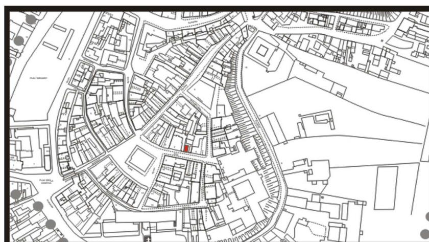
LOKALIZACJA NIERUCHOMOŚCI - Złota 4 LOCATION OF THE PROPERTY - Złota 4