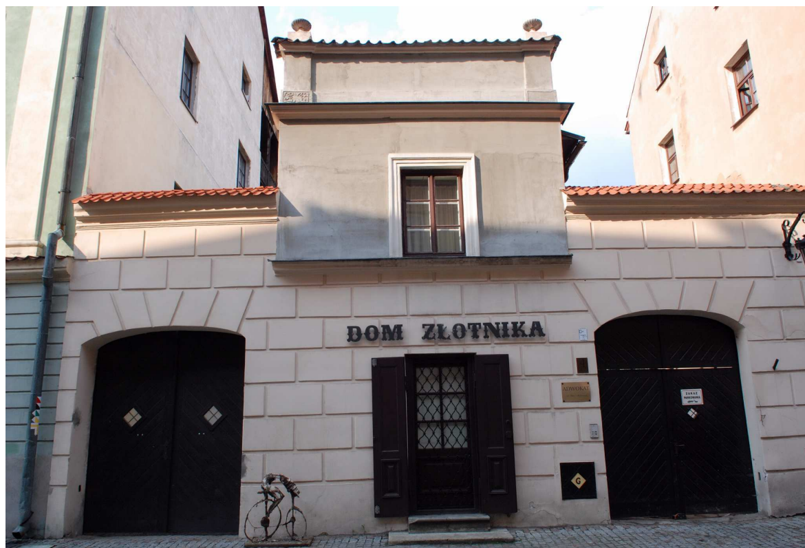
Fasada, Złota 4, fot. Marcin Moszyński, 2010.