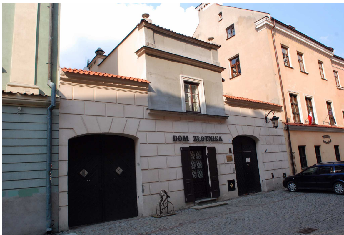
Fasada, Złota 4, fot. Marcin Moszyński, 2010.