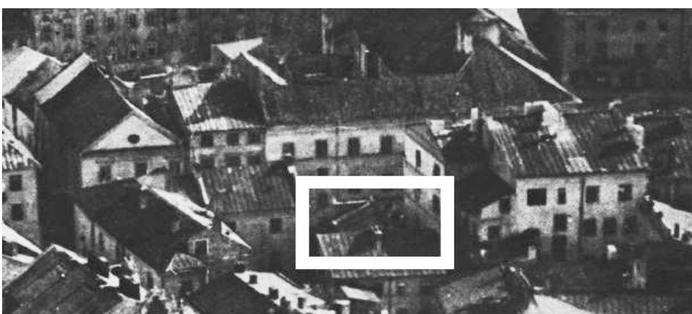
Fragment panoramy Lublina, lata 30., ul. Złota/A fragment of panorama of Lublin in the 1930s, Złota street,