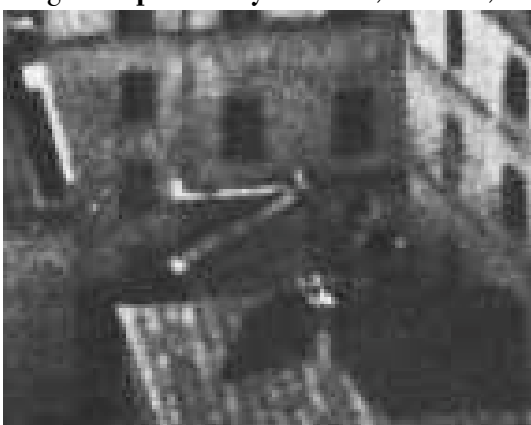
Fragment panoramy Lublina, lata 30., Złota 4/A fragment of panorama of Lublin in the 1930s, Złota 4,