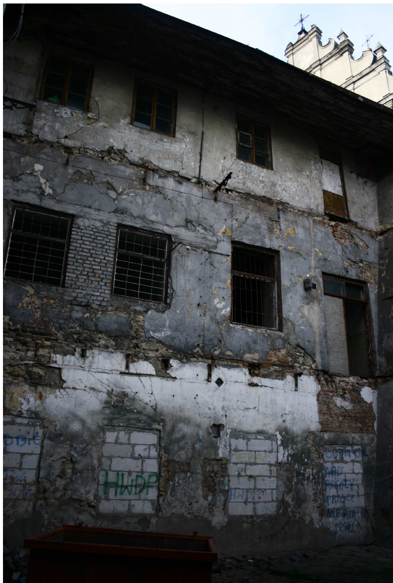
Podwórko, Złota 7/Dominikańska 7, fot. Marta Sarzyńska, 2010.