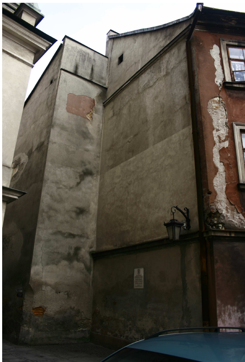
Elewacja boczna, Złota7/Dominikańska 7, 2010.