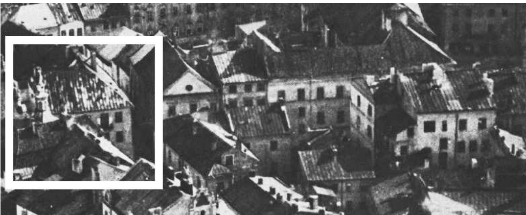
Fragment panoramy Lublina, lata 30., ul. Złota/A fragment of panorama of Lublin in the 1930s, Złota street,