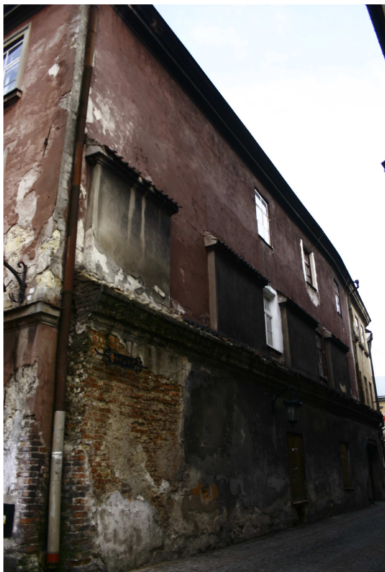
Elewacja boczna, Złota 7/Dominikańska 7, fot. Marta Sarzyńska, 2010.