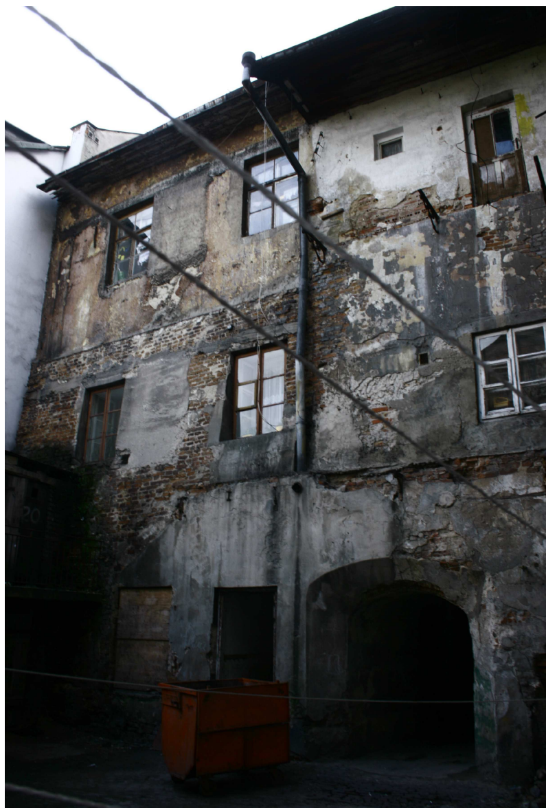
Podwórko, Złota 7/Dominikańska 7, fot. Marta Sarzyńska, 2010.