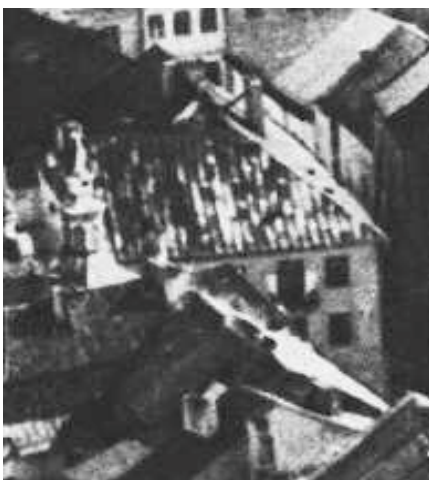
Fragment panoramy Lublina, lata 30., Złota 7/A fragment of panorama of Lublin in the 1930s, Złota 7,