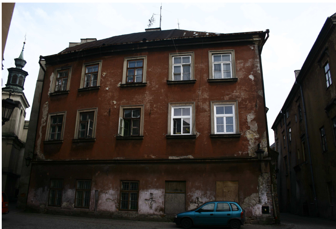
Fasada, Złota7/Dominikańska 7, fot. Marta Sarzyńska, 2010.