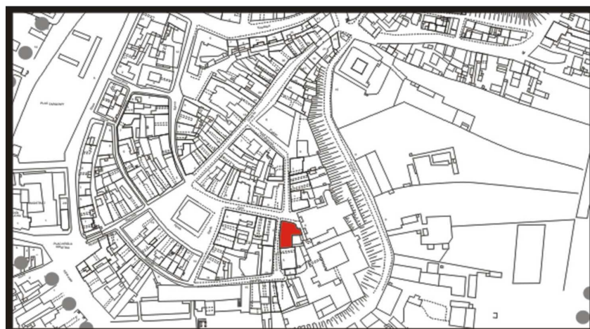
LOKALIZACJA NIERUCHOMOŚCI - Złota 7 LOCATION OF THE PROPERTY - Złota 7