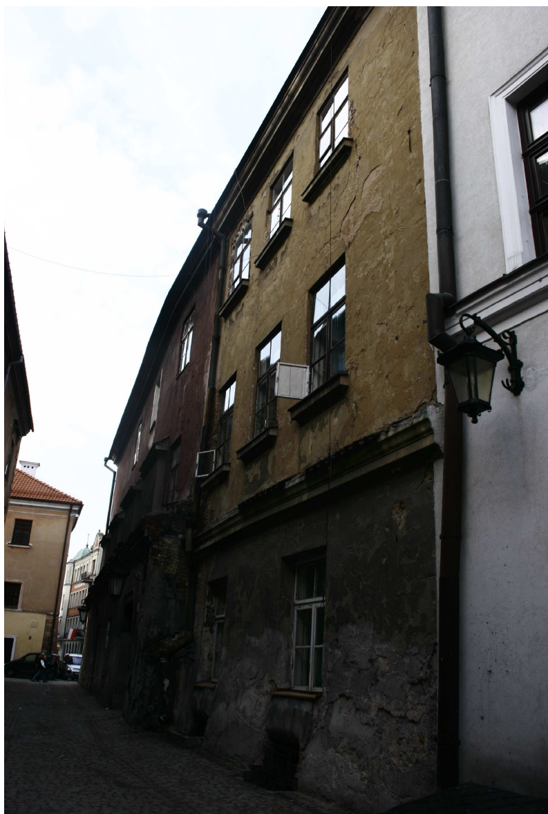
Elewacja boczna, Złota 7/Dominikańska 7, fot. Marta Sarzyńska, 2010.