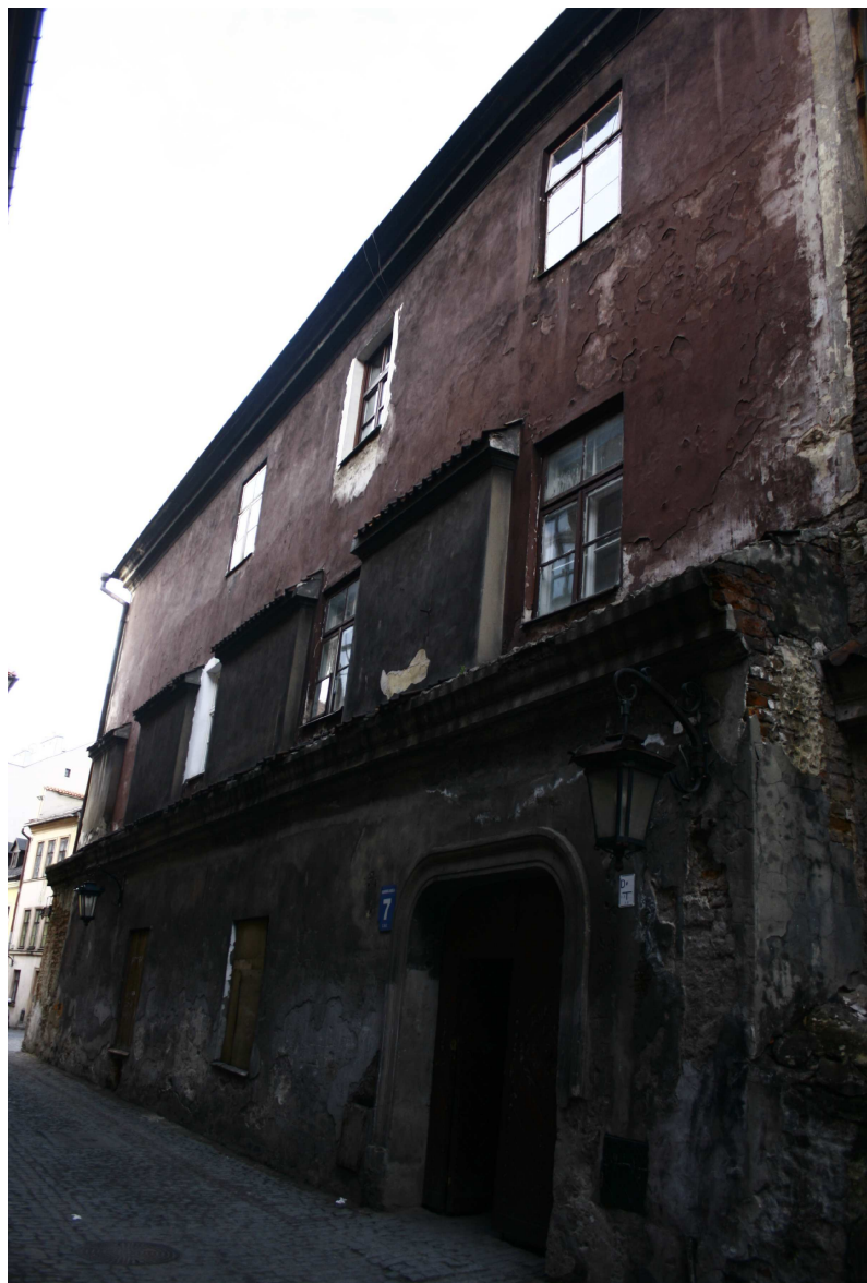
Elewacja główna, Złota7/Dominikańska 7, fot. Marta Sarzyńska, 2010.