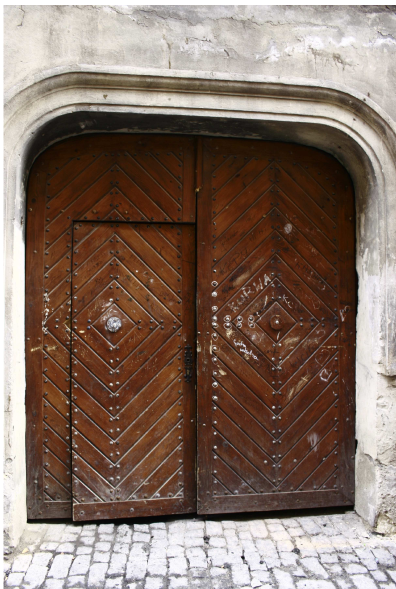
Brama, Złota7/Dominikańska 7, fot. Marta Sarzyńska, 2010.