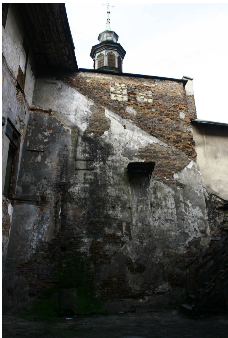
Podwórko, Złota 7/Dominikańska 7, fot. Marta Sarzyńska, 2010.