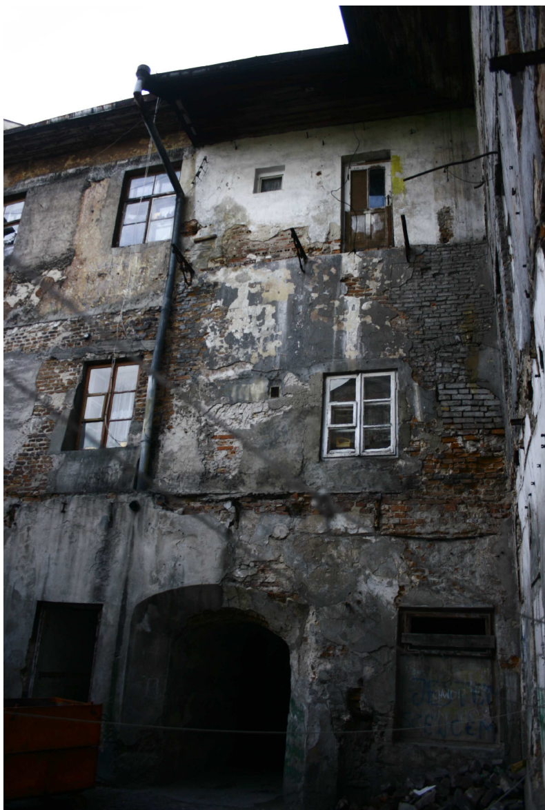
Podwórko, Złota 7/Dominikańska 7, fot. Marta Sarzyńska, 2010.