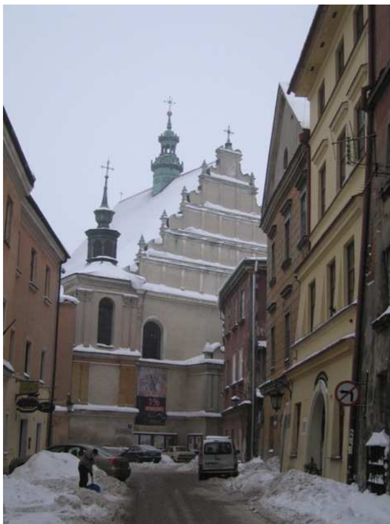
Klasztor Dominikanów, Złota 9, fot Alicja Magiera, 2010.