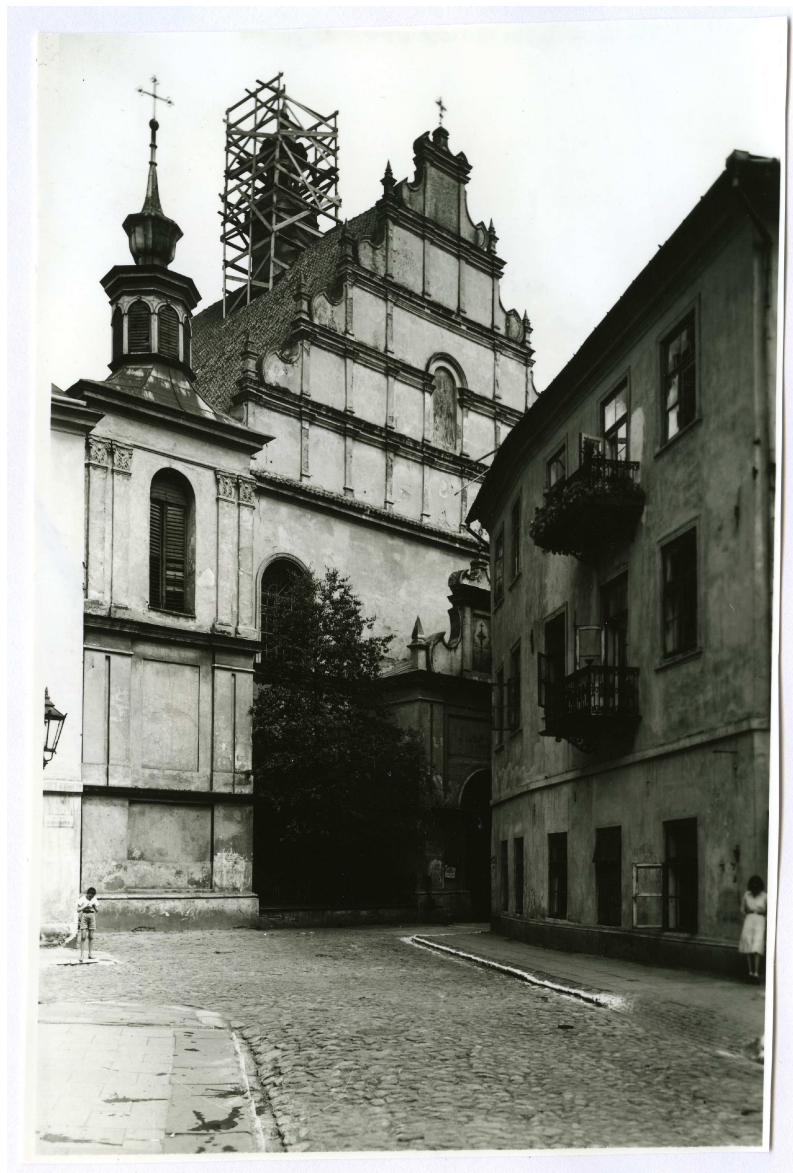
Złota 9, bazylika Dominikanów, autor nieznany, przed 1939, Samorządowa Fototeka Konserwatorska, Miejski Konserwator Zabytków w Lublinie, własność Wacław Kondziola.