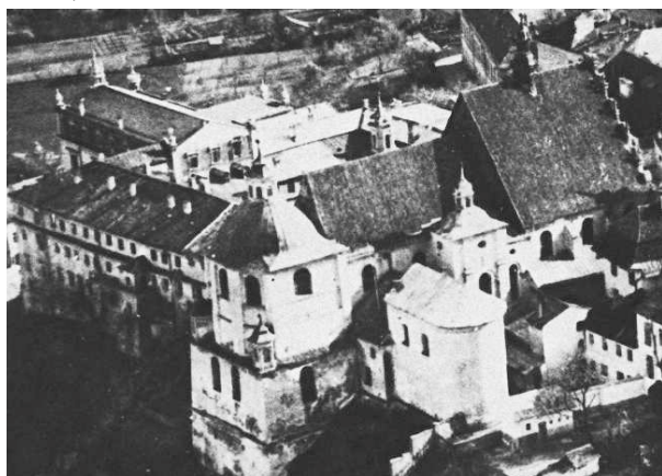
Fragment panoramy Lublina, lata 30., Złota 9/A fragment of panorama of Lublin in the 1930s, Złota 9,