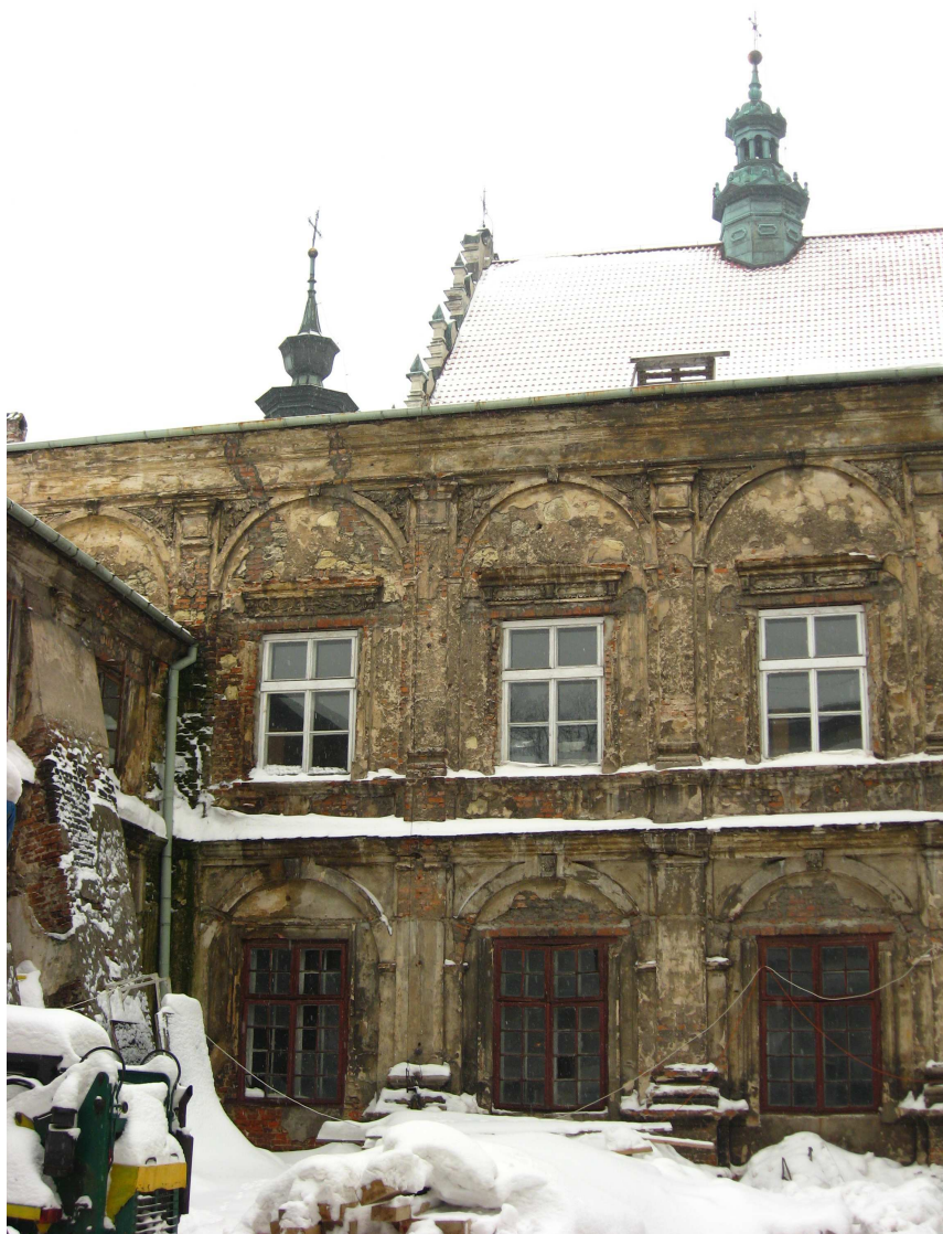
Dziedziniec Klasztoru Dominikanów, Złota 9, 2010.