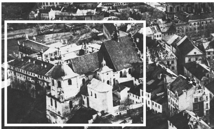
Fragment panoramy Lublina, lata 30., ul. Złota/A fragment of panorama of Lublin in the 1930s, Złota street,