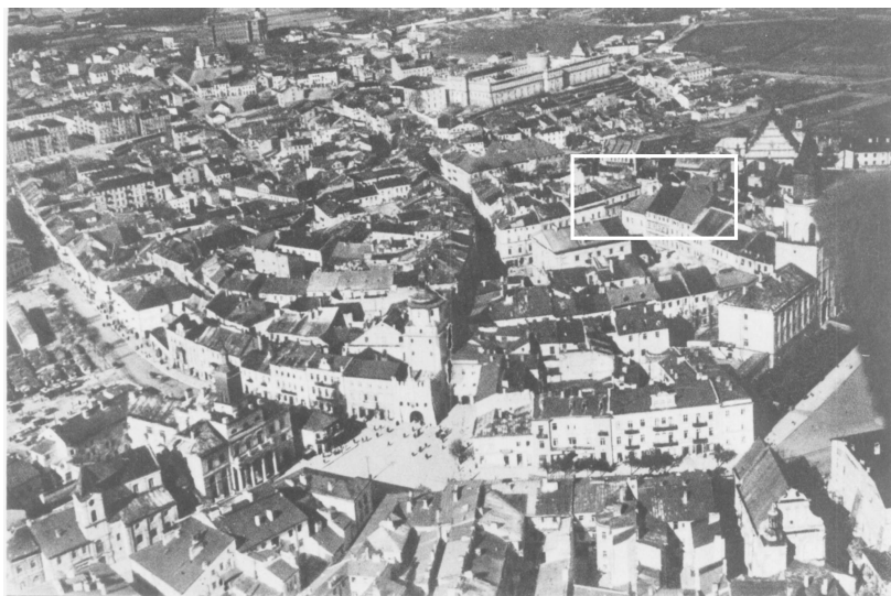
Panorama Lublina, lata 30./Panorama of Lublin in the 1930s,