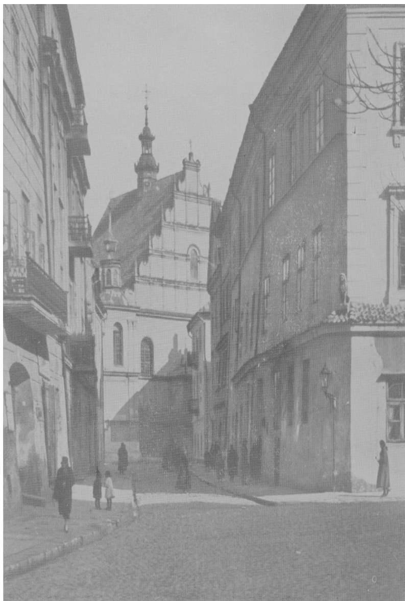
Złota 9, bazylika Dominikanów, autor inż. Marczewski, przed 1939, własność Archiwum TNN.