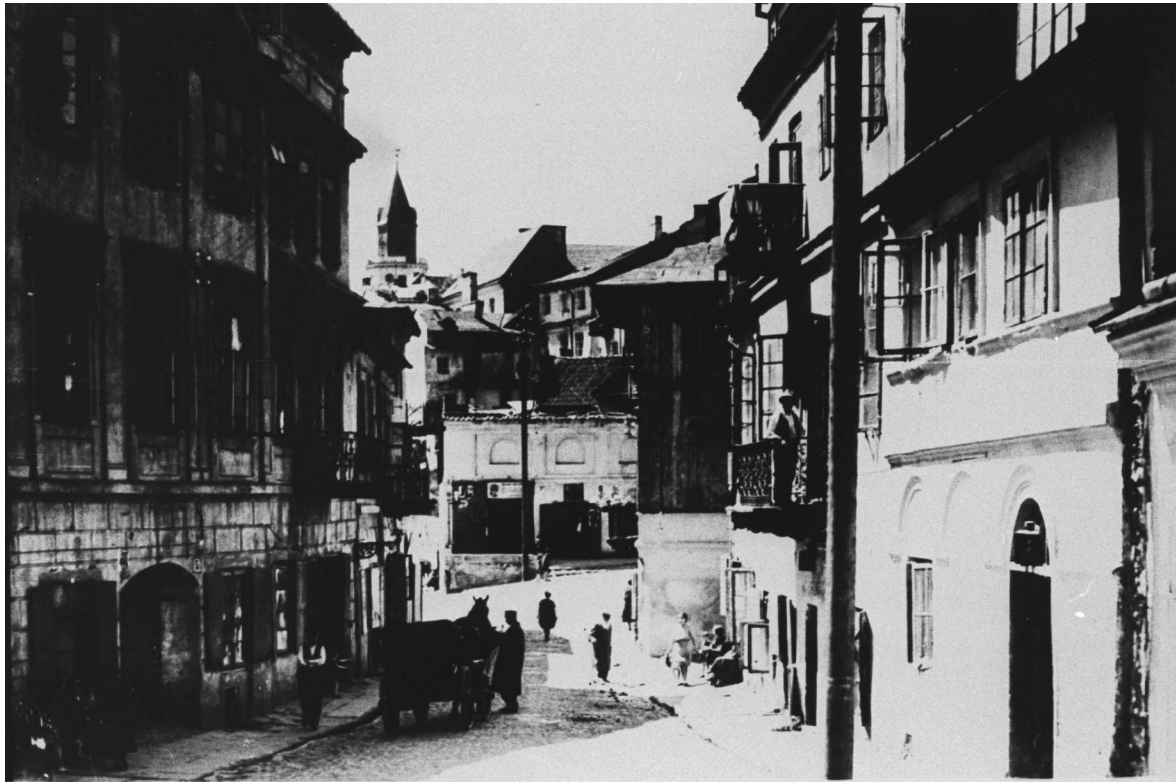
Zamkowa 3, kamienica druga od lewej, autor nieznany, przed 1939, własność Archiwum WUOZ w Lublinie.