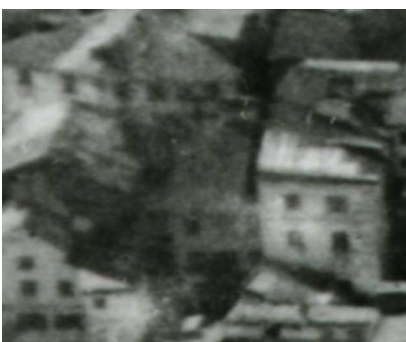
Fragment panoramy Lublina, lata 30., Zamkowa 3/A fragment of panorama of Lublin in the 1930s, Zamkowa 3,