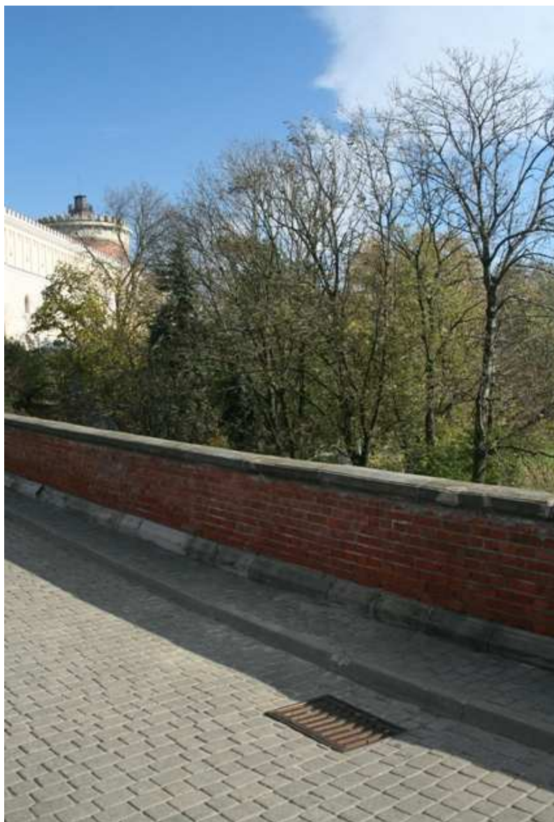
Zamkowa 3, fot. Marcin Fedorowicz, 2010.