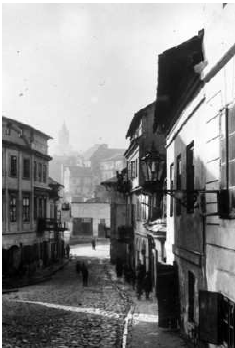
Zamkowa 3, kamienica druga od lewej, autor nieznany, przed 1939, własność Archiwum WUOZ w Lublinie.