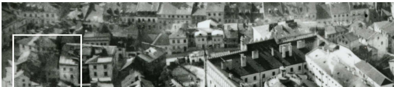
Fragment panoramy Lublina, lata 30., ul. Zamkowa/A fragment of panorama of Lublin in the 1930s, Zamkowa street,