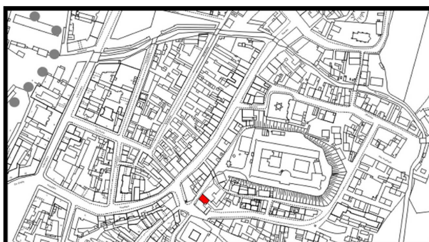
LOKALIZACJA NIERUCHOMOŚCI - Zamkowa 3 LOCATION OF THE PROPERTY - Zamkowa 3