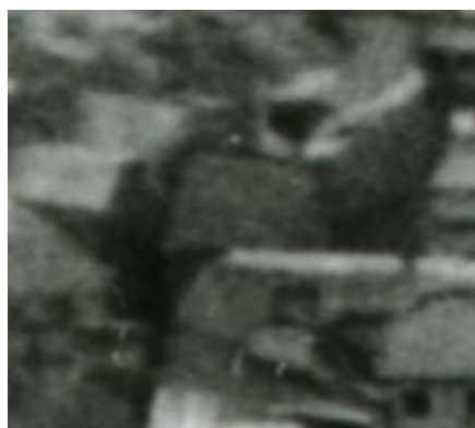
Fragment panoramy Lublina, lata 30., Zamkowa 4/A fragment of panorama of Lublin in the 1930s, Zamkowa 4,