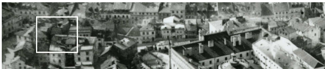
Fragment panoramy Lublina, lata 30., ul. Zamkowa/A fragment of panorama of Lublin in the 1930s, Zamkowa street,