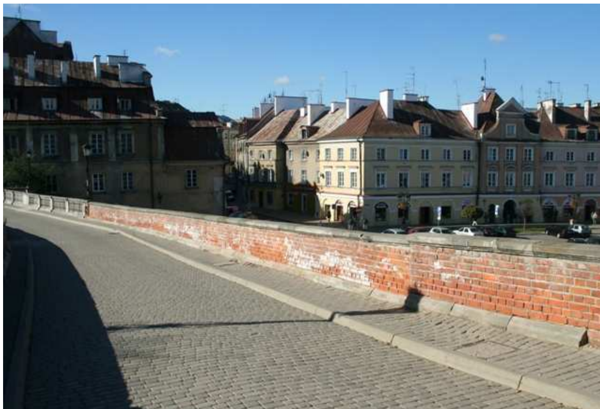
Zamkowa 4, fot. Marcin Fedorowicz, 2010.