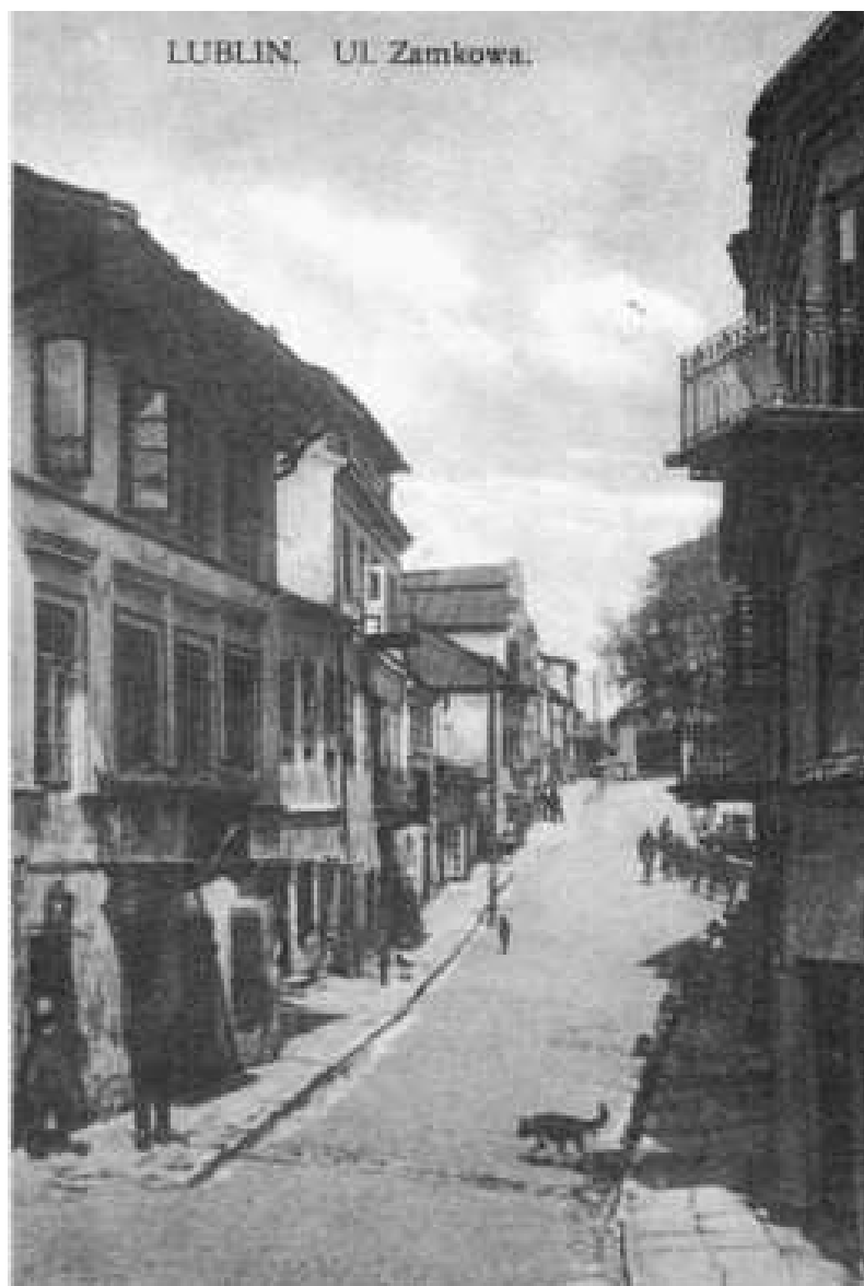
Zamkowa 4, kamienica druga od lewej, pocztówka, przed 1939.