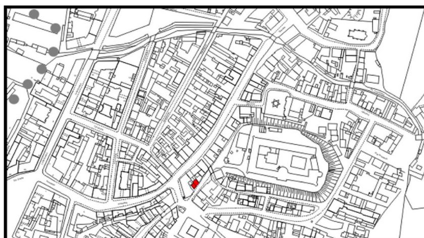
LOKALIZACJA NIERUCHOMOŚCI - Zamkowa 4 LOCATION OF THE PROPERTY - Zamkowa 4