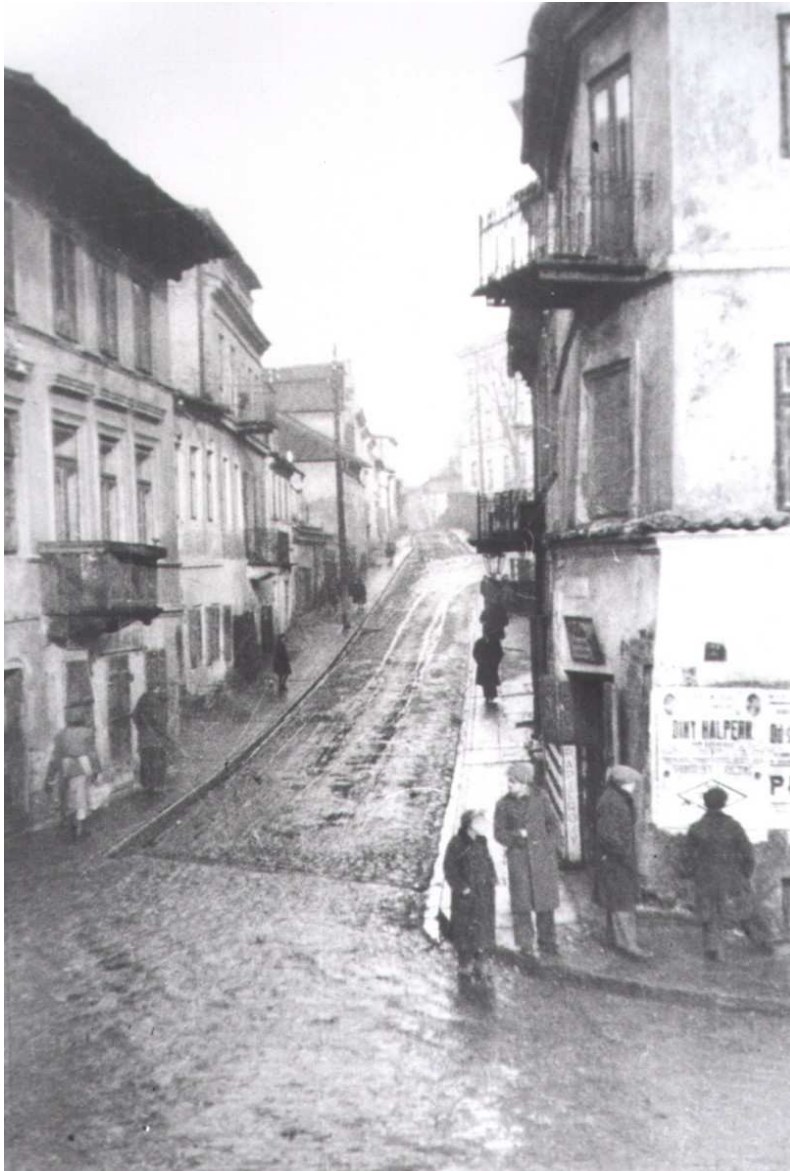
Zamkowa 4, nieruchomość druga od lewej, autor Józef Czechowicz, 1934, własność Muzeum Lubelskie, Oddział Literacki im. Józefa Czechowicza.