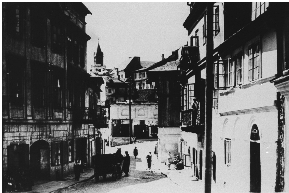
Zamkowa 5/Podzamcze 1, kamienica pierwsza od lewej, autor nieznany, przed 1939, własność Archiwum WUOZ w Lublinie.