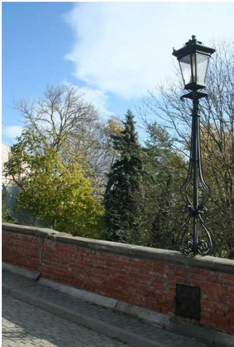
Zamkowa 5, fot. Marcin Fedorowicz, 2010.