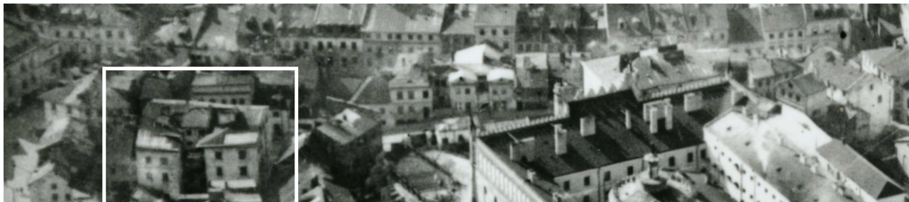
Fragment panoramy Lublina, lata 30., ul. Zamkowa/A fragment of panorama of Lublin in the 1930s, Zamkowa street,