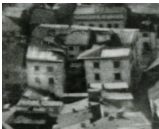
Fragment panoramy Lublina, lata 30., Zamkowa 5/ Podzamecze 3/A fragment of panorama of Lublin in the 1930s, Zamkowa 5/ Podzamecze 3,