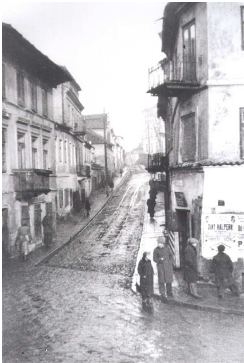
Zamkowa 6, nieruchomość trzecia od lewej