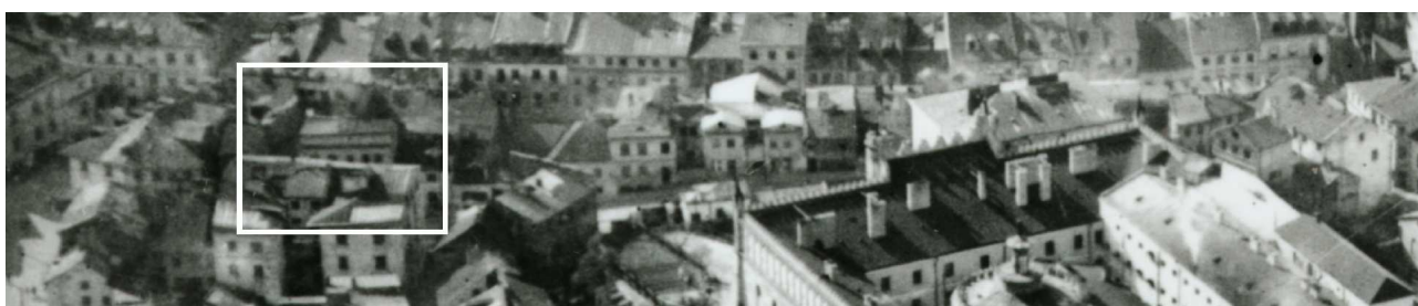
Fragment panoramy Lublina, lata 30., ul. Zamkowa/A fragment of panorama of Lublin in the 1930s, Zamkowa street,