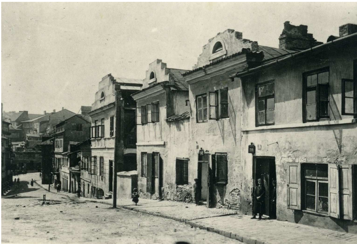
Zamkowa 6, nieruchomość siódma od prawej, autor nieznany, 1918, Samorządowa Fototeka Konserwatorska, Miejski Konserwator Zabytków.