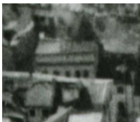
Fragment panoramy Lublina, lata 30., Zamkowa 6/A fragment of panorama of Lublin in the 1930s, Zamkowa 6,