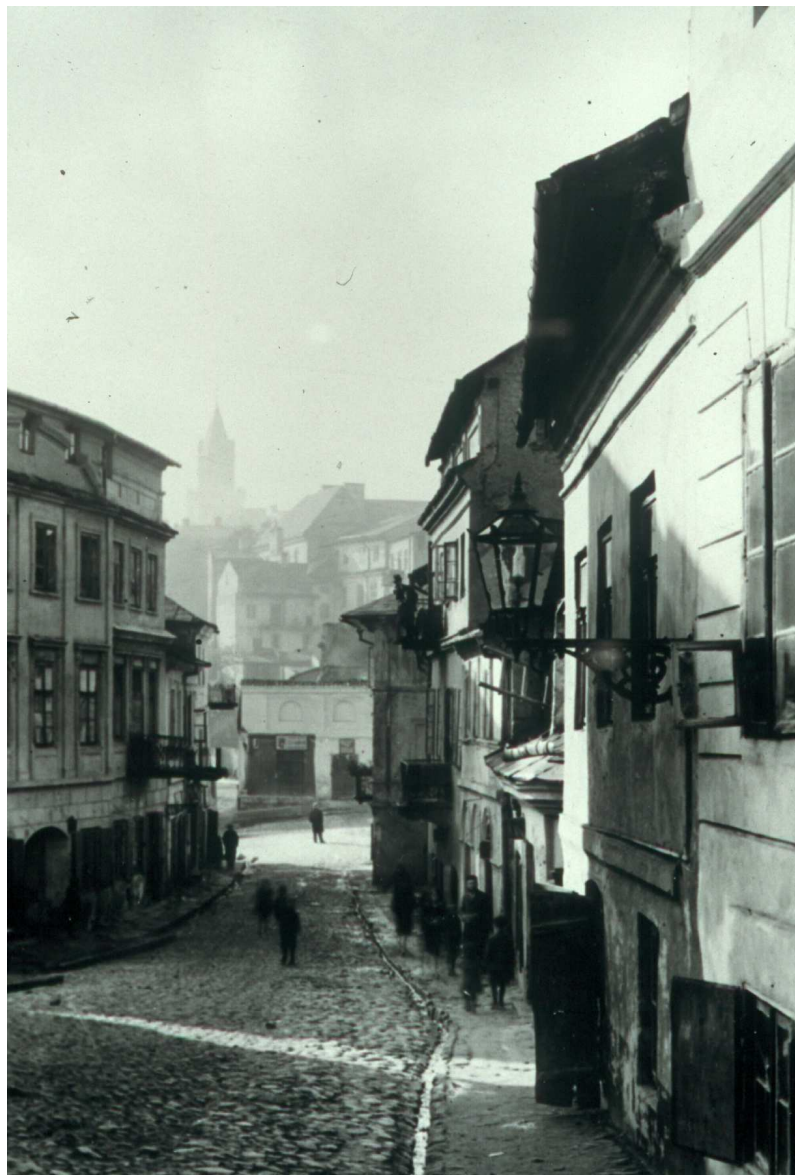
Zamkowa 6, kamienica piąta od lewej, autor nieznany, przed 1939, zbiory Archiwum WUOZ w Lublinie.