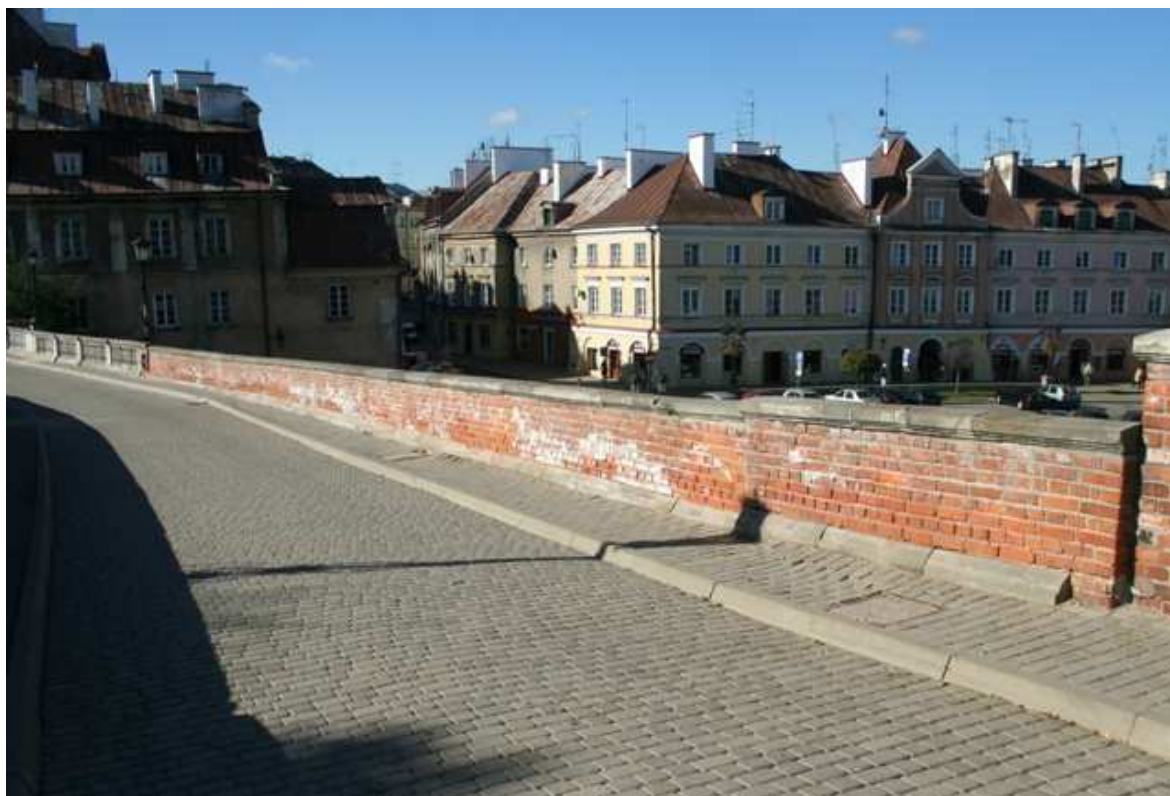
Zamkowa 6, fot. Marcin Fedorowicz, 2010.