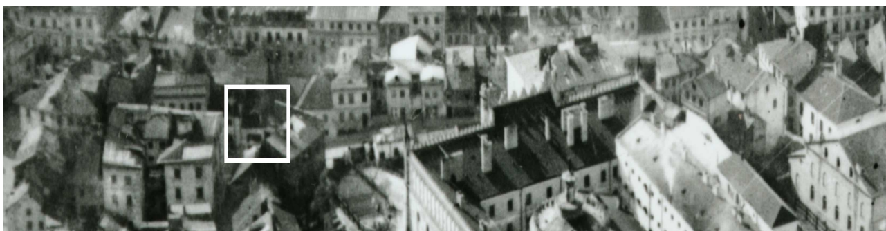
Fragment panoramy Lublina, lata 30., ul. Zamkowa/A fragment of panorama of Lublin in the 1930s,