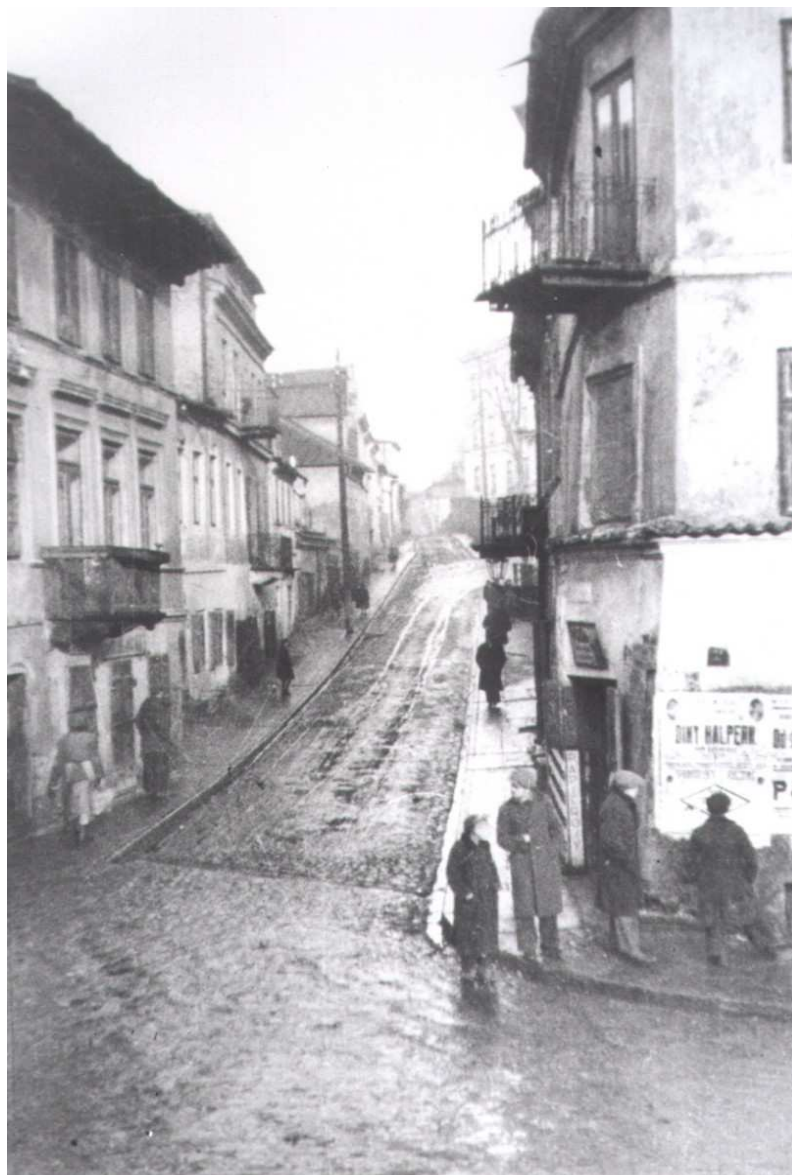
Zamkowa 8, nieruchomość czwarta od lewej, własność Muzeum Lubelskie, Oddział Literacki im. Józefa Czechowicza.