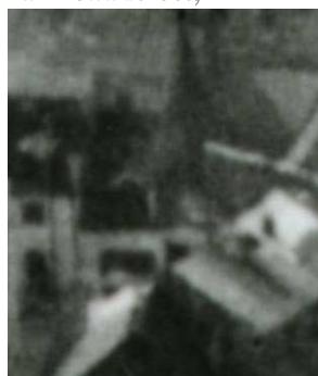
Fragment panoramy Lublina, lata 30., Zamkowa 10/A fragment of panorama of Lublin in the 1930s, Zamkowa 10,