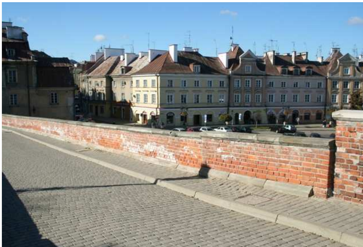
Zamkowa 8, fot. Marcin Fedorowicz, 2010.