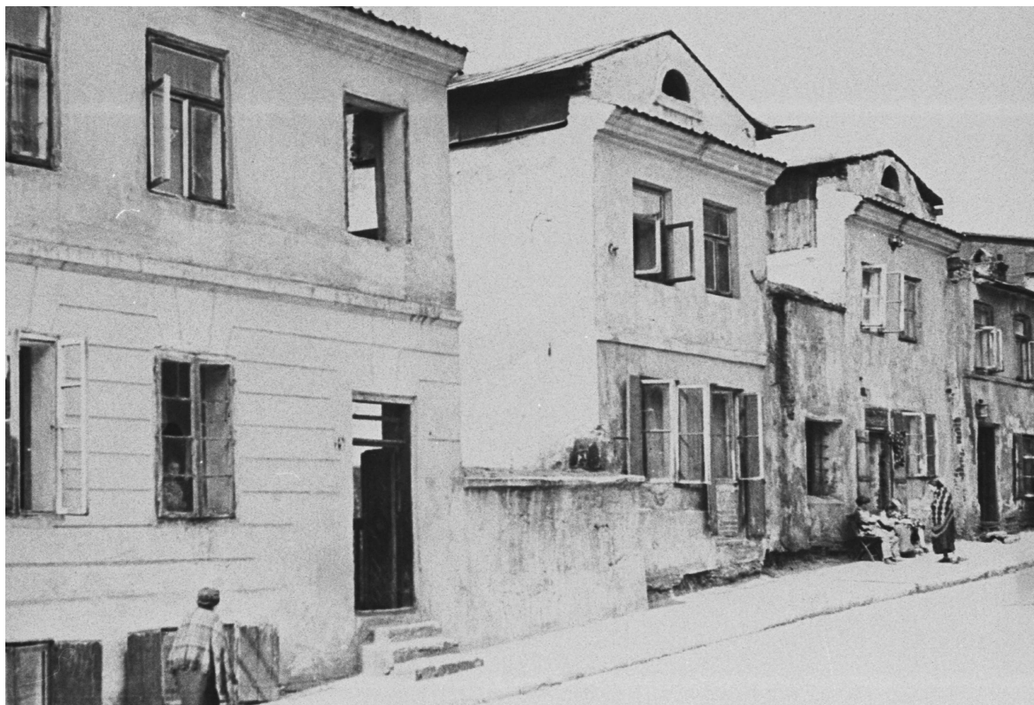
Zamkowa 14, nieruchomość pierwsza od lewej, autor nieznany, lata 30., ze zbiorów WUOZ w Lublinie.