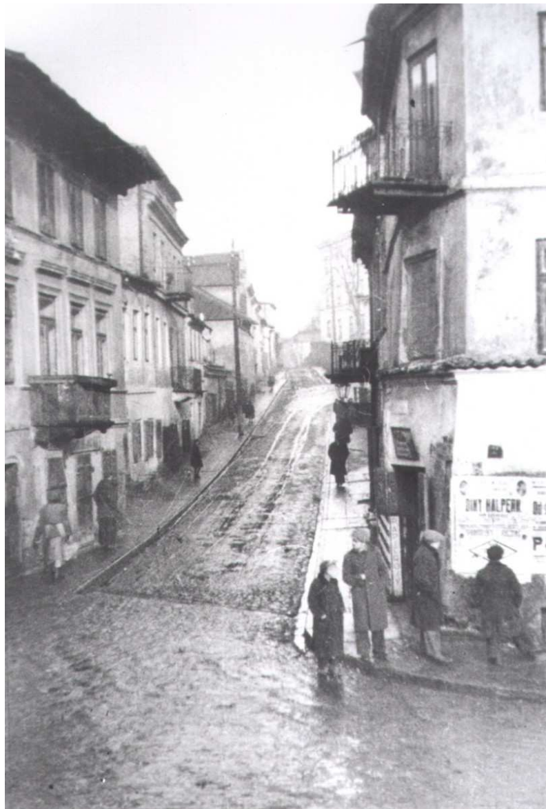
Zamkowa 14, nieruchomość siódma od lewej, 1934, własność Muzeum Lubelskie, oddział Literacki im. Józefa Czechowicza.