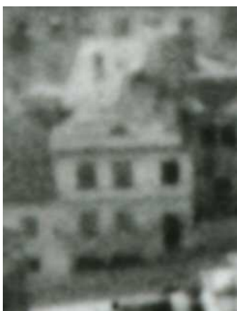
Fragment panoramy Lublina, lata 30., Zamkowa 14/A fragment of panorama of Lublin in the 1930s, Zamkowa 14,