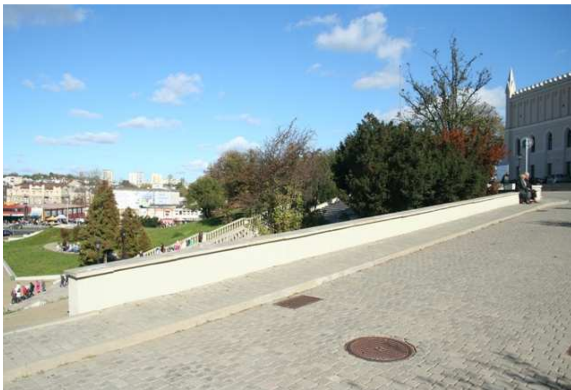
Zamkowa 14, 2010.