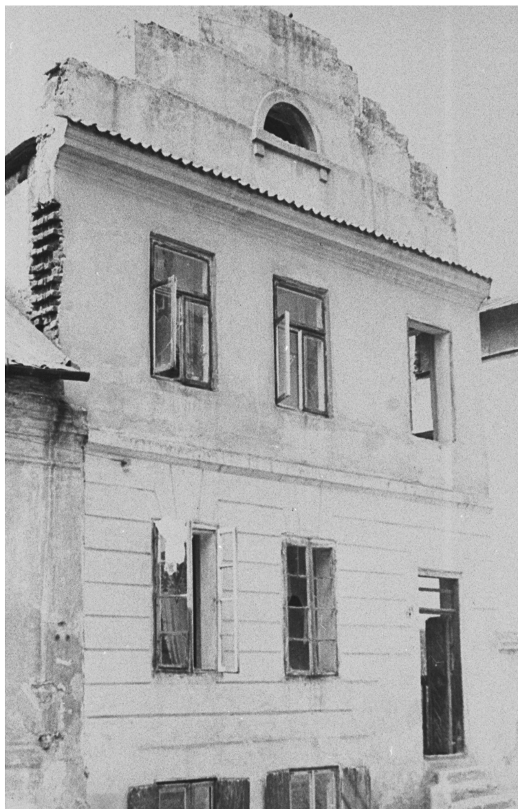
Zamkowa 14, autor nieznany, lata 30., ze zbiorów WUOZ w Lublinie.