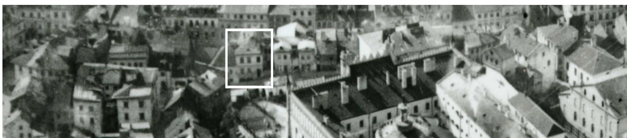
Fragment panoramy Lublina, lata 30., ul. Zamkowa/A fragment of panorama of Lublin in the 1930s, Zamkowa street,