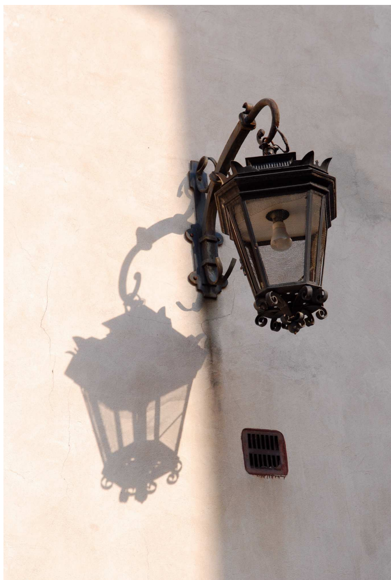
Detal, Rynek 2, 2010.