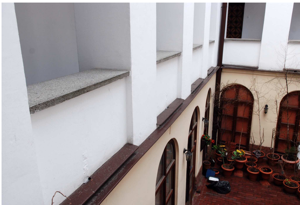
Podwórko, Rynek 2, fot. Marcin Moszyński, 2010.