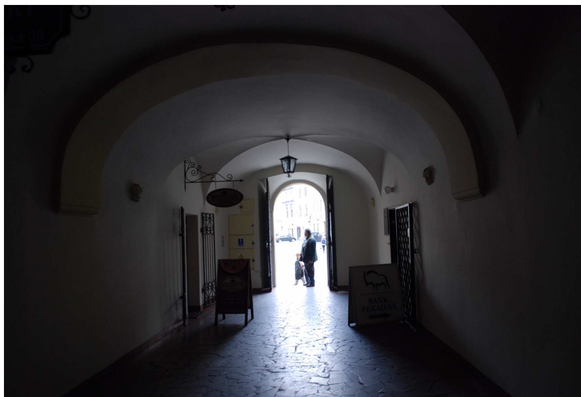
Sień, Rynek 2, 2010.