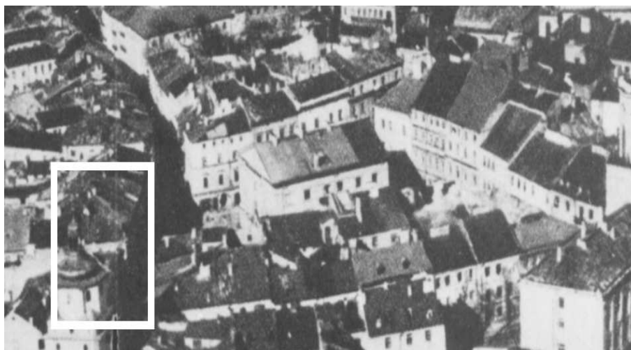
Fragment panoramy Lublina, lata 30., ul. Rynek/A fragment of panorama of Lublin in the 1930s, Rynek street,