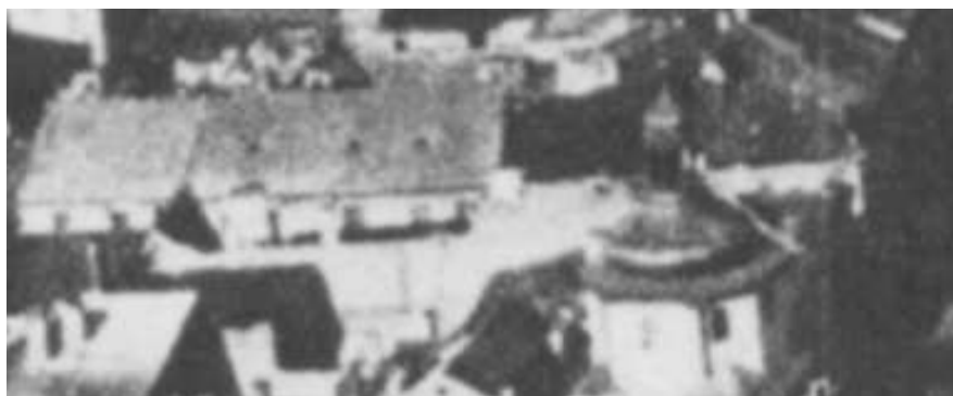
Fragment panoramy Lublina, lata 30., Rynek 2/A fragment of panorama of Lublin in the 1930s, Rynek 2,