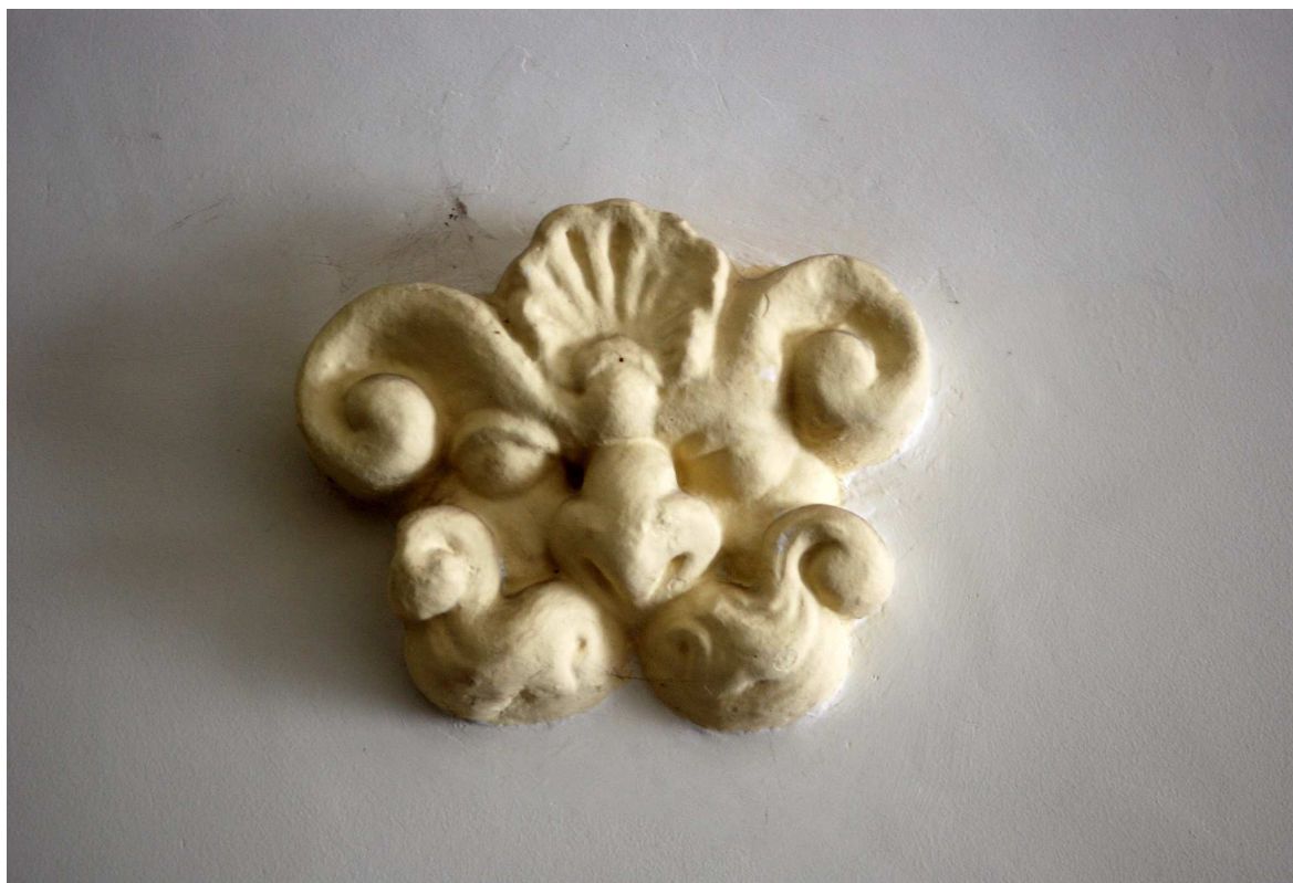
Detal, Rynek 2, fot. Marcin Moszyński, 2010.