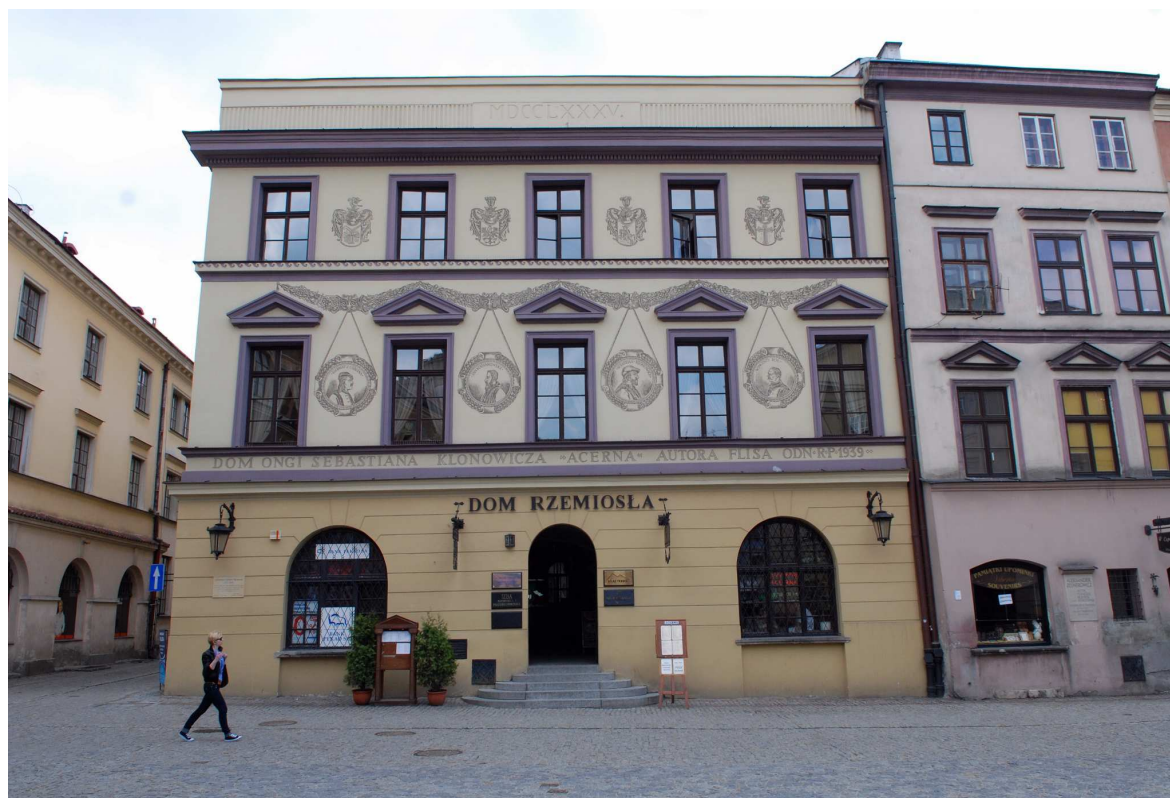
Fasada, Rynek 2, fot. Marcin Moszyński, 2010.