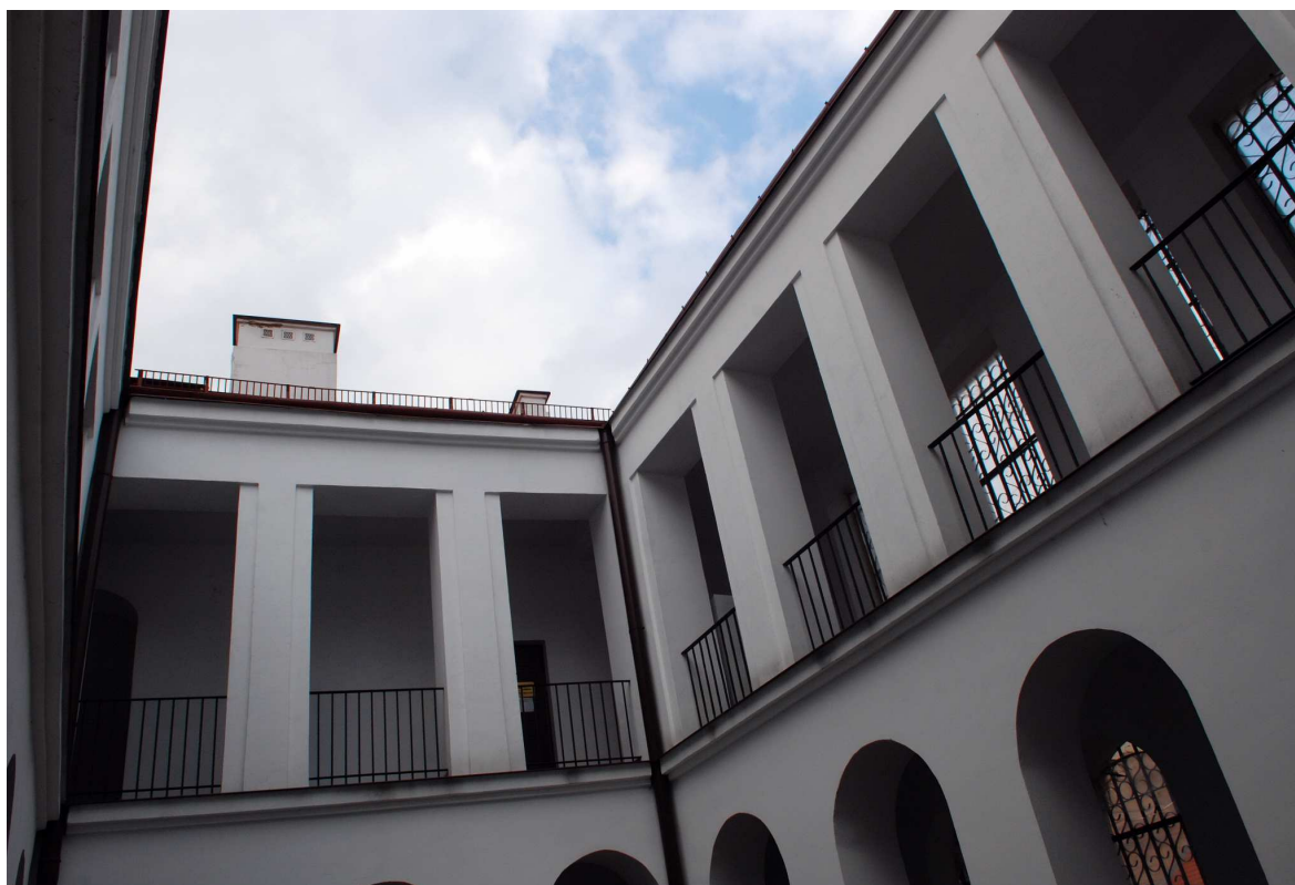
Podwórko, Rynek 2, fot. Marcin Moszyński, 2010.