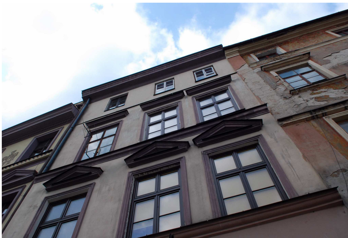
Fasada, Rynek 3, fot. Marcin Moszyński, 2010.