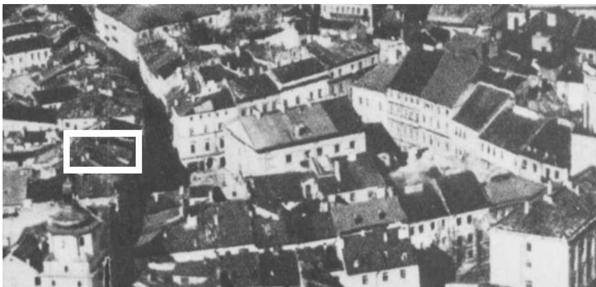
Fragment panoramy Lublina, lata 30., ul. Rynek/A fragment of panorama of Lublin in the 1930s, Rynek street,