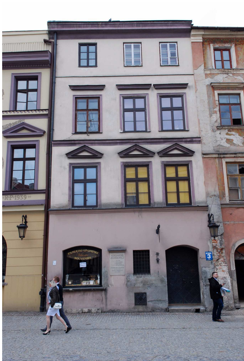
Fasada, Rynek 3, fot. Marcin Moszyński, 2010.