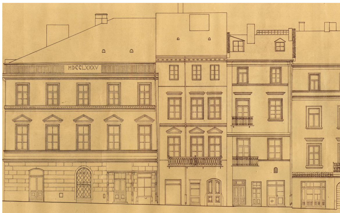
Rynek 3, autor Czesław Doria-Dernałowicz, 1936, własność rodziny, w depozycie Biblioteki Głównej Politechniki Lubelskiej.