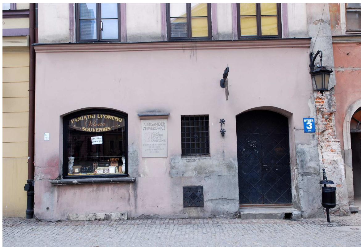
Przyziemie, Rynek 3, fot. Marcin Moszyński, 2010.