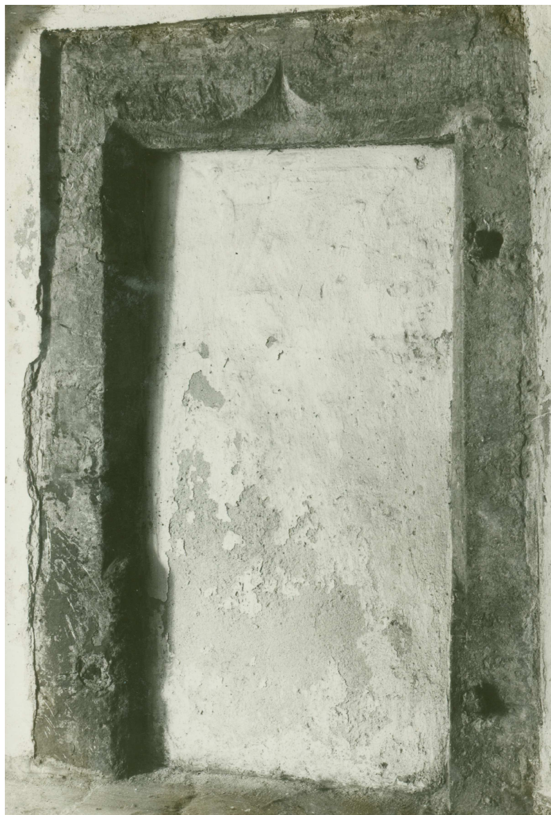
Rynek 3, portal kamienny, gotycki w sieni kamienicy, autor nieznany, zdjęcie z albumu „Zdjęcia z robót konserwatorskich Starego Miasta prowadzonych przez Wydział Budownictwa Zarządu Miasta w roku 1938-1939”, własność Miejski Konserwator Zabytków w Lublinie.