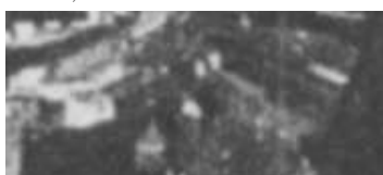
Fragment panoramy Lublina, lata 30., Rynek 3/A fragment of panorama of Lublin in the 1930s, Rynek 3,