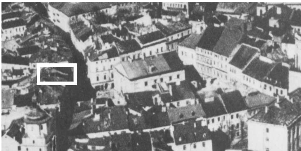
Fragment panoramy Lublina, lata 30., ul. Rynek/ A fragment of panorama of Lublin in the 1930s, Rynek street,