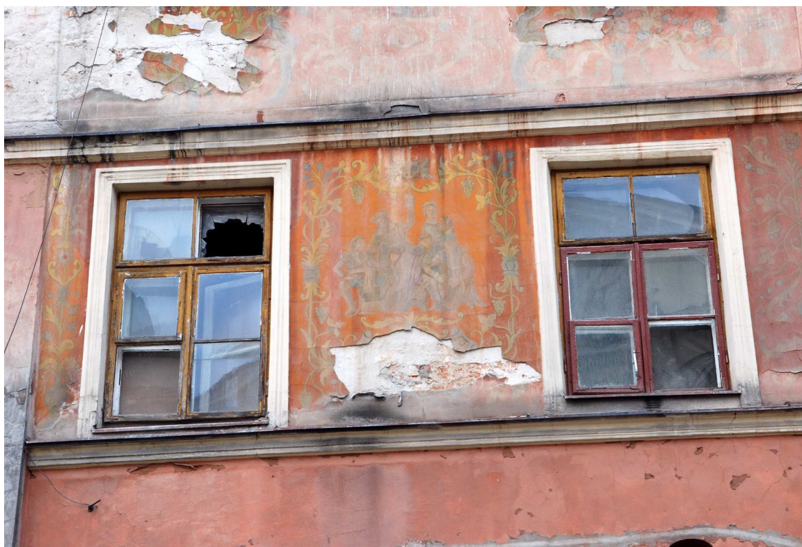
Detal, Rynek 4, fot. Marcin Moszyński, 2010.