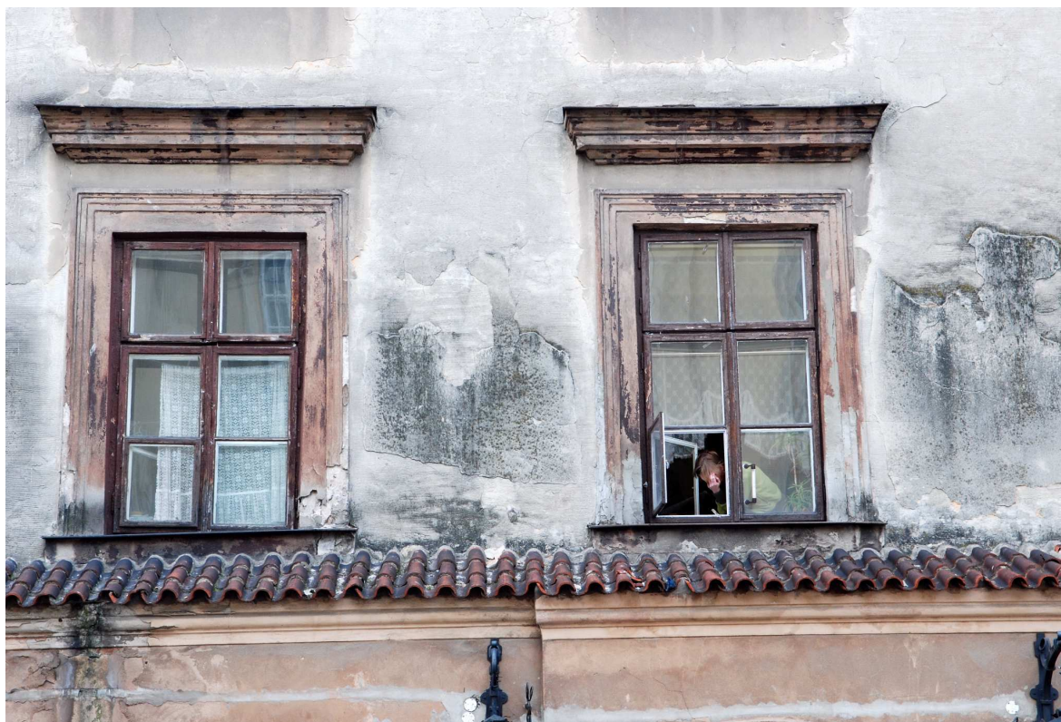
Detal, Rynek 4, fot. Marcin Moszyński, 2010.