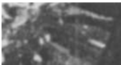
Fragment panoramy Lublina, lata 30., Rynek 4/ A fragment of panorama of Lublin in the 1930s, Rynek 4,