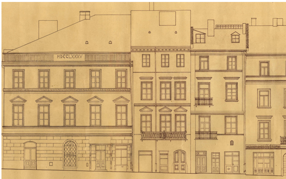
Rynek 4, kamienica trzecia od lewej, autor Czesław Doria-Dernałowicz, 1936, własność rodziny, w depozycie Biblioteki Głównej Politechniki Lubelskiej.