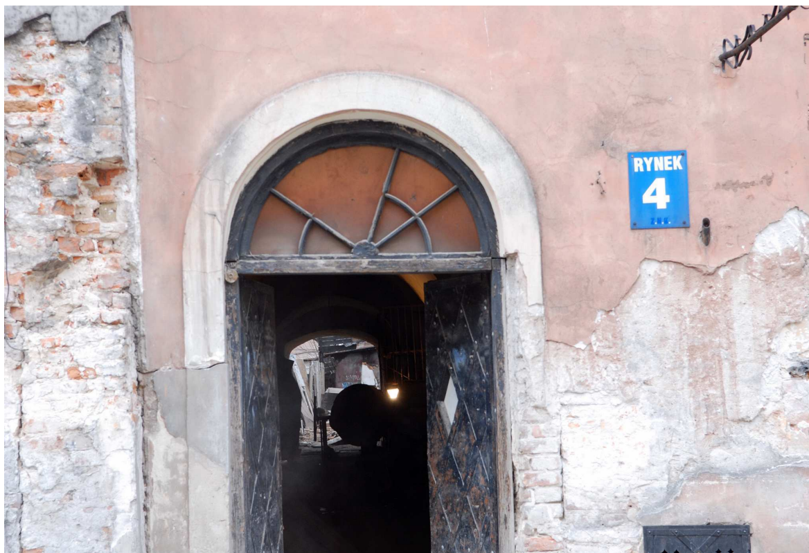
Detal, Rynek 4, fot. Marcin Moszyński, 2010.