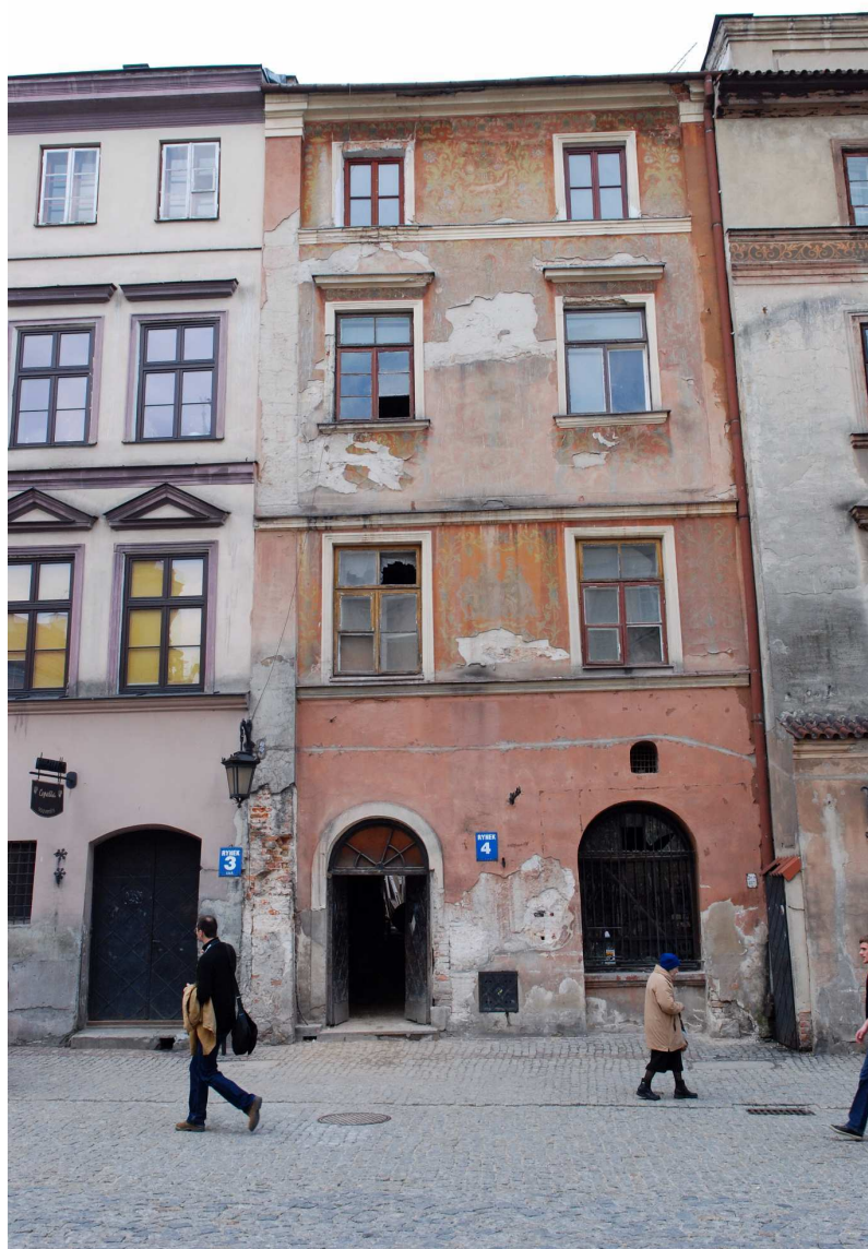
Fasada, Rynek 4, fot. Marcin Moszyński, 2010.