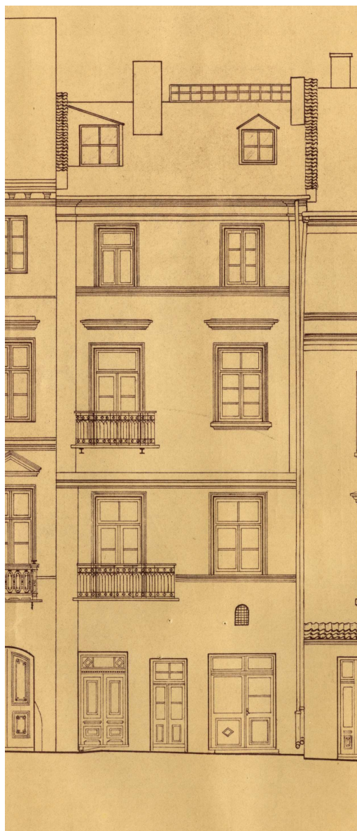
Rynek 4, autor Czesław Doria-Dernałowicz, 1936, własność rodziny, w depozycie Biblioteki Głównej Politechniki Lubelskiej.