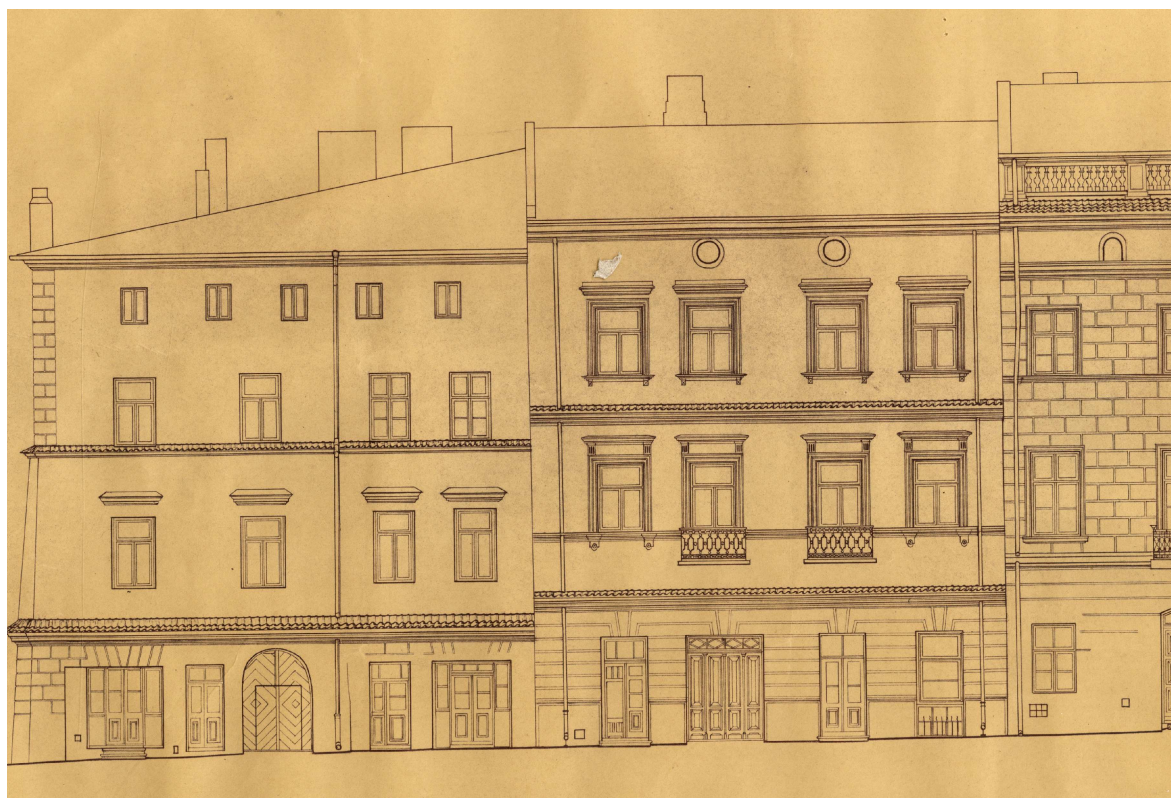
Rynek 6, autor Czesław Doria-Dernałowicz, 1936, własność rodziny, w depozycie Biblioteki Głównej Politechniki Lubelskiej.