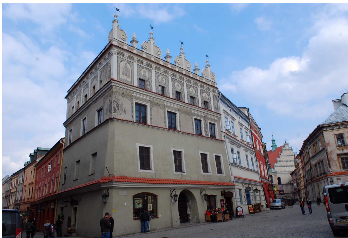
Fasada, Rynek 6, fot. Marcin Moszyński, 2010.