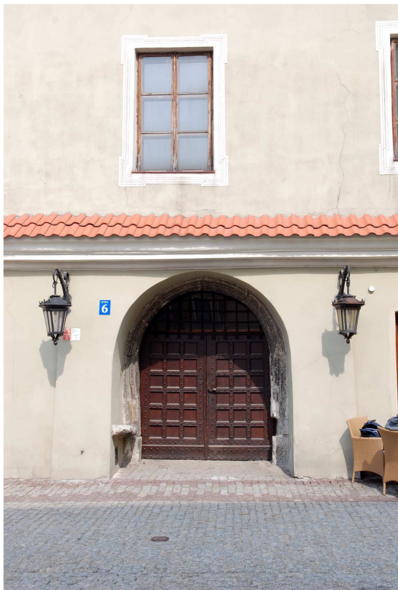
Przyziemie, Rynek 6, fot. Marcin Moszyński, 2010.