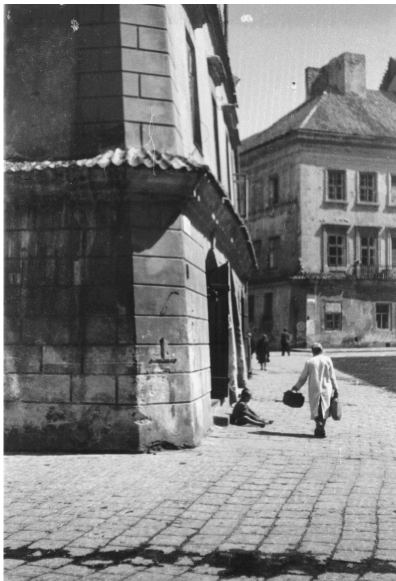
Rynek 6, róg Grodzkiej, autor nieznany, przed 1939.