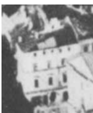
Fragment panoramy Lublina, lata 30., Rynek 6/A fragment of panorama of Lublin in the 1930s, Rynek 6,