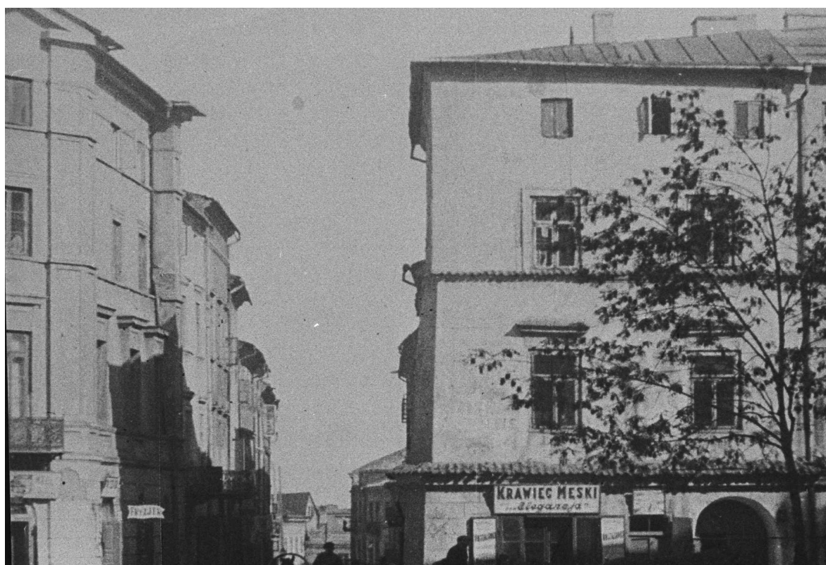
Rynek 6, róg Grodzkiej, autor nieznany, przed 1939.