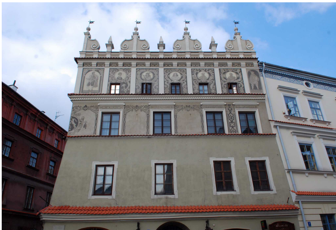
Elewacja główna, Rynek 6, fot. Marcin Moszyński, 2010.