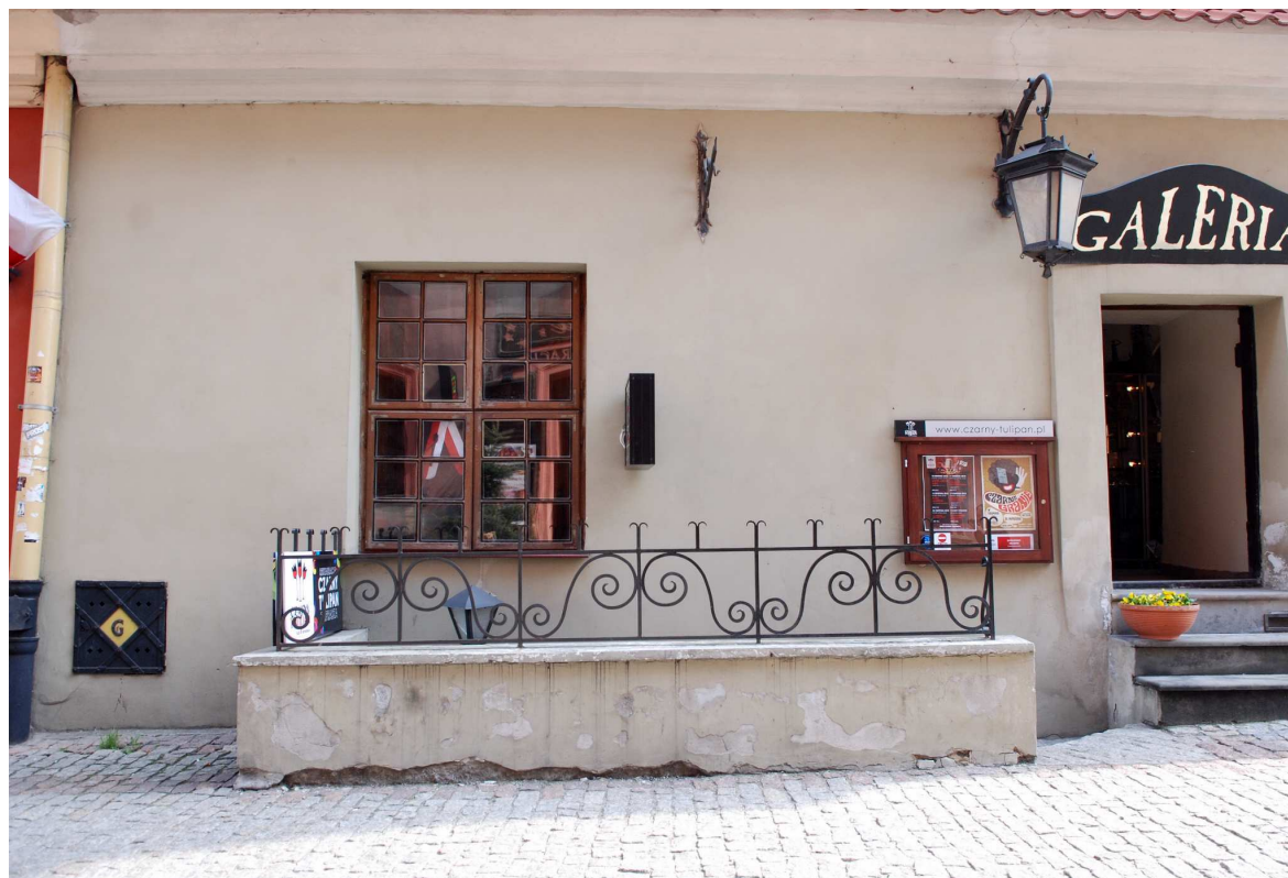
Przyzemie, Rynek 6, fot. Marcin Moszyński, 2010.