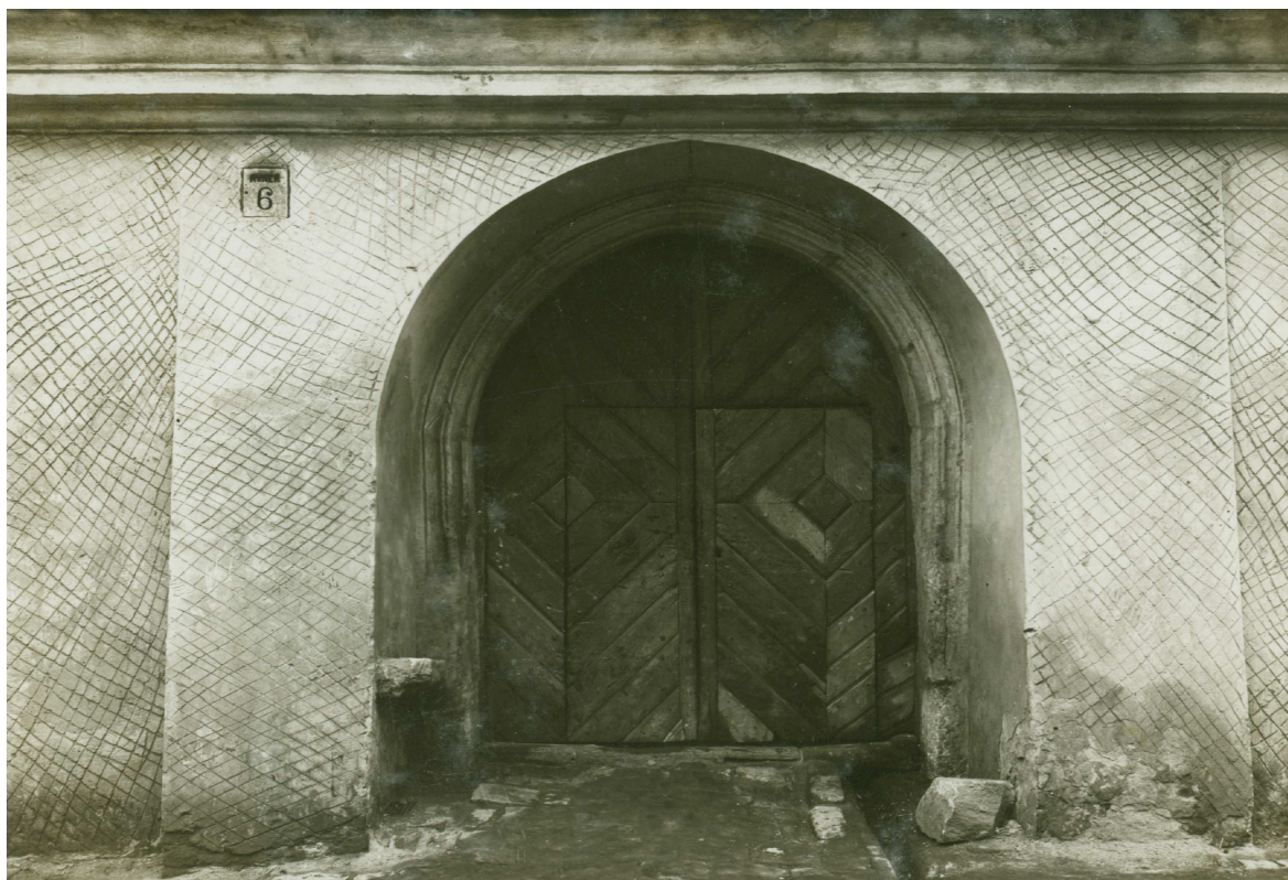
Rynek 6, portal kamienny, gotycki z XV wieku, autor nieznany, zdjęcie z albumu „Zdjęcia z robót konserwatorskich Starego Miasta prowadzonych przez Wydział Budownictwa Zarządu Miasta w roku 1938-1939”, własność Miejski Konserwator Zabytków w Lublinie.