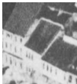
Fragment panoramy Lublina, lata 30., Rynek 12/A fragment of panorama of Lublin in the 1930s, Rynek 12,