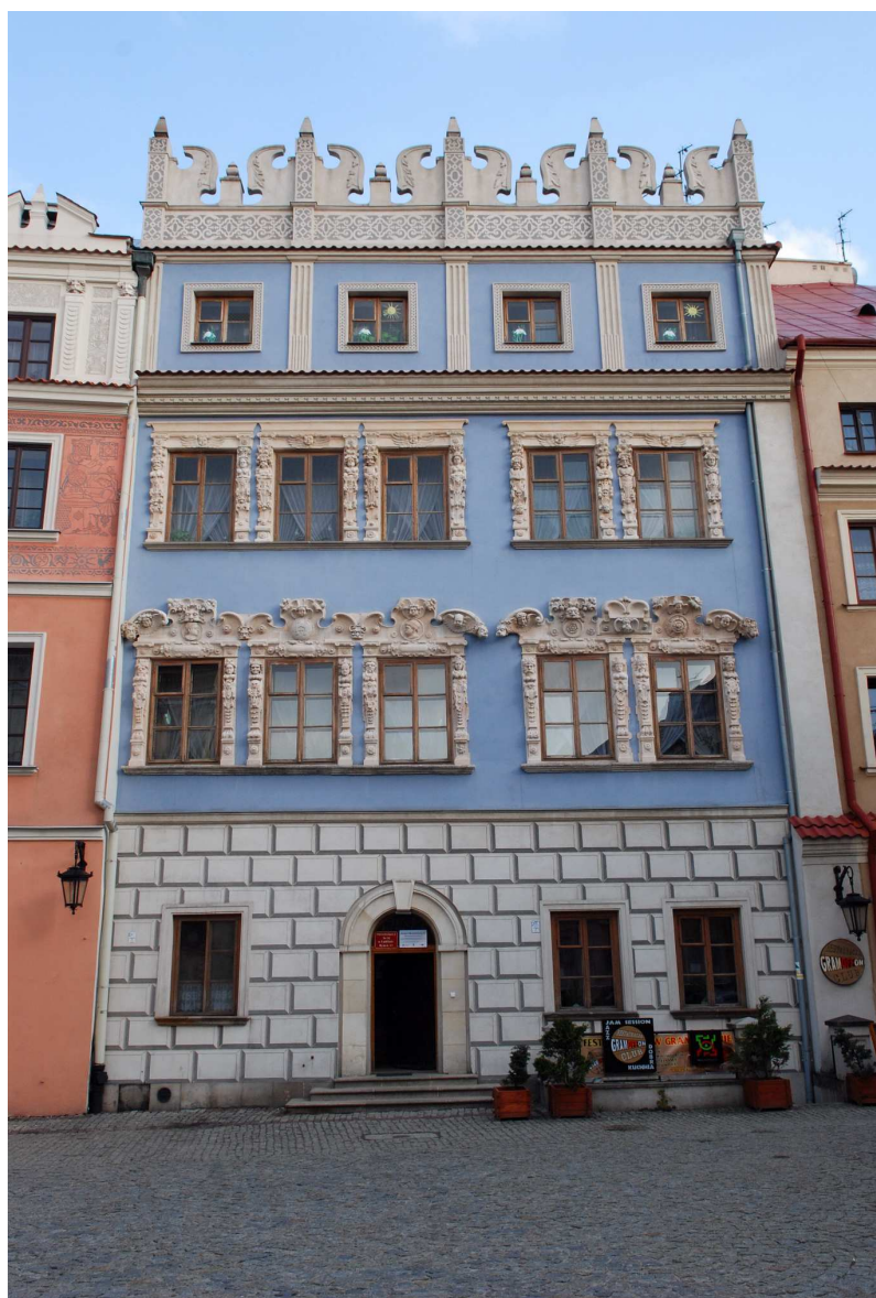
Fasada, Rynek 12, fot. Marcin Moszyński, 2010.