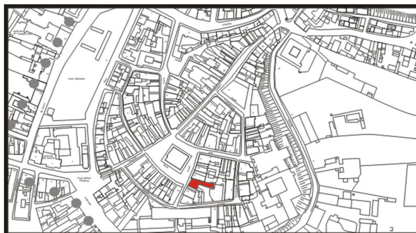
LOKALIZACJA NIERUCHOMOŚCI - Rynek 12 LOCATION OF THE PROPERTY - Rynek 12