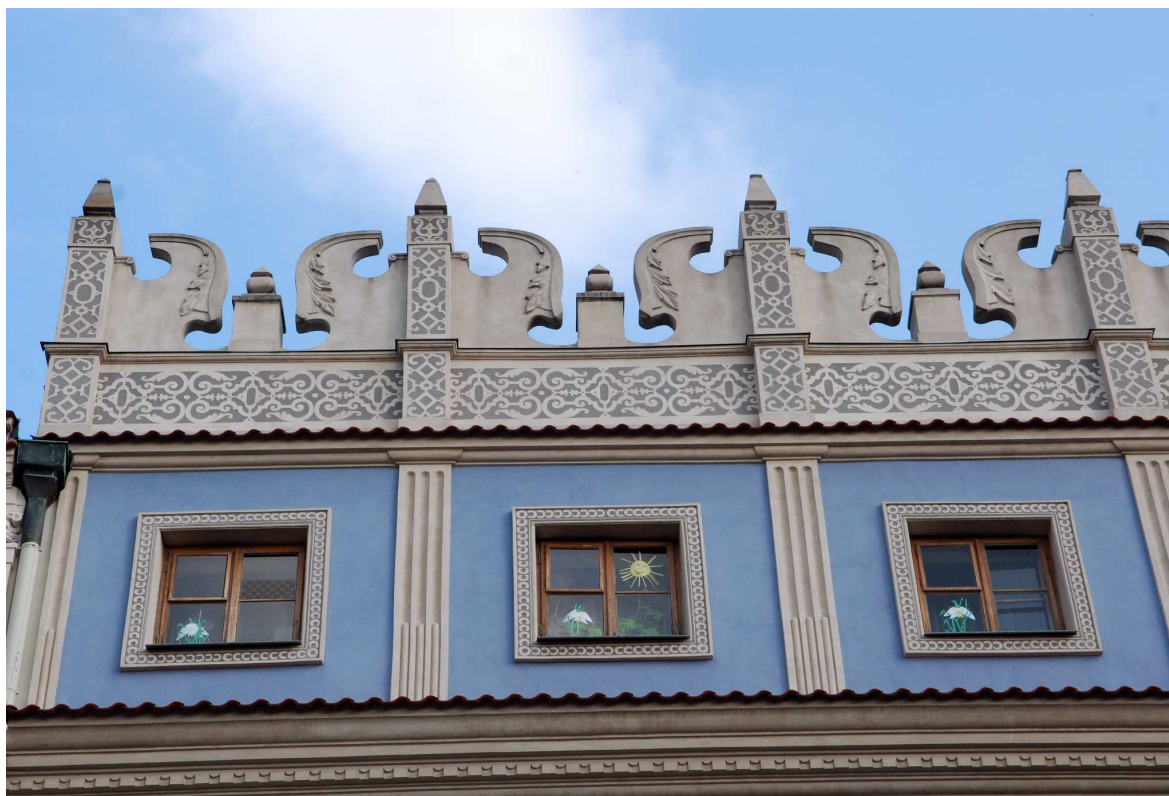
Attyka, Rynek 12, fot. Marcin Moszyński, 2010.