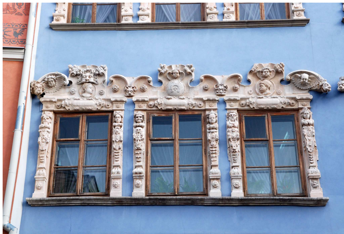
Detal, Rynek 12, fot. Marcin Moszyński, 2010.