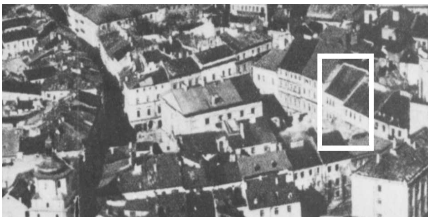
Fragment panoramy Lublina, lata 30., ul. Rynek/A fragment of panorama of Lublin in the 1930s, Rynek street,