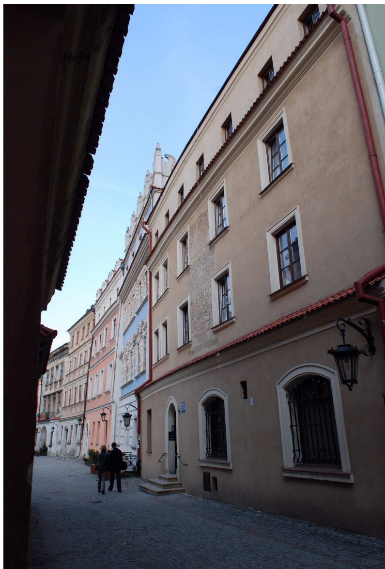
Fasada, Rynek 13, fot. Marcin Moszyński, 2010.