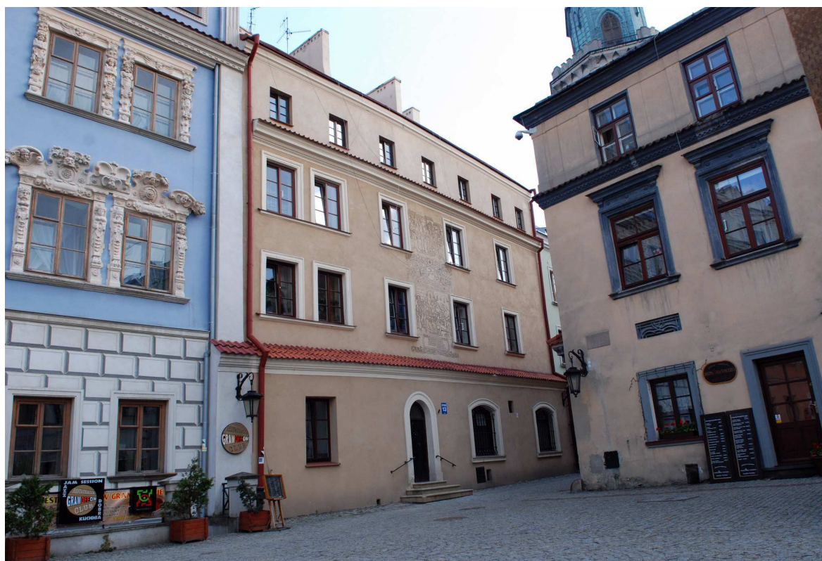
Fasada, Rynek 13, fot. Marcin Moszyński, 2010.