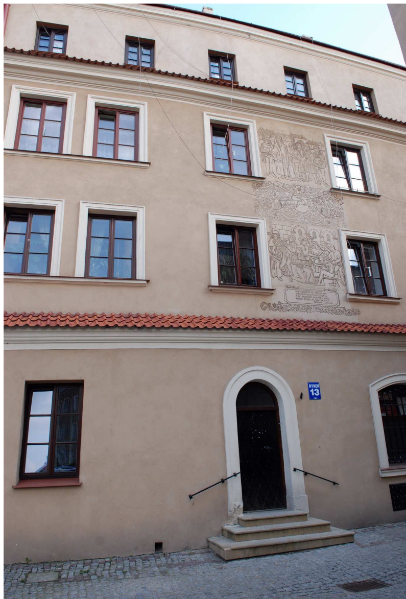
Fasada, Rynek 13, fot. Marcin Moszyński, 2010.