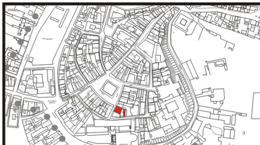
LOKALIZACJA NIERUCHOMOŚCI - Rynek 13 LOCATION OF THE PROPERTY - Rynek 13