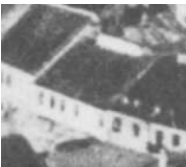
Fragment panoramy Lublina, lata 30., Rynek 13/A fragment of panorama of Lublin in the 1930s, Rynek 13,