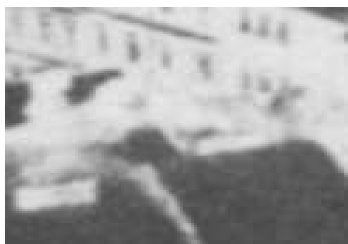
Fragment panoramy Lublina, lata 30., Rynek 15/A fragment of panorama of Lublin in the 1930s, Rynek 15,