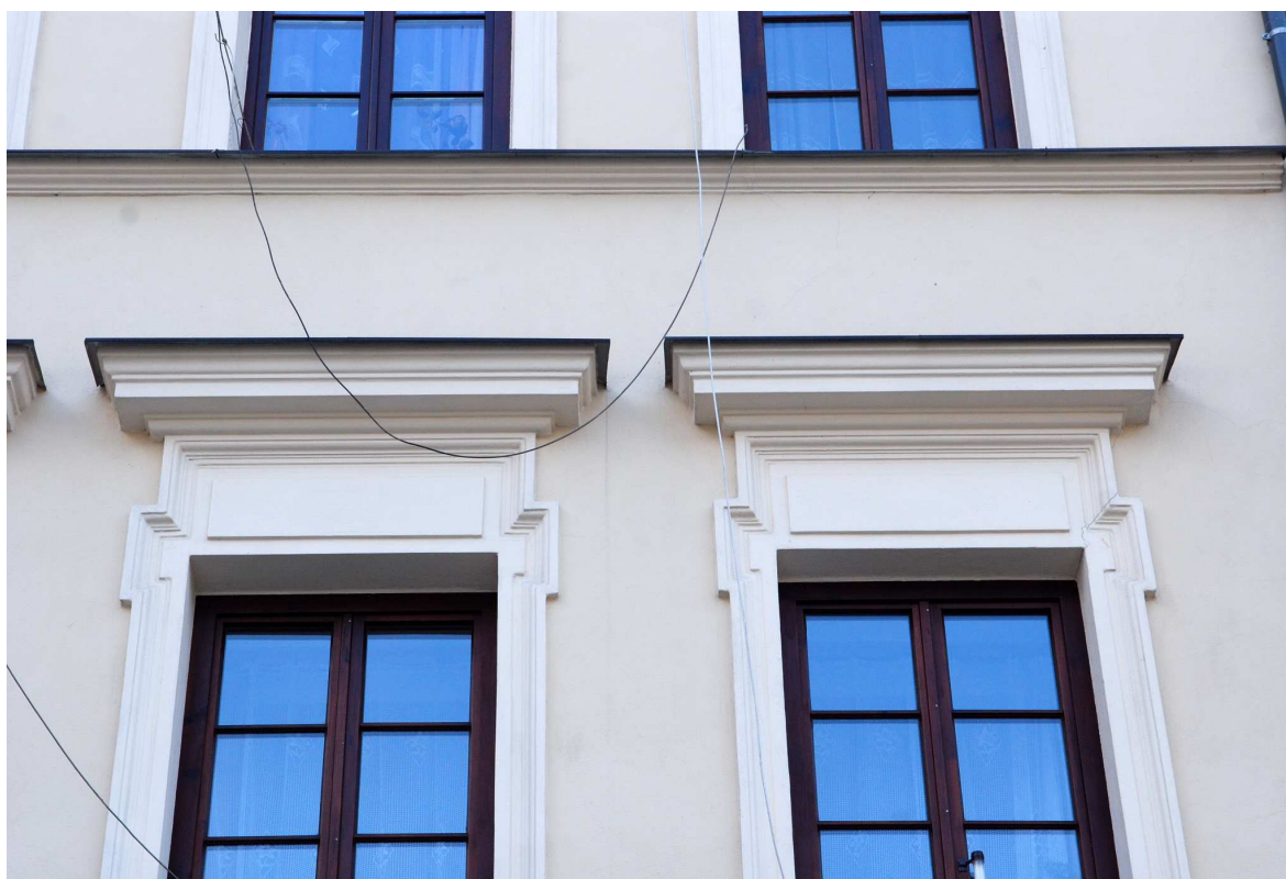
Detal, Rynek 15, fot. Marcin Moszyński, 2010.