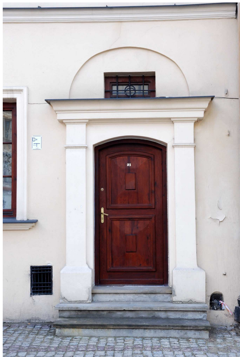
Detal, Rynek 15, fot. Marcin Moszyński, 2010.