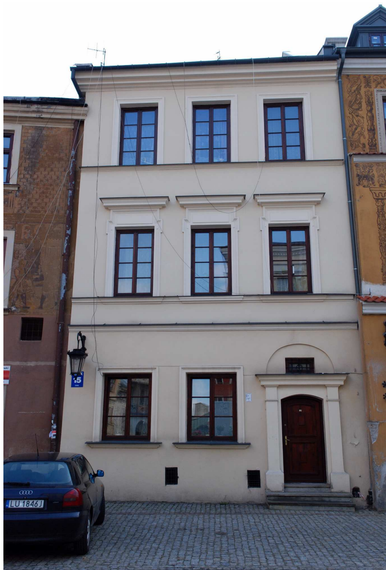
Fasada, Rynek 15, fot. Marcin Moszyński, 2010.