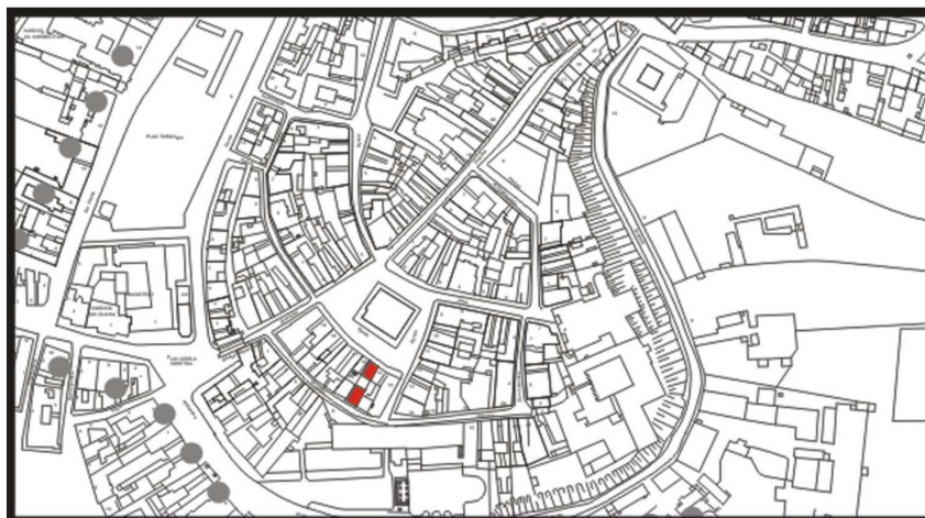
LOKALIZACJA NIERUCHOMOŚCI - Rynek 15 LOCATION OF THE PROPERTY - Rynek 15