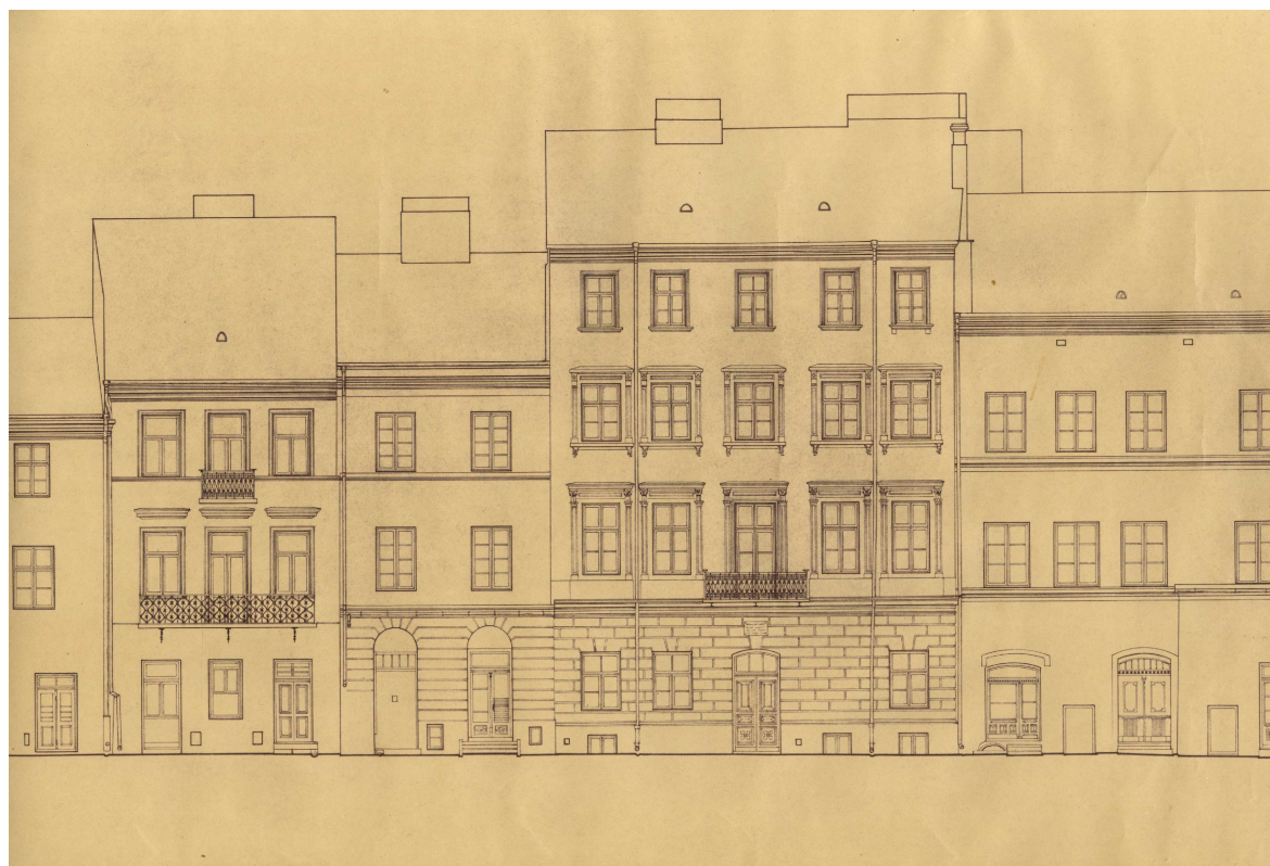
Rynek 15, autor Czesław Doria-Dernałowicz, 1936, własność rodziny, w depozycie Biblioteki Głównej Politechniki Lubelskiej.